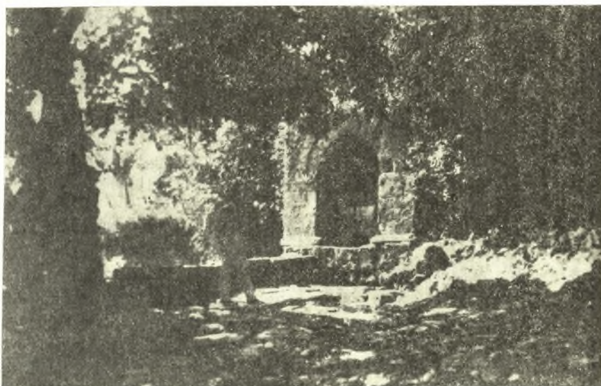
Εἰκ. 1. Ἡ Ἀρτακία Κρήνη, τὸ σύγχρονον «Πάγαθο».

Ἐκ τῶν ἀνωτέρω προκύπτει ὅτι κατὰ τοὺς προϊστορικοὺς χρόνους ὑπῆρχεν ἡ πόλις Ἀρίσβη ὁμώνυμος πρὸς τὴν μητέρα τοῦ Ἀσίου καὶ ἦτις ἦτο καὶ ἡ ἔδρα τοῦ Ἀσίου, ἐνῶ πιθανῶς ὁ Ὑρτακος ἔμενεν ἐν Ἀρτάκῃ. Ἡ πόλις Ἀρίσβη ἔκειτο παρὰ τὸν ποταμὸν Σελλήεντα οὗ μακρὰν τῆς Ἀβύδου· κατὰ τοὺς ιστορικοὺς χρόνους ἐθεωρεῖτο ἀποικία τῶν Μιλησίων ἢ τῶν Μυτιληναίων. Εἰς τὴν πόλιν ταύτην ἐπορεύθη ὁ Μ. Ἀλέξανδρος μετὰ τὸ τέ-