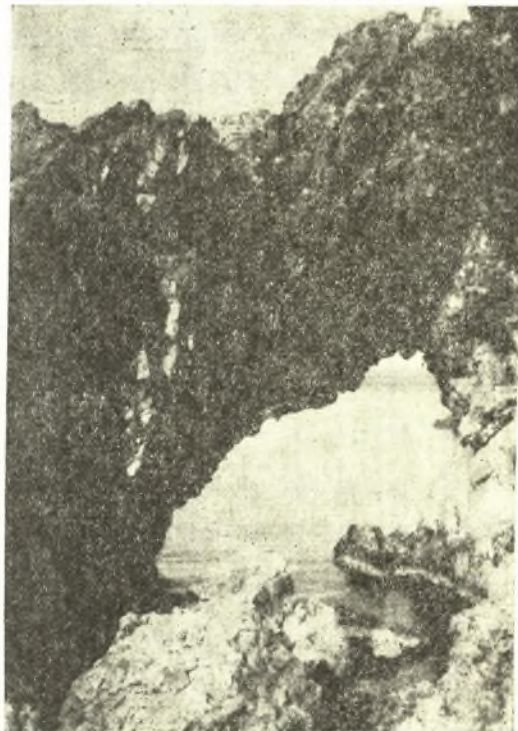
Εἰκ. 2. Ἡ Παναθύρα.

Παραθέτομεν περαιτέρω σχεδιογράφημα τῆς «Παναθύρας» καὶ φωτογραφίαν ληφθεῖσαν μεταγενεστέρως ὑπὸ φίλου μεταβάντος ἐκεῖ, ἥτις ὁμως, ὡς ληφθεῖσα ἀπὸ τῆς ξηρᾶς καὶ οὐχὶ ἀπὸ θαλάσσης, εἶναι μετρίως ἐνδεικτικὴ (εἰκ. 2 καὶ 3).