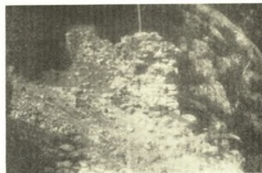
Εἰκ. 5. Ἡ βορεία παραστάς τοῦ πυλῶνος τοῦ φρουρίου τοῦ Πυλαίου, ἐν ἣ διακρίνεται ἡ ὀπή τοῦ ἀσφαλιστικοῦ μανδάλου.

τὰς χώρας ἢ τὰς ἐπαρχίας, ἐν αἷς τὰ φρούρια ταῦτα ἔχουσιν ἰδρυθῆ, ἐκτὸς δὲ τούτου τὰ πλεῖστα εἰλημμένα ἐκ τῆς Λατινικῆς ἢ ὄντα Λατινικὰ τοπωνύμια ἐκ κακῆς ἢ ἀστόχου μεταφορᾶς αὐτῶν εἰς τὴν ἑλληνικὴν παραμένουσιν ἀσαφῆ καὶ