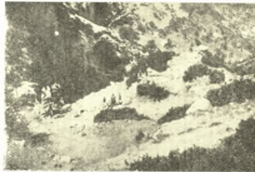
Εἰκ. 4. Τὰ ἐρείπια τῆς «Πόρτας» τοῦ φρουρίου τοῦ Πυλαίου. Ἄποψις ἀπὸ ΝΔ.

δρέων πόλις... Εὐρώπη». Ἀλλὰ καὶ τὸ χωρίον τοῦτο τοῦ Προκοπίου παρέχει ἀρκετὰς δυσκολίας. Ὁ συγγραφεὺς δηλ. ἀναγράφων ἐν τῷ καταλόγῳ τὰ τοπωνύμια τῶν ὑπὸ τοῦ βασιλέως ἀνεγερθέντων φρουρίων, δὲν ὀρίζει ἀκριβέστερον