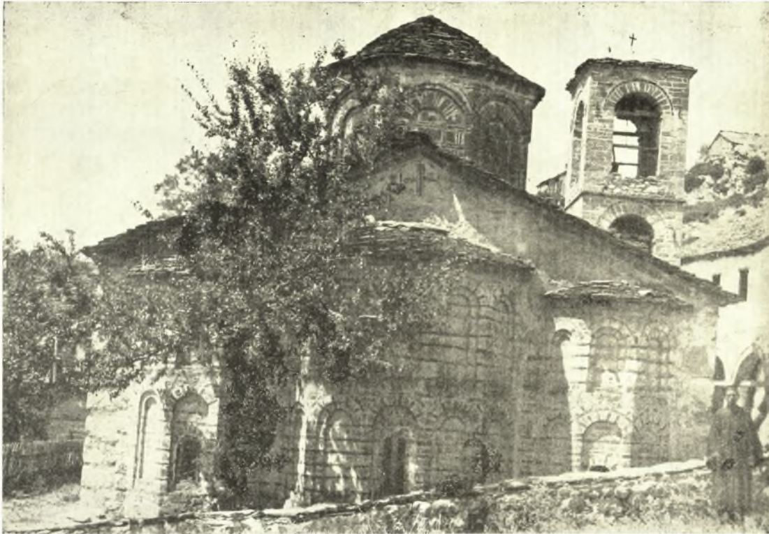
Εἰκ. 6. Ἄψις καὶ κόγχαι τῆς ἀνατολικῆς πλευρᾶς τοῦ Καθολικοῦ τῆς Ἱ. Μονῆς τοῦ Πυλαίου.

ἐπιγραφῆν ἡμῶν ἄρχονται διὰ τοῦ «Σταυροπήγιον ἁγιασθὲν» καὶ θὰ ἠδύνατό τις νὰ υποθέσῃ, ὅτι τὸ καθολικὸν εἶχεν ἀνεγερθῆ παλαιότερον καὶ καθηγιασθῆ ὡς Σταυροπήγιον τὸ 1633, ἂν μὴ εἰς τὴν ἐξωτερικὴν πλευρὰν τοῦ νοτίου χώρου ἦτο ἀναγεγραμμένον διὰ κεράμων τὸ αὐτὸ ἔτος.