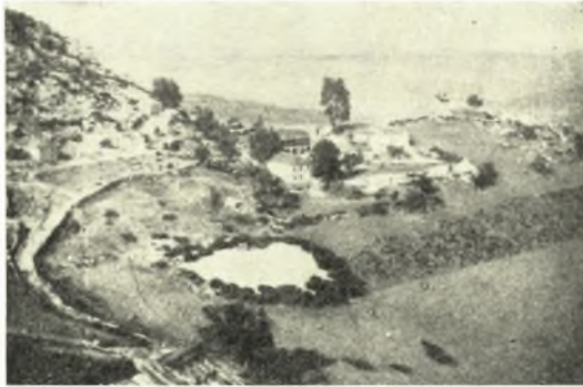
Εἰκ. 1. Ἀποψὶς τῆς Μονῆς Πυλαίου ἀπὸ ΝΔ.

Θέσις. Ὁ ἀπὸ Γρεβενῶν πρὸς Σαμαρίναν ὀδεύων παρὰ τὸν Γρεβενίτικον ποταμόν, παραπόταμον τοῦ Ἀλιάκμονος, συναντᾷ κατὰ τὸ 20 ὸν χιλιόμετρον πρὸς δυσμὰς ἓνα τῶν νοτιοανατολικῶν προβούνων τοῦ χιονοσκεποῦς τὸ πλεῖστον τοῦ ἔτους Σμόλικα (ὑψ. 2547) τῆς ὄρειας τῆς Πίνδου, ὑψηλὸν καὶ ἀπότομον,