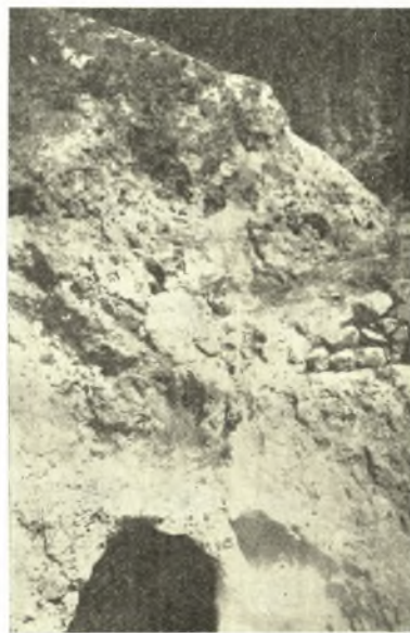
Εἰκ. 4. Ἡ ἀτοίχιστος νοτιὰ πλευρὰ τοῦ ὑπαιθρίου ἱεροῦ, ὅπου ἡ μικρὰ σπηλαιώδης ἐσοχὴ τοῦ βράχου.

ὑπάρχει, ἐπιμελῶς λελαξευμένη, μικρὰ κόγχη ὕψους 0.50 καὶ πλάτους 0.30 τοῦ μέτρου.