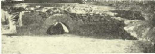
Εἰκ. 12. Ἀψίς ἐν τῷ βορείῳ τοίχῳ τῆς αὐλῆς Θ ὀπισθεν.

δου μόνον 0.35 μέτρου. Τὸ ἐλάχιστον τοῦτο ὕψος ἀποκλείει πᾶσαν χρῆσιν, οὐδ' ἐστίας ἐξαιρουμένης, φανερώσει ὅτι ἡ καμάρα αὕτη, παραμείνασα ἀνέπαφος ἐκ πιθανῆς καταστροφῆς ἀρχαιότερου κτίσματος, ἀπετέλεσεν, ὑστερώτερον, ὑλικὸν τοῦ βορείου τοίχου τῆς αὐλῆς (εἰκ. 12·