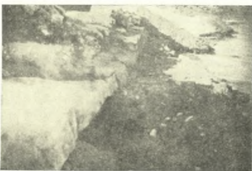
Εἰκ. 9. Τὸ κρηπιδώμα τῆς ἀποβάθρας.

ἐβεβαίωσαν ἡμᾶς οἱ ἐντόπιοι, ὑπερέχει τῆς ἐπιφανείας τῆς θαλάσσης περὶ τὰ 0.50 μ., ἀπέχει ταύτης περὶ τὰ δύο μέτρα καὶ σφύζεται εἰς μῆκος 60 μέτρων ἐν εὐθείᾳ γραμμῇ. Τὸ μνημεῖον σύγκειται ἐκ κρηπιδώματος καὶ κτιστοῦ τοίχου. Τὸ κρηπιδώμα, ὕψους 0.60 μ., ἀποτελεῖται κατὰ μὲν τὸ μέσον τοῦ ὅλου μήκους καὶ μόνον εἰς μῆκος 21 μέτρων, ἐκ δύο δόμων ἐξ ὀγκολί-