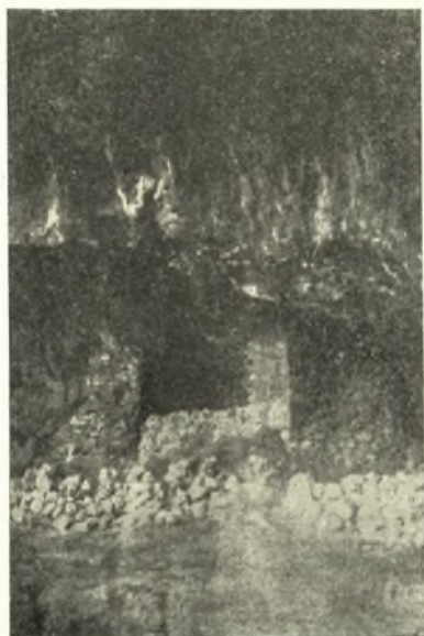
Εἰκ. 5. Ὁ «Μαραθόσπηλιος» μετὰ τῶν ἐρειπίων μικρᾶς ἐκκλησίας νεωτέρων χρόνων ἐν τῷ ἐσωτάτῳ βάθει αὐτοῦ.

τὸ σχῆμα βράχος ἦτο καθιερωμένος εἰς θεότητά τινα καὶ ὅτι ἐν τῇ κόγχῃ τοῦ μικροῦ σπηλαίου ἦτο τοποθετημένος τὸ λατρευτικὸν ταύτης εἰδωλόν. Παρὰ τὴν ἐπιμελῆ ἔκκαθάρσιν καὶ τοῦ μικροῦ τούτου σπηλαίου καὶ τῆς ἀνωθεν τούτου μικρᾶς πλατείας, οὐδαμοῦ ἀνεύρομεν στοιχεῖα—εἰδώλια ἢ ὄστρακα—πρὸς χρονολόγησιν τοῦ ὑπαιθροῦ τούτου ἱεροῦ 1 . Ἐκ τῆς