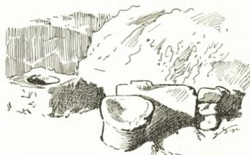
Εἰκ. 11. Τὸ δωμάτιον Ζ ἐνθα τὸ φρέαρ καὶ γούρνα ἐκ δωρικοῦ κιονοκράνου.

αὐτὴν Θ. Ἐν τῷ δωματίῳ Ζ εὐρίσκονται φρέαρ μετὰ λιθίνου στομίου, λίθος ὀρθογωνίου σχήματος μετ' ἐντύπου κύκλου, διὰ τὴν στερέωσιν πιθανῆς βάσεως ξυλίνου κίονος, καὶ γούρναν κατεσκευασμένην ἐκ δωρικοῦ κιονοκράνου. Τὸ κιονόκρανον τοῦτο (ὑψ. 0.44, πλ. ἄβακος 0.60 καὶ διάμ. 0.43 μ.) ἔχει κάτω τετράγωνον ὀπὴν πρὸς στερέωσιν κατωτέρου σπονδύλου, ἄνω δὲ κωνικὸν ἔχοντα τρεῖς δακτυλίους (εἰκ. 11).