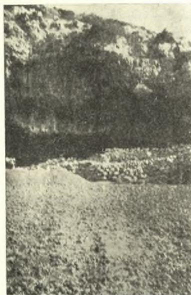
Εἰκ. 6. Πλατεῖα ἀναπαύσεως πρὸ τοῦ «Μαραθόσπηλιου».

κὸν ἢ ἀνώτερον ὕψος κατὰ τὸ ἄνοιγμα 10.50 καὶ μέγιστον βάθος 43 μέτρων. Κατὰ τὸ ἐσωτάτον βάθος σφύζεται, ἀλλ' ἡμικατεστραμμένη, μικρὰ ἐκκλησία νεωτέρων χρόνων, τῆς ὁποίας ἢ μὲν βόρειος πλευρὰ εἶναι αὐτὸς οὗτος ὁ βράχος τοῦ σπηλαίου, αἱ δ' ἄλλαι τρεῖς ἀποτελοῦνται ἐκ ξηρολιθικῶν τοίχων, οὔτινες φέρουσι καὶ ὄλικὸν ἀρχαιοτέρας, πιθανῶς Βυζαντινῶν χρό-