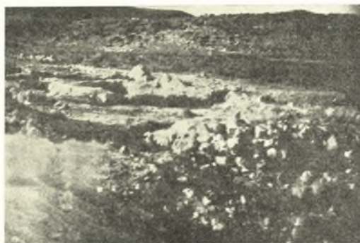
Εἰκ. 10. Τὸ ἀποκαλυφθὲν τμήμα τοῦ παραλιακοῦ συνοικισμοῦ.

τεμαγίων καὶ ἐξ ἀρῶαβδώτων μαρμαρίων κυλινδρικῶν σπονδύλων κίωνων διαμέτρου 0.30-0.40 μ. (εἰκ. 9). Τὸ γεγονός ὅτι τὸ κρηπιδώμα (ἴτοι τὰ θεμέλια τῆς ἀποβάθρας) ὑπερέχει τῆς ἐπιφανείας τῆς θαλάσσης καὶ εὐ-