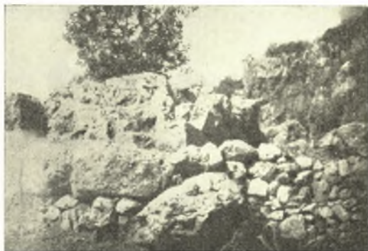
Εἰκ. 2α. Βορεία πλευρὰ τοῦ ἀναλημματικοῦ τοίχου τοῦ ὑπαιθρίου ἱεροῦ.

Ὁ τοίχος, ἀποτελούμενος ἐξ ὀγκολίθων σκληροῦ ἐγγωρίου τιτανολίθου, ἀκανονίστων μὲν τὸ σχῆμα καὶ ἀνίσων τὰς διαστάσεις, ἐξωτερικῶς ὁμως πελεκημένων ἀδρομερῶς πως, καὶ ἀκολουθῶν τὴν φυσικὴν διαμόρφωσιν τοῦ ἔδαφους,