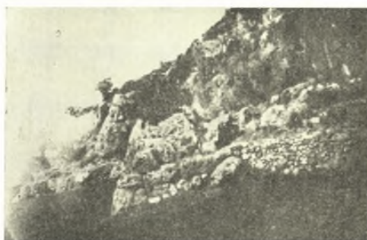
Εἰκ. 2β. Ἀνατολικὴ πλευρὰ τοῦ ἀναλημματικοῦ τοίχου τοῦ ὑπαιθρίου ἱεροῦ.

ἀνέρχεται ποῦ μὲν εἰς τρεῖς, ποῦ δὲ εἰς τέσσαρας δόμους, καὶ πλαισιοῖ τὸν βράχον εἰς τὸ ὕψος του τῶν 2.25 μέτρων. Ἐνταῦθα σχηματίζεται, οὔτω, περὶ τὸν βράχον, τεχνητῶς ἰσοπεδωμένη διὰ χωμάτων καὶ χαλίκων, μικρὰ πλατεῖα, ἐκ τοῦ κέντρου τῆς ὁποίας ἐγείρεται, ἐλεύθερος πλέον καὶ θεατός, ὁ κωνοειδῆς βράχος εἰς ὕψος 2.25 μέτρων (εἰκ. 2α-β). Κατὰ τὴν νοτιάν ὁμως πλευρὰν του ὁ βράχος μένει ἀκάλυπτος καὶ ἀπροστάτευτος ὑπὸ τοίχου (εἰκ. 3), τοῦτο μὲν διότι ἡ πλευρὰ αὕτη εἶναι λίαν ἀπότομος, τοῦτο δέ, κυρίως, διότι κατὰ τὸ ἔδαφος φέρει μικρὰν σπηλαιώδη ἐσοχὴν (εἰκ. 4), τῆς ὁποίας ἡ μὲν εἴσοδος ἔχει