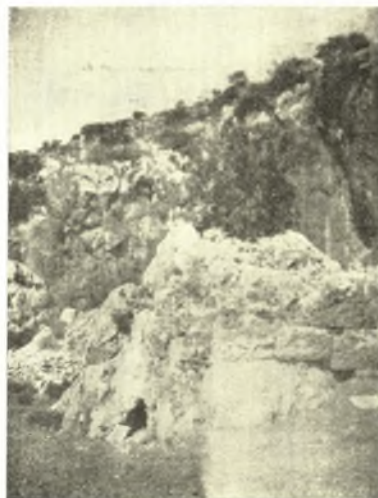
Εἰκ. 3. Ἡ νοτιὰ ἀκάλυπτος πλευρὰ τοῦ ὑπαιθρίου ἱεροῦ.

πλάτος 0.60 καὶ ὕψος 1.60, τὸ δὲ βάθος 2 μέτρων. Ἐντὸς τοῦ μικροῦ τούτου σπηλαίου καὶ ἐπὶ τῆς βόρειας βραχίονος παρειᾶς αὐτοῦ