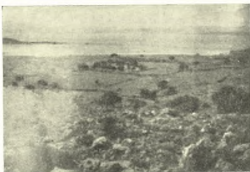
Εἰκ. 8. Ἡ παρὰ τὴν ἀκτὴν καὶ ἀπέναντι τῆς νησίδος θέσις τοῦ ἀρχαίου παραλιακοῦ συνοικισμοῦ ἐν τῇ κοιλάδι «Μαράθι».

Καὶ πρῶτον, ἡ ἀνασκαφεῖσα ἀποβάθρα, τῆς ὁποίας τὸ ὄρατόν τμήμα ἀνεφάνη πρὸ τινων ἐτῶν συνεπεία σφοδρᾶς θαλασσοταραχῆς, ὡς