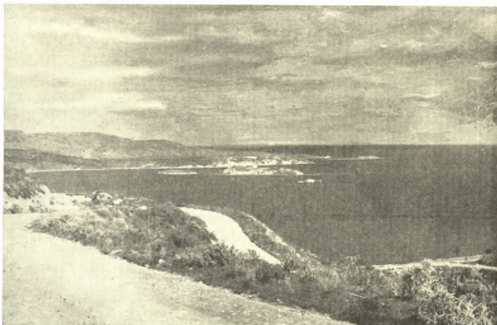
Εικ. 1. Ὁ κόλπος τῆς Σούδας μετὰ τῆς νοτιοανατολικῆς πλευρᾶς τοῦ ἀκρωτηρίου Κυάμου (νῦν Ἀκρωτήρι), ὅπου εὐρίσκεται ἡ κοιλάς «Μαράθι», ἀπέναντι τῆς ἐξωτερικῆς νησίδος τῆς Σούδας.