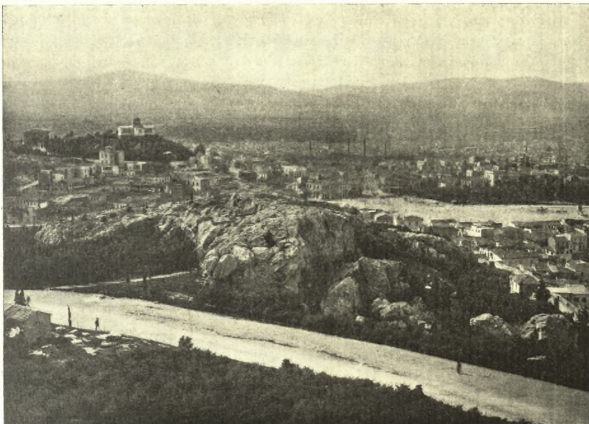
Εἰκ. 3. Βλέπουσα ἐξ Α ἀπὸ τοῦ ἄλλου τὸν Ἄρειον Πάγον μετὰ τὴν ὁδὸν ἐμπρός, δεξιὰ (τὸ λευκάζον μέρος) τὸν ἀγοραῖον Κολωνόν ἢ τὴν πλατεῖαν τοῦ «Θησείου» καὶ ἀριστερὰ ἐπὶ τοῦ λόφου τῶν Νυμφῶν τὸ ἀστεροσκοπεῖον. Πέραν ὁ Αἰγάλεως (ἀριστ.) καὶ τὸ Ποικίλον (δεξ.), ὧν μεταξὺ διέρχεται ἡ ἱερὰ ὁδὸς πρὸς Ἐλευσίνα.

ὁποῖον εἶχε σεβασθῆ ἢ πρότασις τοῦ Λάμπωνος καὶ ὁ δῆμος. Ἡ ἔκφρασις τοῦ χρονικοῦ τοῦ Ἀσκληπιείου περὶ τῆς ἀμφισβητήσεως ταύτης (Dittenberger 3 88, 14 ἐξ.) δεικνύει, ὅτι ἡ ἀμφισβήτησις αὕτη τῶν Κηρύκων δὲν ἐδικαιώθη ὥστε τὸ Ἀσκληπιεῖον ἐκράτησεν, ὅσον χῶρον κατεπάτει ὁ Τηλέμαχος ὑπὸ διαφόρους δικαιολογίας. Ἡ τοιαύτη μάλιστα μερικὴ περὶ χωρίου τινός, τοῦτέστιν περὶ ὁρίων μόνον καὶ οὐχὶ ῥιζικὴ ἀμφισβήτησις τοῦ ὅλου χώρου,