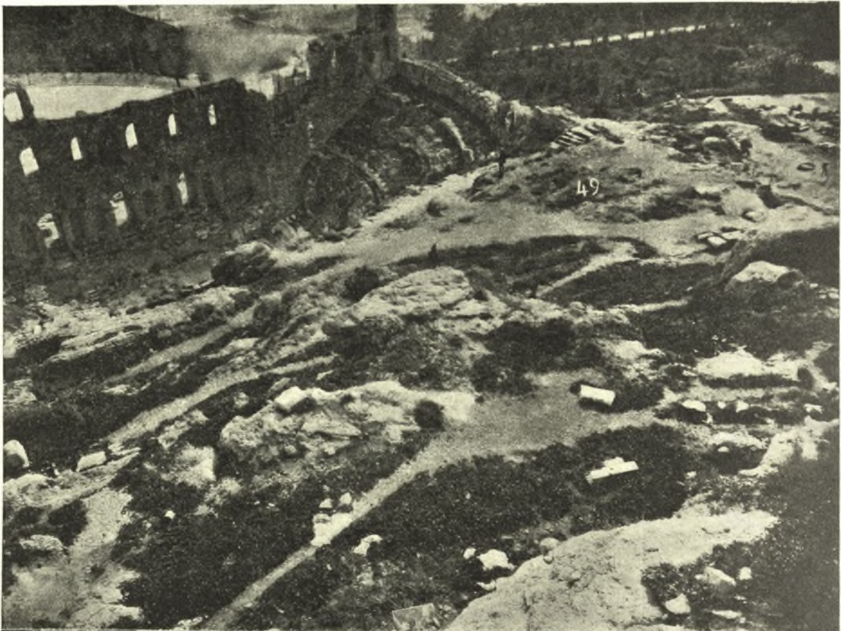
Εἰκ. 6. Εἰλημμένη ἐκ τοῦ Πύργου τῆς Νίκης καὶ δεικνύουσα τὸν ὑπὸ τὸν πύργον βραχῶδη τόπον καὶ τὸν κατωτέρω ἐπίπεδον 49 ὑπὲρ τὸ Ῥδεῖον, οὗ φαίνεται τὸ δυτικὸν μέρος ὡς καὶ τὸ δυτ. τοῦ Ῥδεῖου ἔσωθεν.

ὅμως, ἀφ' οὗ εἰς τοιοῦτον ὕψος (48) κατέληγεν ἔκτοτε ἡ ὁδός, θὰ ἦτο ἀνόητον καὶ ἀδύνατον ἄνευ κλίμακος νὰ καταχθῆ ἔντεϋθεν εἰς τὴν παλαιὰν ὑπὸ τὸν βράχον κοίτην (44 α ), ἣτις ἦτο ἐπιβεβλημένη, ἐφ' ὅσον χρόνον ἔλειπε τὸ Ῥδεῖον, ἴστατο δὲ τὸ Πελαργικὸν καὶ τὰ ἐρείπιά του, ἐπετυγχάνετο δ' ἀμαξιτός, ἀνύπαρκτος ὕστερον καὶ ἀδύνατος. Διὰ τοῦτο ἤδη ἔξω πρὸς