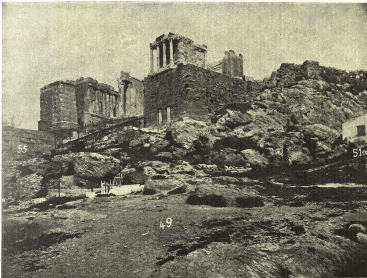
Εἰκ. 5. Δεινύνοσα ἀποριν τοῦ ὑπὲρ τὸ Ὁρδεῖον τοῦ Ἡρώδου ἐπιπέδον χώρον εἰλημμένην ἀπὸ τοῦ βορειοδυτικοῦ κρηπιδώματος τοῦ Ὁρδείου. Οἱ ἀριθμοὶ τῆς εἰκόνας εἶνε οἱ τοῦ χάρτου.

ἐνταῦθα εἶδε καὶ καλῶς ἠρμήνευσεν ὁ Κουμανούδης ἔ.ἀ. 31 (ὄρα καὶ τὸ σχέδιον τοῦ Μητσάκη), μετ' αὐτὸν δ' ὁ Βερσάκης παρέλαβεν αὐτὴν πάλιν ἔ.ἀ. πίν. 4,26. Ὁ Κουμανούδης λέγει, ὅτι αὕτη ἐχώρει «μέχρι τοῦ κατατακορύφου σημείου (τοῦ κοίλου τοῦ Ὁρδείου) καὶ ὕστερον ἐχώρει πρὸς δύσιν τόσον, ὅσον ἐχρειάζετο, ἵνα μετ' εὐμαρείας γίνῃ ἡ καμπὴ πρὸς τὴν Ἀκρόπολιν». Ἀληθῶς ἡ κλιμαῖ σχηματίζουσα ἴσως ἐν τῷ μεταξὺ εὐρυτέραν τινά που