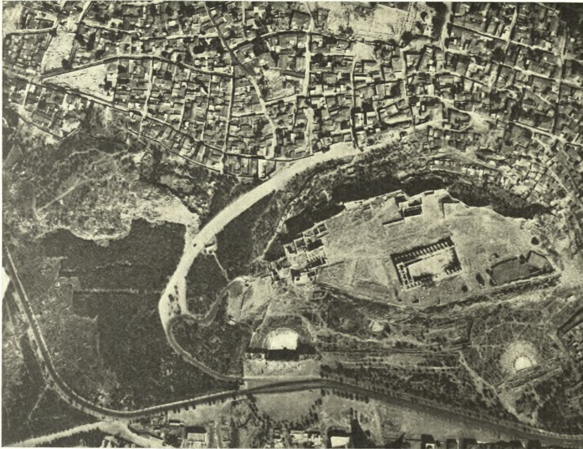
Εἰκ. 2. Βλέπουσα ἀπὸ ἀεροπλάνου τὸν Ἄρειον Πάγον μεταξὺ τῶν οἰκιῶν (ἀριστ. ἄνω) καὶ τῆς περιφερικῆς ὁδοῦ τῆς Ἀκροπόλεως. Ἐντεῦθεν τῆς ὁδοῦ τὸ ἄλσος, ἡ πλατεῖα, ἐνθα σταθμεύουσιν αἱ ἄμαξαι τῶν ἐπισκεπτῶν τῆς Ἀκροπόλεως, δεξιώτερα ἢ Ἀκρόπολις, ἐντεῦθεν (ἀριστ.) τὸ Ὀδεῖον τοῦ Ἡρώδου καὶ (δεξ.) τὸ θέατρον τοῦ Λιονύσου, ὧν μεταξὺ τὸ Ἀσκληπιεῖον, ἢ στοὰ τοῦ Εὐμένους, τὸ Πελαργικόν. Ἐκείθεν τῆς Ἀκροπόλεως (ἄνω πλευρὰ τῆς εἰκ.) τὸ λευκάζον μέρος εἶνε ἡ ῥωμαϊκὴ ἀγορὰ καὶ ὁ πύργος τοῦ ὠρολογίου τοῦ Ἀνδρονίκου τοῦ Κυρρήσιου.

Ὅτε ἐκομίσθη εἰς Ἀθήνας ἡ λατρεία τοῦ Ἀσκληπιοῦ, εἶχον μὲν φύγει οἱ πρόσφυγες,