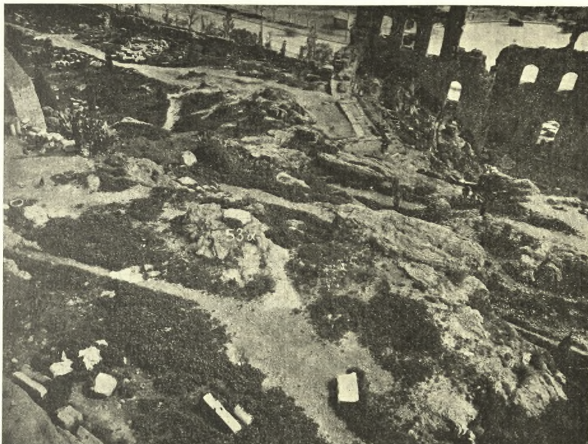
Εἰκ. 7. Λεικνύουσα τὰ ἀνατολικώτερα μέρη τῶν αὐτῶν μνημείων ὡν καὶ ἡ εἰκ. 6. Ὁ ἀριθ. 53 α λείπει ἀπὸ τῆς εἰκ 6 ἀλλ' ἡ θέσις του εἶνε ἐκεῖ διακριτὴ ἐκ τοῦ βράχου, ἐφ' οὗ τὸ μάρμαρον.

(57), ἀπέκοψε τὴν πέραν τοῦ κοίλου τοῦ Ὁδείου δευτέραν μορφήν τοῦ περιπάτου. Ἐκλιπούσης οὕτω τῆς ὁδοῦ ταύτης πρὸς τὴν εἴσοδον τῆς Ἀκροπόλεως, ἠνοίχθη ἡ ἀνάτης ὑπὲρ τὴν ἀνατολικὴν πλευρὰν τοῦ Ὁδείου διὰ μέσου τοῦ δῆθεν μνημείου τοῦ Νικίου ἀτραπὸς (50 α ), ἣν ἔχει ὁ χάρτης τοῦ Leake 1 καὶ ἤτις κατέληγεν ὡσαύτως εἰς τὴν ὑπὲρ τὸ Ὁδεῖον πλατεῖαν.