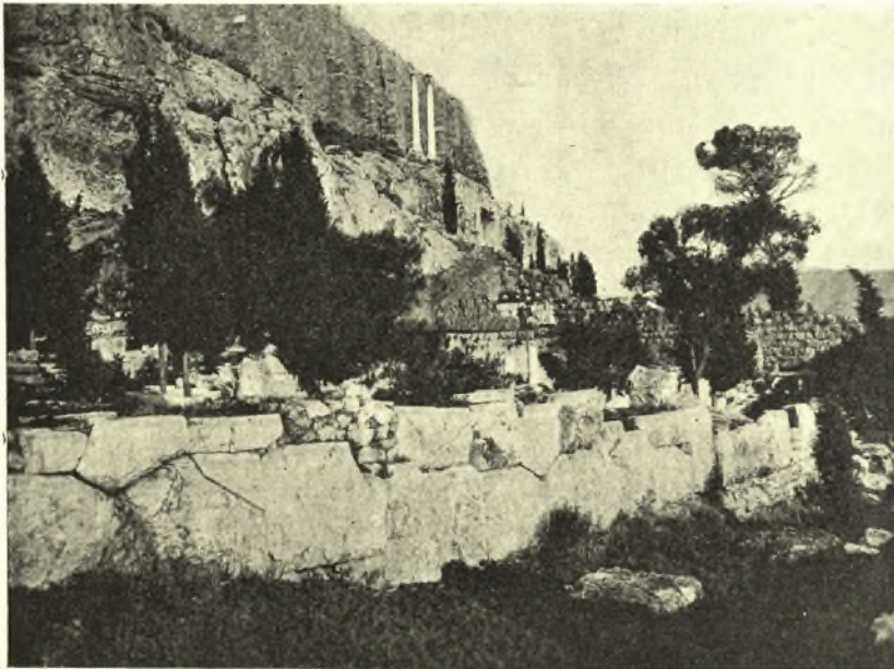
Εἰκ. 4 Δεικνύουσα ἔμπρὸς μέρος τοῦ πολυγωνικοῦ περιβόλου τοῦ Πελαργικοῦ, δεξιὰ τὰ ἀναλήμματα τοῦ Θεάτρου, ὀπισθεν τὸν βράχον τῆς Ἀκροπόλεως καὶ τὸ τεῖχος αὐτῆς ἐπάνω. Ὑπὸ τοὺς δύο κίονας τοὺς ἐπὶ τὸν βράχον εἶνε τὸ Θρασύλλειον.

δι' ἀσβέστου. Ὁ ὅλος τοῖχος δὲν ἔχει ὀριζόντιον τὴν βάσιν ἀλλὰ παράλληλον πρὸς τὴν ἠπίως ἀνηφορίζουσαν πρὸς δυσμὰς κλίσιν τῆς κλιτύος, μάλιστα δὲ φανερός εἶνε ὁ πρὸς τὸν ἀνήφορον παραλληλισμὸς τοῦ τοίχου ἐκεῖ, ἔνθα εἶνε ἡ εὐθυνηρία τῶν πύργων 1 . Ἐν τῷ τοίχῳ τούτῳ καὶ εἰς σημεῖον ἀντιστοιχοῦν πρὸς τὸν πρῶτον πυρῆνα τοῦ Ἀσκληπείου εἶνε ἐνεκτισμένος ὁ «ἰόρος κρένες» (33), χρήσιμος μόνον πρὸ τῆς εἰσαγωγῆς τῆς λατρείας τοῦ Ἀσκληπιοῦ καὶ ἀναγνωστὸς ἔξωθεν τοῦ τοίχου ἦτοι ἐκ τοῦ πεντασταδίου «περιπάτου» τῆς Ἀκροπό-