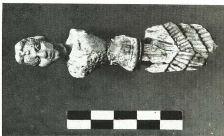
α. Ειδώλιον ἐξ ἐλεφαντοστού (Μυζηνών; ).