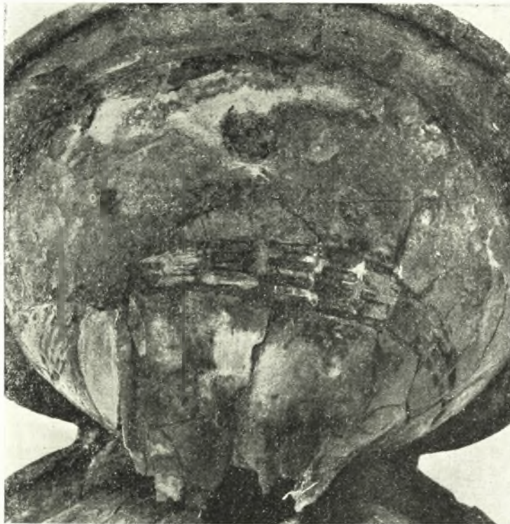
Εἰκ. 1. Ὁ ἄνω λοβὸς τῆς ἀσπίδος διακρίνεται κηλὶς κυκλικὴ ἐκ τῆς ὀξειδώσεως χαλκοῦ κοσμήματος.

Ἡ ὀπισθία ὄψις, ἐπίπεδος, ὡς ἤδη ἐλέχθη, φέρει εἰς τὸν ἄνω λοβὸν αὐτῆς τοξωτὴν κινήτην λαβὴν ἐξαρτωμένην ἀπὸ δύο κρίκων, ἧς τὰ ἄκρα ἔχουν μορφήν κυλίνδρου διακοσμουμένου διὰ παραλλήλων ἐγχαράκτων γραμμῶν, καθέτων πρὸς τὸν ἄξονα τοῦ κυλίνδρου. Ἐκάτερος δὲ τῶν κρίκων σχηματίζεται ἐκ σύρματος, κυλινδρικοῦ ἐπίσης, ἀποτελοῦντος τὴν ἀπόληξιν