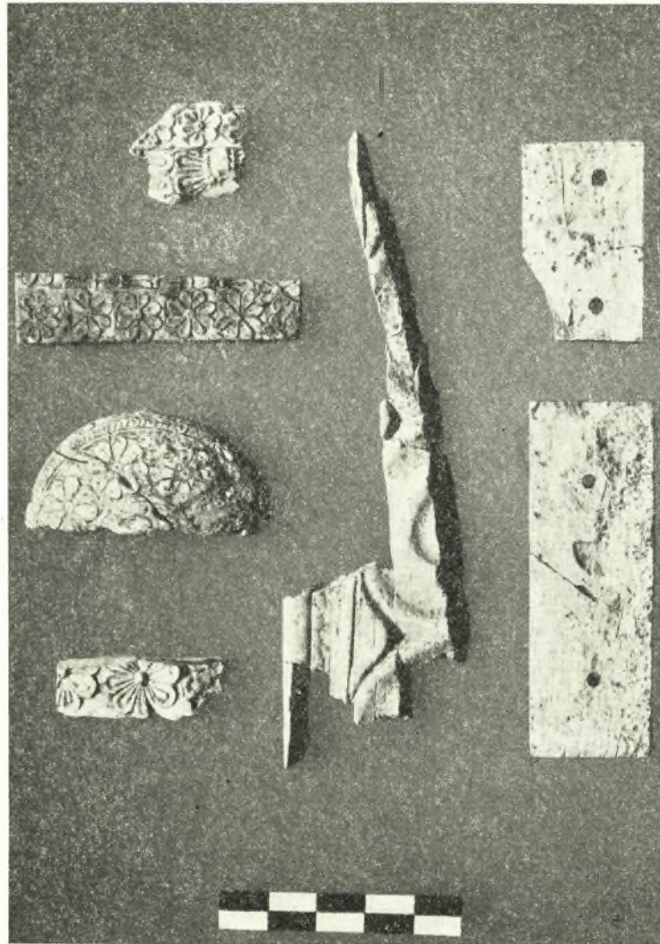
Εἰκ. 2. Τμήματα ἐλεφαντίνων ἀντικειμένων μετ' ἀναγλύφου διακοσμῆσεως.

λίστα δὲ κεφαλὴ καὶ τμήματα τοῦ σώματος γυναικείου εἰδώλιου, ἅτινα ἐν συνεχείᾳ συνεκολλήθησαν ὑπὸ τοῦ ἀρχιτεχνίτου τοῦ μουσείου Χατζηλιού (πίν. Β, α). Ἐντὸς τοῦ δίσκου ὑπῆρχεν ἡ ἐπιγραφή: «Μυκηναῶν, ἀνασκαφαὶ Σχλίμαν», ἐν ᾧ ἀκριβεστέρα δήλωσις