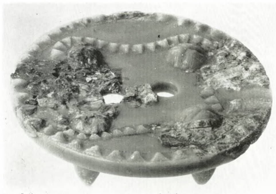
β. Ἐλεφάντινον ἀντιζείμενον ἐκ τοῦ Α τάφου τοῦ Κακοβάτου.