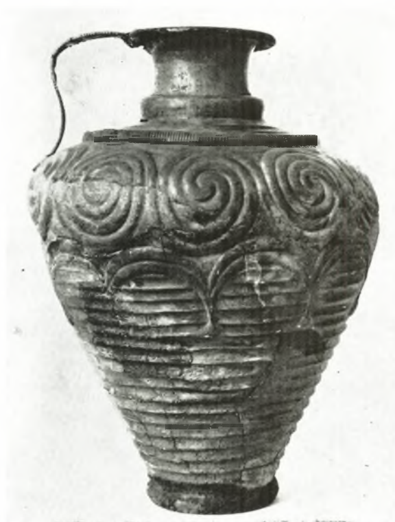
α. Ἄργυρᾶ πρόχους ἐκ τοῦ IV τάφου τῆς ἀκροπόλεως τῶν Μυκηνῶν φέρουσα ἴχνη ἐπικαλύψεως νιέλλου.