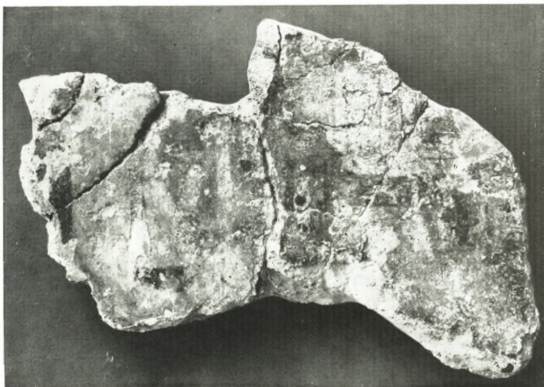
α. Τμήμα τοιχογραφίας ἐκ τοῦ μεγίστου τῶν Μυσηνῶν.