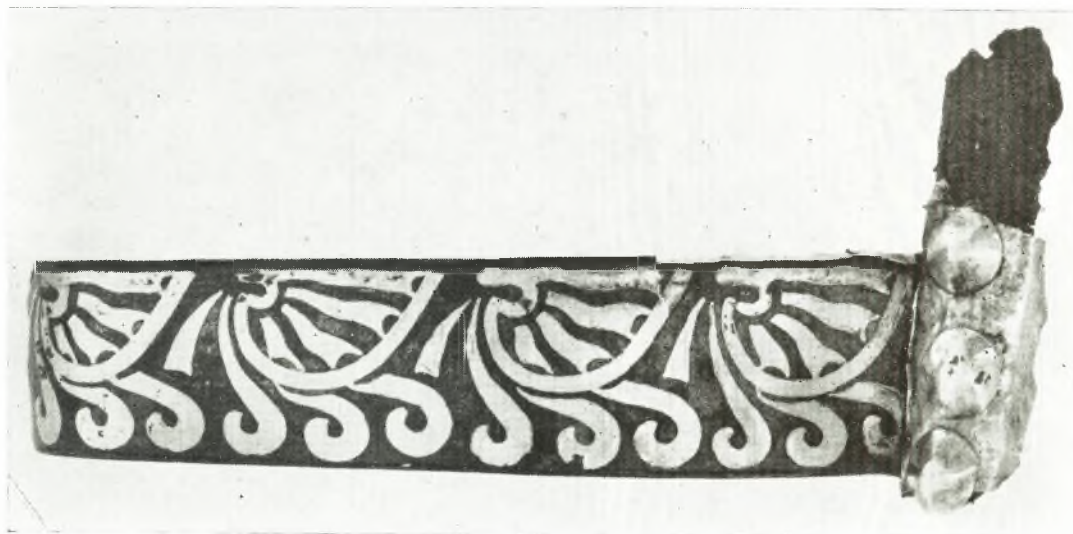
β Χαλκή λαβή μετ' ἐνθέτου γουσιῆς διακοσμήσεως (Μυζηνών).