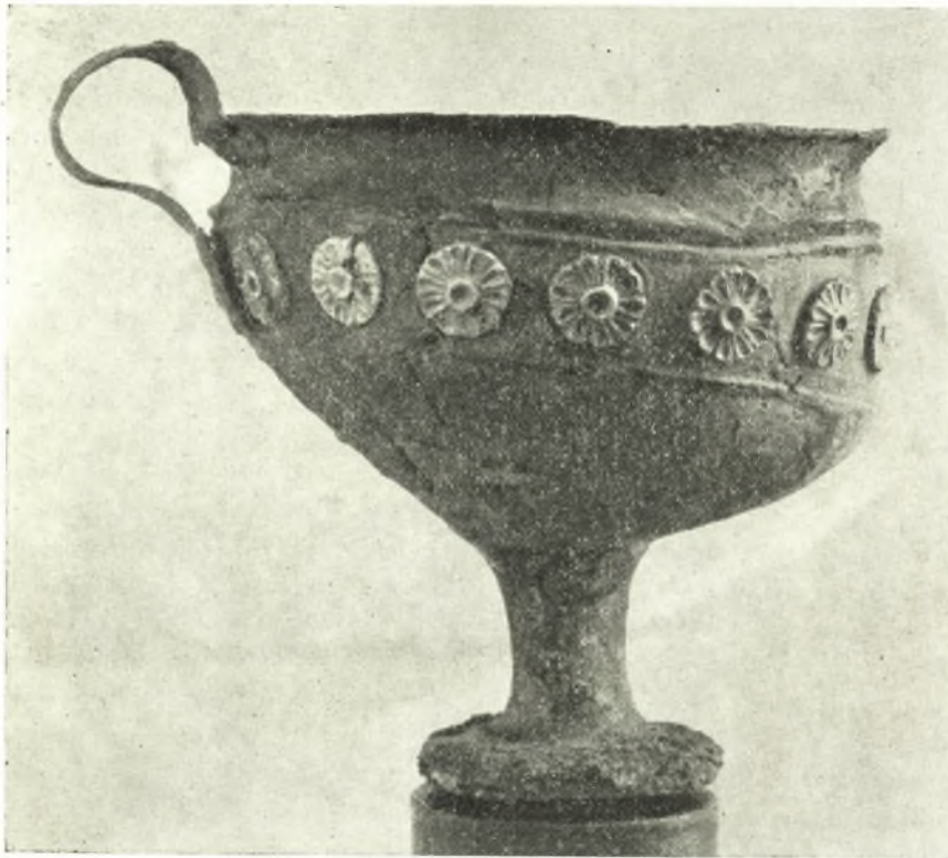
Εἰκ. 3. Ἄργυροῦν ὑψίπουν κύπελλον φέρον διακόσμησιν χρυσοῦν ροδάκων.

κοῦ καθαρισμοῦ τοῦ ἀντικειμένου ἀπεκαλύφθη διακόσμησις ἀποτελουμένη ἐκ τῆς ἐπαναλήψεως ἐνὸς θέματος ἐσχηματοποιημένου ναυτίλου ἐκ λεπτῶν ταινιωτῶν ἐλασμάτων χρυσοῦ ἐντεθειμένων ἐντὸς αὐλάκων ἀνοιχθέντων εἰς μέταλλον τῆς λαβῆς. Μετὰ τὴν ἐνθεσιν τῶν ἐλασμάτων ἡ ἐπιφάνεια ἐτρίβη διὰ τινος λεπτοῦ ἐργαλείου, οὕτω δὲ τὰ ἐξέχοντα χεῖλη τῶν αὐ-