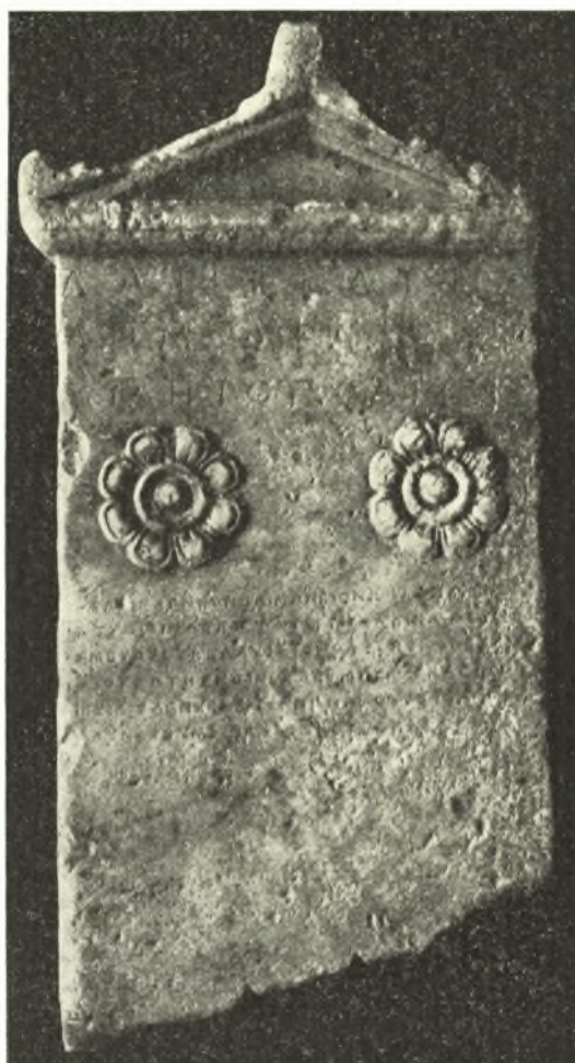
Εἰκ. 1. Ἐπιταμβία στήλη τοῦ Δαιδοκράτους.

Ἡ λήκυθος παρουσιάζει ἀρκετὰς ὁμοιότητας καὶ ἀναλογίας πρὸς τὴν ἐν Νικαίᾳ τῆς Γαλλίας καὶ ἐν τῇ Villa Guilloteau ὑπὸ τοῦ MOMMSEN ἀντιγραφεῖσαν καὶ ὑπὸ τοῦ