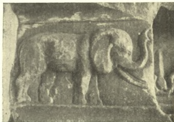
Εἰκ. 6. Ἀνάγλυφον τοῦ ἀριστεροῦ γωνιαίου βάθρου τῆς κυρίας ὄψεως.

ἐπιταφίων μνημείων τῆς ρωμαϊκῆς ἐποχῆς. Καὶ αὐταὶ εἶναι ἐνδεικτικαὶ τῶν θρησκευτικῶν δοξασιῶν περὶ ἀθανασίας καὶ συμβολίζουν τὴν πέραν τοῦ τάφου ζωὴν, κατὰ τὴν ὁποίαν ἐπιστεύετο ὅτι συνεχίζοντο αἱ ἡρωϊκαὶ πράξεις, ἀλλὰ καὶ αἱ εὐχάριστοι ἐνασχολήσεις τοῦ ἐπὶ γῆς βίου 1 . Ἔχουν λοιπὸν ληφθῆ προφανῶς αἱ παραστάσεις ἀγρίων ζώων τῶν γωνιαίων βάθρων τῆς σαρκοφάγου ἐκ τοῦ κύκλου τῶν σκηνῶν αὐτῶν 2 . Ἐν τούτοις οἱ ἐλέφαντες, οἱ ὅποιοι εἰκονίζονται ἐπὶ τῆς προσθίας ὄψεως (εἰκ. 6), εἶναι πιθανὸν ὅτι ἔχουν ἰδιαίτερον σχέσιν πρὸς τὴν διονυσιακὴν λατρείαν καὶ τὸν χαρακτήρα τῆς σαρκοφάγου, διότι ὁ ἐλέφας συνδέεται μετὰ τοῦ μύθου τοῦ Διονύσου τελέσαντος, ὡς γνωστὸν, θριαμβευτικὴν πομπὴν κατὰ τὴν ἐπαινοδὸν του ἐκ τῶν Ἰνδιῶν, συνοδεῖα ἐλεφάντων 3 . Ἀλλὰ καὶ εἰς τὴν μακροβιότητα τοῦ ἐλεφάντος ὀφείλεται ἐπίσης ἡ χρησιμοποίησίς του ὡς συμβόλου αἰωνιότητος ἐπὶ τῶν ἐπιταφίων μνημείων 4 .