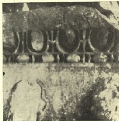
Εἰκ. 8. Κυμάτια τῆς κορωνίδος τῆς δεξιᾶς πλευρᾶς (Β).

λως πρὸς ἐκείνην τῶν ἀναλόγων κοσμημάτων τῆς ἀρχιτεκτονικῆς, ἀλλ' ἔνεκα τῆς συντηρητικότητος τῶν ἀττικῶν ἐργαστηρίων ἡ ἐξέλιξις ἐνταῦθα ἀκολουθεῖ τὸν ἰδικόν της δρόμον, αἱ μορφαὶ μεταβάλλονται βραδύτερον. Ὅθεν παραβολὴ πρὸς τὰ κοσμήματα χρονολογηθέντων οἰκοδομημάτων τοῦ 2 ου μ.Χ. αἰῶνος δὲν δύναται νὰ καταλήξῃ εἰς σαφῆ συμπεράσματα 4 .