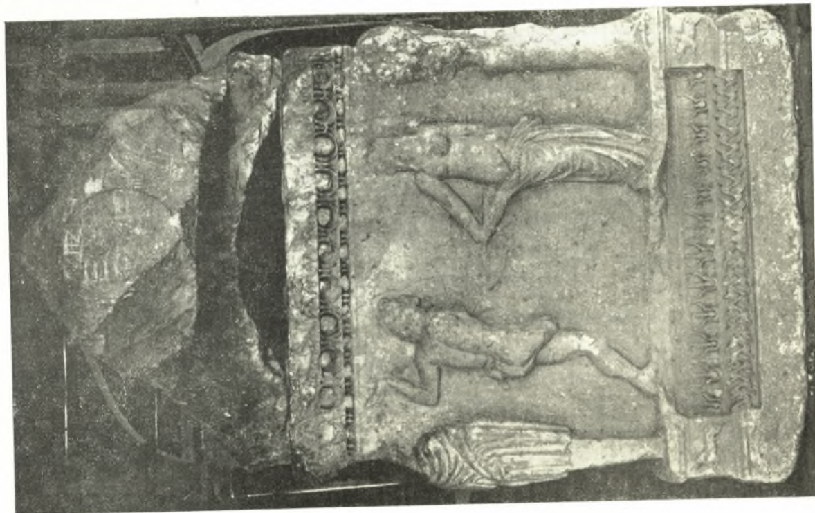
1. Δεξιὰ πλευρά (Β) τῆς σαρκοφάγου τοῦ Μουσείου Ἰωαννίνων.