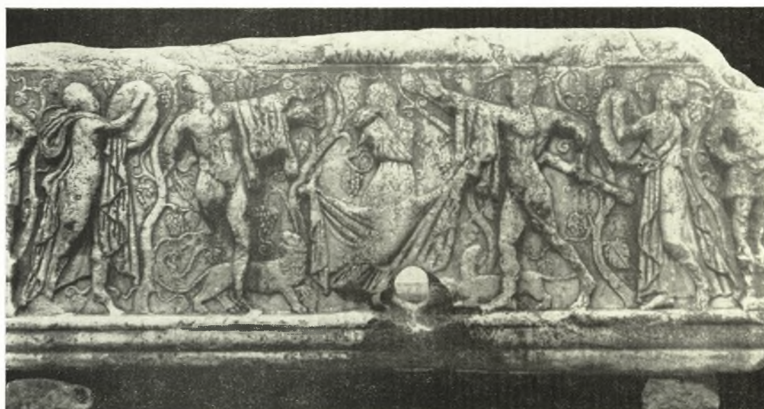
2. Κυρία ὄψις τῆς σαρκοφάγου τοῦ Μυστρά.