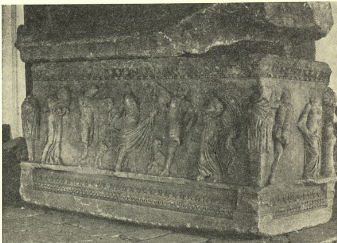
Εἰκ. 1. Κυρία ὄψις (Α) τῆς σαρκοφάγου τοῦ Μουσείου Ἰωαννίνων.

τοῦ στήθους ἀριστερὰν χεῖρα στάχυς, εἰς τὴν ἐλαφρῶς καμπτομένην πρὸς τὰ κάτω δεξιὰν δρέπανον, τοῦ ὁποῖου ἡ αἰχμὴ ἐφάπτεται τοῦ δεξιοῦ ὤμου. Ἡ τῆς ἀριστερᾶς γωνίας κρατεῖ εἰς τὴν ἀριστερὰν χεῖρα, φερομένην πρὸ τοῦ στήθους, βότρυον σταφυλῆς. Τὰς ἀντιστοίχους γωνίας τῆς ὀπισθίας ὄψεως κοσμοῦν δένδρα συκῆς μὲ πυκνὸν φύλλωμα καὶ καρπούς. Τὰ δένδρα καταλαμβάνουν καὶ μέρος τῶν στενῶν πλευρῶν, εὐρίσκονται δηλ. τοποθετημένα διαγωνίως. Ἡ παρατήρησις αὕτη ἔχει σημασίαν, διότι ἀπο-