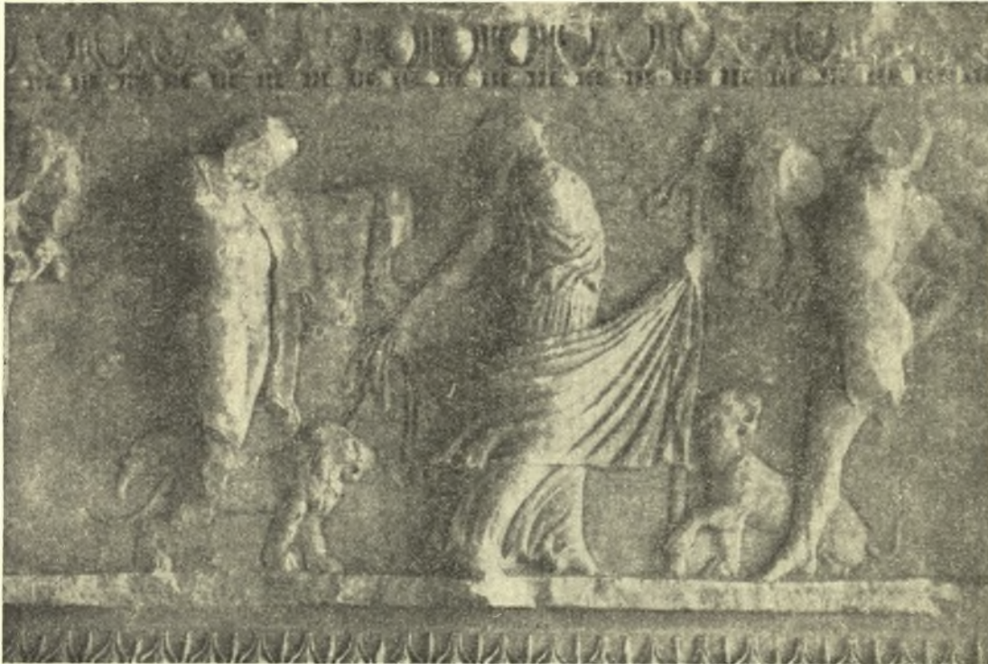
Εἰκ. 2. Ἡ μαινὰς α, οἱ σάτυροι β (ἀριστερά) καὶ γ (δεξιᾶ) τῆς κυρίας ὄψεως τῆς σαρκοφάγου.

τῆς πλευρᾶς Α ἀνὰ εἰς ἐλέφας ἐστραμμένοις πρὸς τὸ κέντρον 1 . Ἐπὶ τῆς πλευρᾶς Γ, δεξιᾶ, κύων θηρευτικὸς τρέχων πρὸς ἀριστερά, εἰς τὸ ἀριστερὸν βᾶθρον λαγὼς πρὸς ἀριστερά. Ἐπὶ τῆς πλευρᾶς Β, δεξιᾶ, ἄγριον ζῷον δυσδιάγνωστον πρὸς ἀριστερά (λύκος ἢ λύγξ;), ἐπὶ τοῦ ἐτέρου βᾶθρου δορκὰς πρὸς ἀριστερά, στρέφουσα ὀπίσω τὴν κεφαλὴν. Ἐπὶ τῆς ὀπισθίας ὄψεως, ἀνὰ μία λεοπάρδαλις (;) ἀντιμέτωπος τῆς ἐτέρας. Ἡ βᾶσις τῆς σαρκοφάγου ἐπὶ τῶν τριῶν πλευρῶν, Α, Β καὶ Γ, φέρει κόσμημα ἐπιμε-