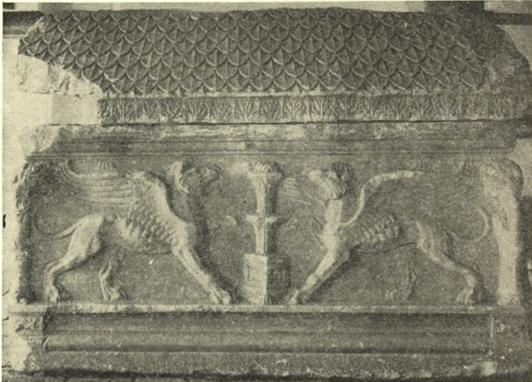
Εἰκ. 5. Ὅπισθία πλευρά (Δ) τῆς σαρκοφάγου.

Ἐπὶ τῆς ὀπισθίας πλευρᾶς Δ (εἰκ. 5) δύο γρῦπες ἀντιποιοὶ ἐκατέρωθεν φλογοφόρου θυμιατηρίου, ὑψοῦντες τὸ πρόσθιον σκέλος ἀντιστοίχως, τὸ ἀριστερὸν καὶ τὸ δεξιόν. Ἔχουν κεφαλὰς ἀειτῶν, ὠτα ὀρθά, ὄξυκόρυφα, τράχηλον ἀκανθωτόν. Παρὰ τὴν ἀδρο-