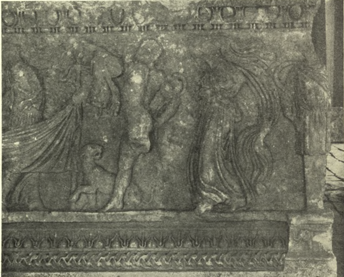
Εἰκ. 4. Ἡ μαινὰς α, ὁ σάτυρος γ καὶ ἡ μαινὰς ε τῆς κυρίας ὄψεως τῆς σαρκοφάγου.

Τοῦ τύπου τῆς ἐν τῷ κέντρῳ μαινάδος α ὑπάρχουν ἐπὶ ἀττικῶν σαρκοφάγων δύο παραλλαγαί: 1) ἐπὶ ἀπομήματος ἐν Paestrina 1 2) ἐν Μυστρᾷ (Μητροπόλις) 2 . Εἰς τὸ ἐν Paestrina ἀπότμημα ὁ τύπος εἶναι ἀπολύτως ὁμοιος ἀλλὰ κατ' ἀντίστροφον κατεύ-