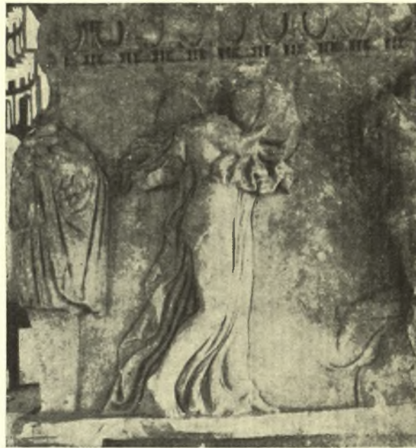
Εἰκ. 3. Ἡ μαινὰς δ τῆς κυρίας ὄψεως τῆς σαρκοφάγου.

Αἱ εἰς τὰ ἄκρα εἰκονιζόμεναι μαινάδες ἀποτελοῦν ὡσαύτως μικρὰς παραλλαγὰς τῶν πλέον συνήθων τύπων τῶν νεοαττικῶν ἀναγλύφων. Ἀριστερά, τυμπανίστρια (δ), κατὰ δεξιὸν κρότιαφον, προβάλλουσα τὸν ἀριστερὸν πόδα ἐφ' οὗ στηρίζεται, φέρουσα ἑλαφρῶς πρὸς τὰ ὀπίσω τὴν δεξιὰν κνήμην καὶ μόνον διὰ τῶν δακτύλων τοῦ ποδὸς ἐγγί- ζουσα τὸ ἔδαφος. Κλίνει τὴν κεφαλὴν πρὸς τὰ ὀπίσω ἐν ἐκστάσει, κρατοῦσα τύμπανον πρὸ τοῦ στήθους δι' ἀμφοτέρων τῶν χειρῶν, τῶν ὁποίων ἡ ἀριστερὰ καλύ- πτεται ὑπὸ τῶν πτυχῶν τῆς παρυφῆς τοῦ χιτῶνός της. Ὁ σχιστὸς ἄζωστος χιτῶν κατέρχεται ὀπὸ τοῦ ἀριστεροῦ ὤμου καὶ πτυχοῦται πρὸς τὰ ὀπίσω ὡς ὑπὸ πνοῆς ἀνέμου, καταπίπτει δὲ ἐκατέρωθεν τοῦ κορμοῦ καταλείπων γυμνὸν τὸ πρὸς τὸν θεατὴν δεξιὸν μέ- ρος αὐτοῦ, ὡς καὶ τὸν ἀντίστοιχον μη- ρὸν καὶ τὴν κνήμην. Βαθεῖαι πτυχὰὶ ἀκολουθοῦν τὸ περίγραμμα τῆς μορ- φῆς μέχρι τοῦ ἔδαφους. Δὲν εἶναι εὐ- κρινὲς ἂν αἱ πρὸ τοῦ στήθους καὶ ὀπι- σθεν τῆς ράχως πτυχώσεις νοοῦνται ὡς ἀνήκουσαι εἰς ἰδιαιτέρον μικρὸν ἱμάτιον, τὸ ὁποῖον καλύπτει μόνον τὸν ὤμον (εἰκ. 3).