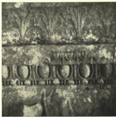
Εἰκ. 7. Κυμάτια τῆς κορωνίδος τῆς ἀριστερᾶς πλευρᾶς (Γ).

ή σαρκοφάγος Ἴππολύτου τοῦ Μουσείου Κωνσταντινουπόλεως, εἰς τὴν ἰδίαν περίπου ἐποχὴν 1 , τὸ τμήμα Ἀμαζονομαχίας τοῦ ἰδίου Μουσείου μετὰ τῆς σαρκοφάγου τῶν Δελφῶν περὶ τὸ 180-190 μ.Χ. 2 , τέλος ἡ σαρκοφάγος τοῦ Μουσείου τῆς Θεσσαλονίκης τοποθετεῖται ὀρθῶς ὑπὸ τοῦ R. REDLICH εἰς τὴν καμπὴν τοῦ 2 ου πρὸς τὸν 3 ον μ.Χ. αἰῶνα 3 . Αἱ σαρκοφάγοι λοιπόν, αἱ ὅποια διακρίνονται διὰ τῆς νέας τεχνοτροπίας τοῦ κοσμήματος τῆς κορωνίδος, χρονολογοῦνται ἀπὸ τοῦ 150 μ.Χ. καὶ ἔξῃς. Ἡ νέα μορφή τοῦ ἰωνικοῦ κύματιοῦ σημειώνει καμπὴν πρὸς νέαν φάσιν εἰς τὴν ἐξέλιξιν τῆς διακοσμήσεως τῶν ἀττικῶν σαρκοφάγων. Εἶναι ἀνάγκη νὰ σημειωθῇ ὅτι ἡ τεχνοτροπικὴ ἐξέλιξις τῶν τεκτονικῶν κοσμημάτων εἰς τὰς σαρκοφάγους βαίνει μὲν παραλλή-