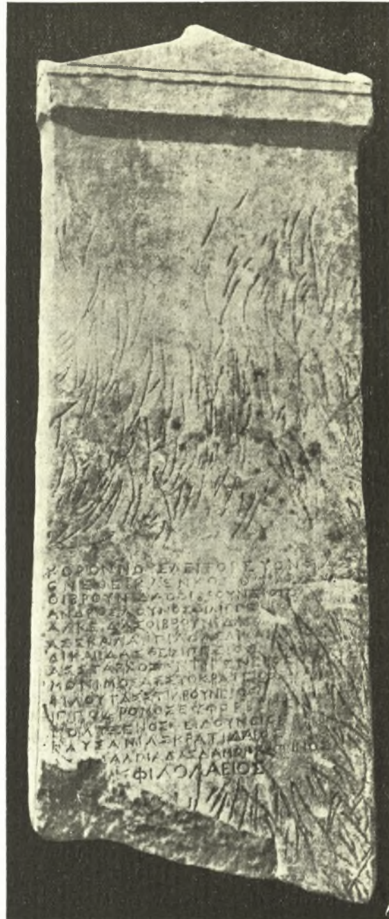
Εἰκ. 1. Ἀναθηματικὴ ἐπιγραφή ἐξ Ἄτραγος.

ὁμως δὲν ἐγένοντο βλάβαι εἰς τὴν ἐνεπίγραφον ἐπιφάνειαν. Ἡ στήλη ἐκομίσθη εἰς τὸ Μουσεῖον Λαρίσης.