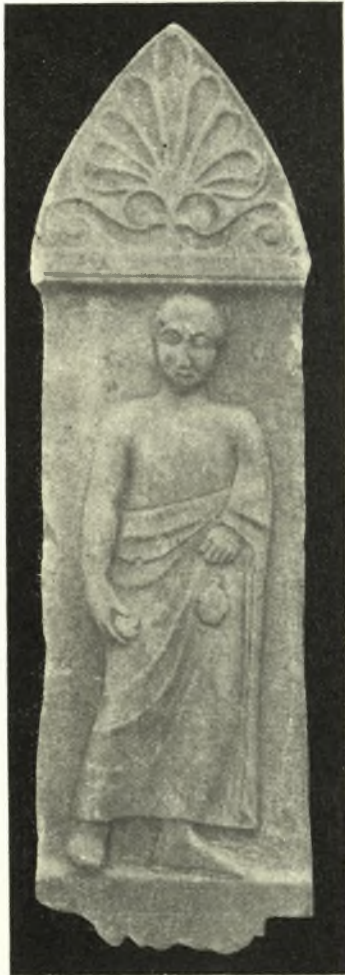
Εἰκ. 4. Ἐπιτύμβιον ἀναγλύφον κόρης ἐκ Λαρίσης.

9. Στήλη μετ' άνθεμίου λευκοῦ μαρμάρου ανεπίγραφος, φέρουσα ἐν ἀναγλύφῳ κόρην ἰσταμένην ὀρθίαν κατ' ἐνώπιον, περιβεβλημένην ἱμάτιον ἀπὸ τοῦ στήθους καὶ κάτω, δι' οὗ καλύπτει τὸν ἀριστερὸν βραχίονα ἄνω τοῦ ἀγκῶνος καὶ μέχρι τοῦ καρποῦ τῆς χειρὸς καὶ ἀφίνουσα γυμνὸν τὸ ἄνω μέρος τοῦ σώματος κάτωθι τῶν μαστῶν καὶ ἄνω καὶ τὴν δεξιὰν χεῖρα φυσικῶς κρεμαμένην, δι' ἧς