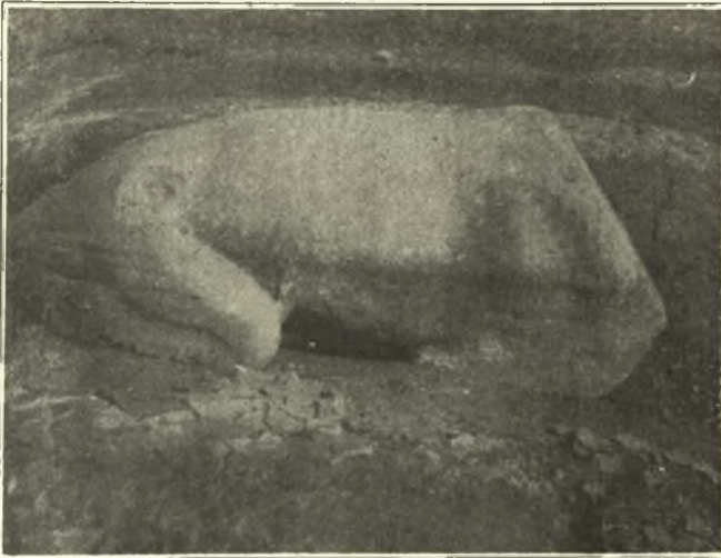
Εἰκ. 3. Ὁ λέων τοῦ θεσπικοῦ πολυανδρίου ἀπὸ Ν ὁρώμενος. Μεταξὺ τοῦ ὀπισθοῦ δεξιοῦ σκέλους προσκολλᾶται ἀνερχομένη ἐπὶ τῆς κοιλίας ἡ ἄκρα οὐρά.

νυτο ἀποτόμως καὶ ἐντελῶς ἀλλ' ἐγώννυτο, ἀποδεικνύεται, νομίζω, ἐκ τῶν παχέων ἀπηθρακωμένων ξύλων, ἅτινα ἀνευρέθησαν, μαρτυροῦσι δ' ὅτι κατεχώσθησαν καιόμενα ἀκόμη, καθ' ὃν τρόπον καταχώννυνται καὶ νῦν αἱ πυραὶ πρὸς πορισμὸν ἀνθράκων. — Ἐπὶ τῶν οὕτω κεκαυμένων νεκρῶν ἐχύθησαν τὰ ἐρυθρωτὰ χρώματα, ὧν οἱ λίθοι κα-