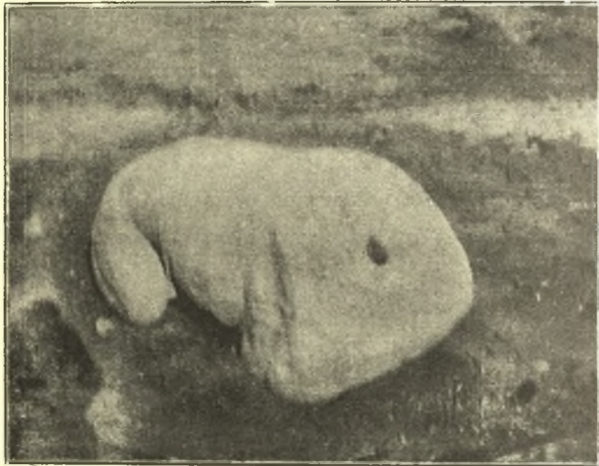
Εἰκ. 2. Ὁ ἀκέφαλος νῦν λέων τοῦ θεσπικοῦ πολυανδρίου ἀπὸ ΝΑ δρόμου. Ἐν τῇ τομῇ τοῦ λαμοῦ ὅπῃ τόρμου πρὸς ἐνοφῆνωσίν ποτε τῆς κεφαλῆς. Πρὸς τὰ ἄνω χυτική ἀδλαξ διὰ τὴν ἔγχυσι μολύβδου.

ἐσχημάτισαν ἐπίπεδον πυρᾶς, ἐφ' οὗ ἔκαυσαν τοὺς πολλοὺς νεκρούς, εὐλαβούμενοι νὰ προσεγγίσωσι πρὸς τὸν χώρον τῶν ἀκαύστων. Μετὰ τῶν νεκρῶν συνεκάησαν καὶ τὰ κτερίσματα· ἀλλ' ἐν ᾧ τὰ ὀστᾶ τῶν νεκρῶν εἶνε σφόδρα κεκαυμένα, ἀστράγαλοι τινες εἶνε ἡμίκαυστοι. Ἐπειδὴ δὲ καὶ ἀγγεῖά τινα, περιέχοντα ψά, ἐδείχθησαν ὡς μὴ