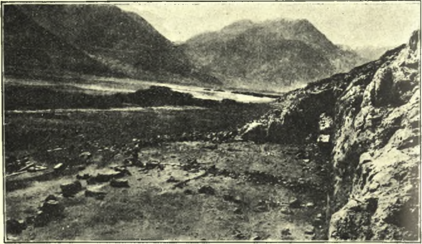
Εἰκ. 1. Ἀποψὶς τῆς κατατομῆς ἀπ' ἀνατολῶν. Εἰς τὸ βάθος ἡ λίμνη καὶ ὑπεράνω ἀριστερᾷ μὲν τὸ ὄρος Ἀπέλαυρον, δεξιᾷ δὲ ἡ Ὀλίγυρτος.

λυψα εὐθύς ἀπὸ τῆς πρώτης ἡμέρας τὰ θεμέλια ναοῦ τετραστύλου προστύλου μήκους 16,40 καὶ πλάτους 7.60 (εἰκ. 2 καὶ 3) 1) . Ὅτι ὁ ναὸς ἦτο τετράστυλος ἀποδεικνύεται ἐκ τοῦ γεγονότος, ὅτι ὁ στυλοβάτης τῆς προσόψεως