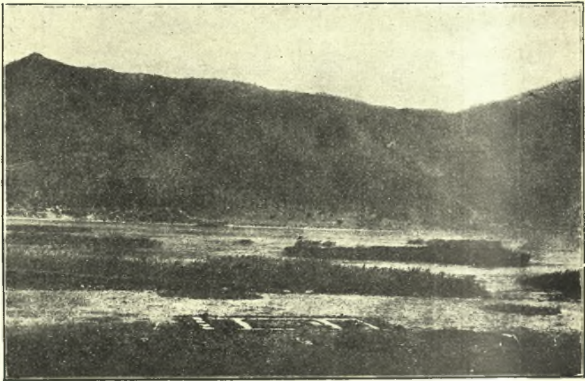
Εἰκ. 3. Ὁ ἀποκαλυφθεὶς πρόστυλος ναός. Εἰς τὸ βάθος τὸ ὄρος Ἀπέλαυρον.

Ἀκόμη δυτικώτερον ἐκαθαρίσθη ἡ πρὸ τῆς πλατείας τετράκρονος κρήνη, ἣς ἀπεκαλύφθη καὶ ἡ κλιμαξ, ἡ κατάγουσα ἀπὸ τῆς πλατείας εἰς τὸ ἐπίπεδον τῆς ὑδροληψίας.