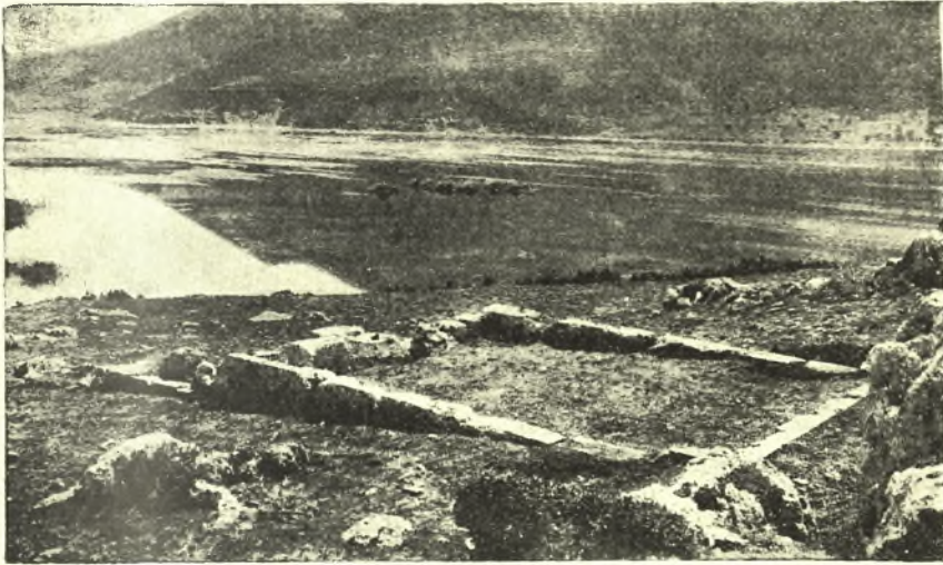
Εἰκ. 4. Ἐπιπέδου τοῦ ἐπὶ τῆς ἀκροπόλεως ναύτου ἀπὸ ΒΔ.

χώδους γλώσσης, ἣτις ἀποτελεῖ τὸ ΒΔ ὄριον τῆς λίμνης, ἅμα δὲ καὶ τὴν ἀκρόπολιν τῆς ἀρχαίας Στυμφάλου.