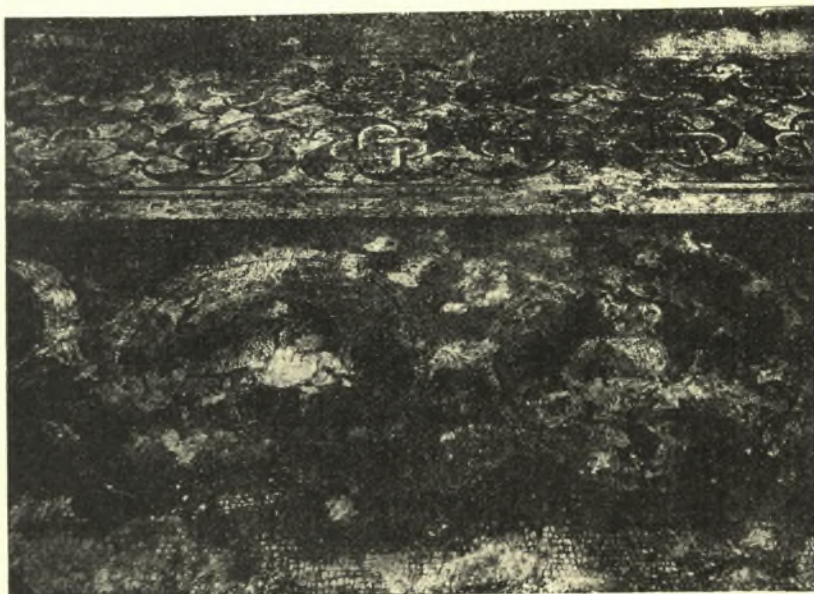
Εἰκ. 4. Ψηφιδωτὸν περιστελίου τοῦ «Βασιλόσπιτου» ἐναντι τῆς Βασιλικῆς Δομητίου. Κεφαλῆαι ἀνδρῶν καὶ καὶ διάφορα ἄλλα ποιήλια κοσμήματα