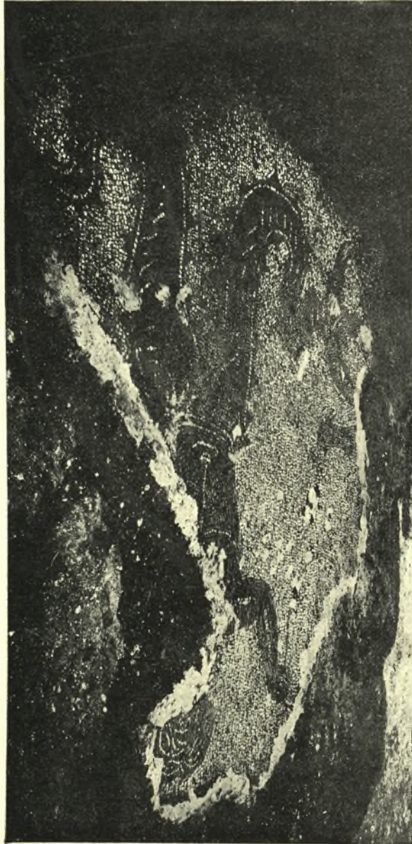
Εἰκ. 2. Ψηφιδωτὸν παριστῶν Ταίωνα , ἀποκαλυφθὲν ἐν τῷ περιστύλιῳ τοῦ πρωτοχριστιανικοῦ ἱδρύματος τοῦ γνωστοῦ σήμερον ὑπὸ τὸ ὄνομα «Βασιλόσπιτο».