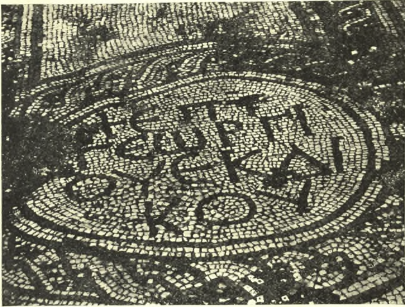
Εἰκ. 3. Ψηφιδωτὸν τοῦ προτογοριστιανικοῦ ἱδρύματος, «Βασί- λούσιτος». Ἐν κύκλῳ ἡ ἐπιγραφή: + Ἐπὶ Γεωργίου Ἐκδίκου.