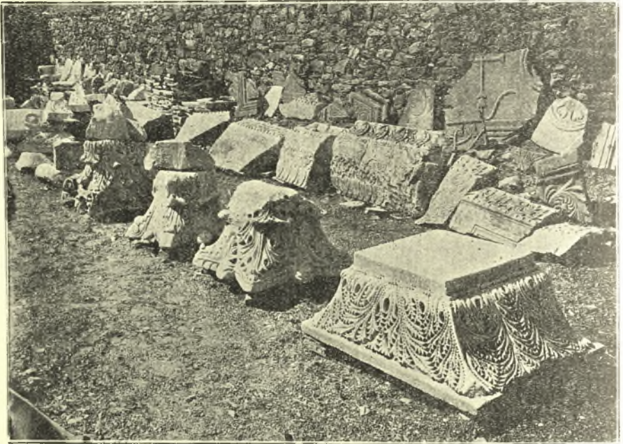
Εἰκ. 2. ἀνευρεθέντα ἀρχιτεκτονικὰ μέλη τῆς ἀνασκαπτομένης χριστιανικῆς Βασιλικῆς Ν. Ἀγχιάλου.

Περὶ τῆς μεσαιωνικῆς ταύτης πόλεως, τῆς κειμένης ἐπὶ τῆς ἀνατολικῆς κλιτύος λόφου συνεχομένου πρὸς σειρὰν λόφων χωρίζουσαν τὴν Φθιώτιδα τῶν Φερρῶν, ἐλαχίστας ἔχομεν ἐκ φιλολογικῶν πηγῶν πληροφορίας.