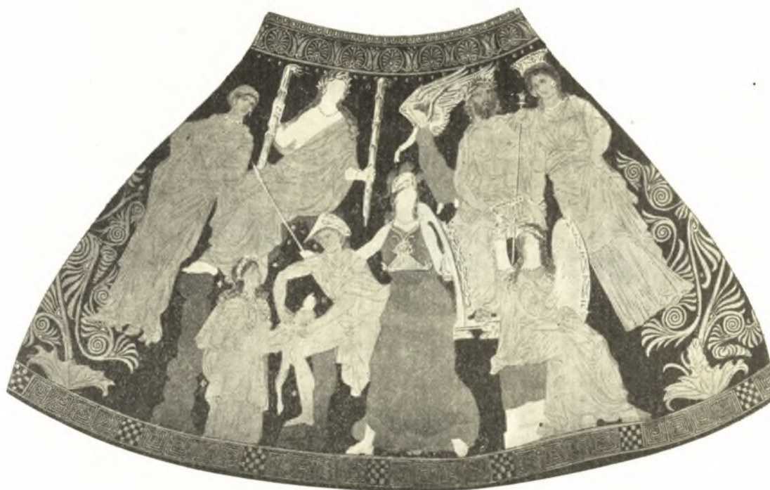
Εἰκ. 20. Πελίκη ἐκ Παντικαπαίου. Ermitage. *Θῆσις Β.

ιερῶν τῆς Δήμητρος ἀπὸ τῆς Ἐλευσίνας εἰς τὰς Ἀθήνας 1 . Ὁ NILSSON παρατηρεῖ ὅτι οὔτε ἡ γέννησις τοῦ Ἐριχθονίου οὔτε ἡ γέννησις τοῦ Διονύσου ἀνήκει εἰς τὸν Ἐλευσινιακὸν κύκλον 2 . Ὁ METZGER βεβαίως πιστεύει ὅτι πρόκειται περὶ τῆς γεννήσεως τοῦ Διονύσου. Καὶ ἐὰν πρὸς στιγμὴν συμφωνήσωμεν πρὸς αὐτὸν ὡς πρὸς τὸ θέμα, θὰ διαφωνήσωμεν πλήρως πρὸς τὴν ὑπόθεσίν του ὅτι ἡ παράστασις ἔχει χαρα-