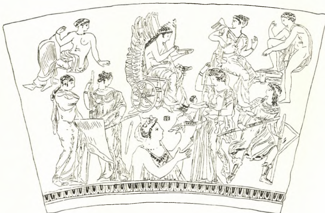
Εἰκ. 21. Ὑδρία ἐκ Ρόδου.

pénétration des éléments dionysiaques dans la tradition éléusinienne, pénétration qui daterait de la seconde moitié du IV e siècle». Ἐνίοτε τὸ θέμα τῶν δύο ὄψεων ἀγγείων σχετίζεται, αὐτὸ ὅμως δὲν ἀποδεικνύει ὅτι ἐπειδὴ εἰς τὴν ὄψιν Α ἔχομεν τὴν πρόσοδον πρὸς μύησιν τοῦ Ἡρακλέους πρέπει τὸ θέμα τῆς ὄψεως Β, ὡς ἐπακόλουθον, νὰ ἔχη Ἑλευσινιακὸν χαρακτήρα. Πῶς εἶναι δυνατόν νὰ ὑποθέσωμεν ὅτι ἡ ὄψις Β ἀνήκει εἰς τὸν Ἑλευσινιακὸν κύκλον ἢ ἔχει χροιάν ἔτι Ἑλευσινιακὴν, ἀφ' οὗ καὶ κατὰ τὴν ἀντίληψιν τοῦ METZGER ἀπὸ τὴν παράστασιν τῆς ἐλλείπει ἡ Δημήτηρ, ἡ κυρία θεὰ τῶν Ἑλευσινίων; Ἐὰν δέ, ὡς πιστεύω, ἡ δαδουχοῦσα δὲν εἶναι ἡ Κόρη, διότι Κόρη καθιμένη ἄνευ τῆς Δήμητρος εἰς ἐπὶ τῆς γῆς σκηνὴν εἶναι ἀδύνατος, ἀλλ' ἡ Ἐκάτη,