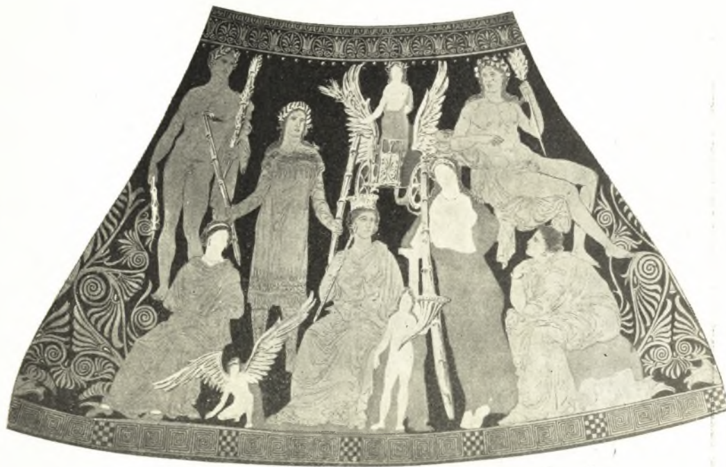
Εἰκ. 10. Περίκη ἐκ Παντικαπαίου. Ermitage. Ὅψις Α.

ναίοι και οί Ἐλευσίνιοι εἶχον ἀποφασίσει πρὸ τῶν μέσων τοῦ αἰῶνος ἐκείνου 1 , ἦτο γνωστὴ εἰς πάντας και βεβαίως μεθ' ὑπερηφανείας θὰ ἠδύνατο νὰ γραφῆ ὡς ὀρίζουσα τὸ ἱερὸν τῆς Ἐλευσίνας. 3) Ὁ κενὸς πρὸ τῆς καθημένης Δήμητρος «θρόνος», ὁ ἐπαναλαμβάνων τὴν αὐτὴν διάταξιν τὴν συναντωμένην εἰς τὴν παράστασιν Α τοῦ πίνακος τῆς Νιωνίου. Ὡς εἶδομεν ἐκεῖ, εἶναι ὁ «θρόνος» τῆς Περσεφόνης και πρὸς αὐτὸν βαίνει ἡ κόρη τῆς παραστάσεως τοῦ κρατῆρος κρατοῦσα δᾶδα 2 . Ἡ Δημήτηρ δὲν τὴν ἔχει ἀντιληφθῆ ἀκόμη και προσέχει εἰς τὰ ὑπὸ τοῦ Τριπτολέμου λεγόμενα. Κατὰ ταῦτα πιστεύω ὅτι εἰς τὸν κρατῆρα εἰκονίζεται ἡ προσέλευσις τῶν ἡρώων πρὸς μύησιν, ἔχομεν δηλαδὴ εἰς αὐτὸν παράλληλον παράστασιν τῆς ἐπὶ τῆς κάτω ζώνης