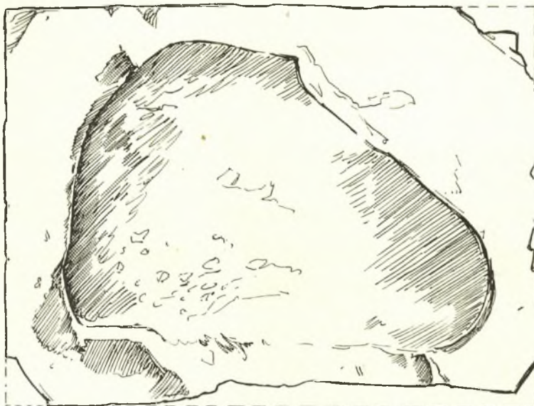
Εἰκ. 2α. Ὁ παλαιότερος τόρμος (Σχ. Ἀ. Κοντοπούλου).

Πρώτη χρῆσις του ἔγινε περὶ τὰ μέσα (;) τοῦ 3 ου π.Χ. αἰῶνος (τόρμος εἰκόνας 2α), ὅτε, φαίνεται, ἐποιήθη τὸ βάθρον καὶ ἐχαράχθησαν ἐπὶ τούτου αἱ ὑπ' ἀριθ. 1 καὶ 2