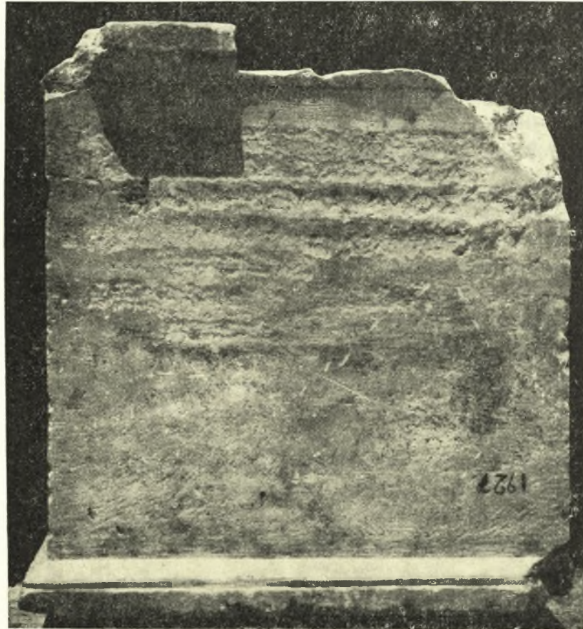
Εἰκ. 1. Ὁ ὑπ' ἀριθ. 1927 ἐνεπίγραφος λίθος τοῦ Ε. Μ.

Ε. Μ. 1927 2 . Τετραγωνικὸν βάθρον φαιοῦ μαρμάρου μετὰ γείσου ἄνω, κάτω καὶ κατὰ τὰς πλευράς (εἰκ. 1). Ἡ ὀπισθία πλευρά του, ὡς μὴ ὀρωμένη, δὲν ἔχει τύχει ἐπεξεργασίας, διατηρεῖ ὁμως τὸ διὰ τὸ γείσον ἕξεργον. Ὑψ. 0.67, πλάτ. 0.61, πάχ. 0.43.