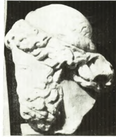
β. Ἀπότμημα σαροφάγου Κερκύρας.