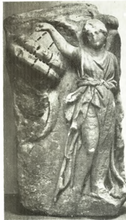
δ. Ἀπότμημα σαροφάγου Κερκύρας.