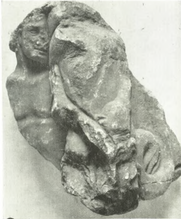
γ. Ἀπότμημα σαροφάγου Κερκύρας.