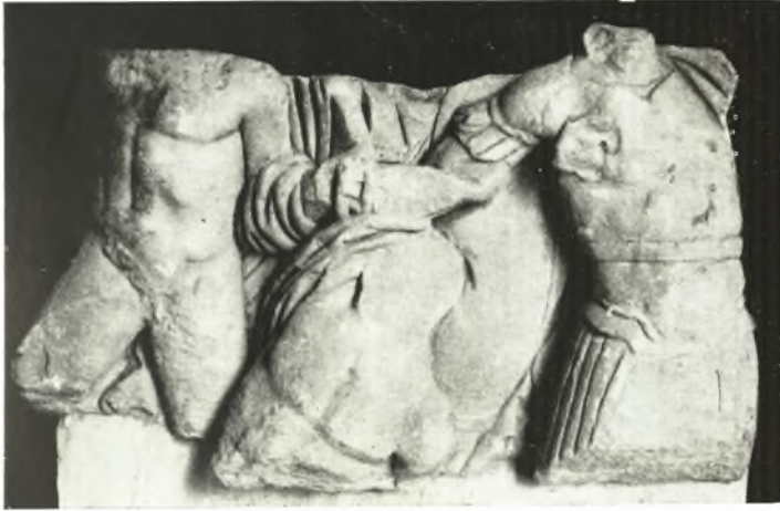
α. Ἀπότμημα σαροφάγου Κερκύρας.