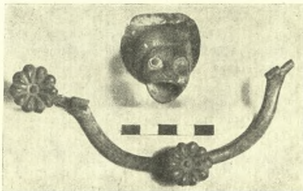
Εἰκ. 7. Χαλκῆ προχοή καὶ λαβὴ ἐκ τοῦ δωματίου β τῆς ἀρχαϊκῆς οἰκίας Α Ὀνουθῆ Γουλεδιανῶν.

της, κατὰ μῆκος τῆς ἐκεῖθεν παρερχομένης ὁδοῦ, ἀνεσκάφη εἰς μῆκος ὄχι μικρότερον τῶν πεντήκοντα μέτρων, ἔσωτερικῶς δὲ ἀνευρέθησαν δύο σει-