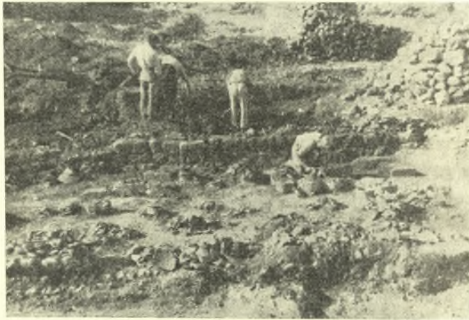
Εἰκ. 5. Τὸ δωματίον β τῆς ἀρχαϊκῆς οἰκίας Α Ὀλυθῆ Γουλιδιανῶν.

τὸ κάτω μέρος τῶν τοίχων τῆς καὶ τὰ δάπεδα καὶ εἶναι ἡ μεγαλύτερα μέχρι σήμερον ἐπὶ τῆς Κρήτης ἀνασκαφεῖσα οἰκία τῆς ἀρχαϊκῆς περιόδου. Ἀνεσκάφησαν ὀκτὼ εὐρύχωρα δωμάτια καὶ τὸ προαύλιον τῆς οἰκίας. Ἀπεδείχθη ὅτι οἱ ἀνάγλυφοι πίθοι (εἰκ. 3 καὶ 4) προήρχοντο ἐκ τοῦ δωματίου γ καὶ ἀνευρέθησάν τινα εἰσέτι, ἀτυχῶς ὀλίγα, τεμάχια τούτων· τὸ δωματίον β (εἰκ. 5) ὅμως ἦτο ὑπερπλήρες πίθων, τῶν ὁποίων ὄχι ὀλιγότεροι ἀπὸ εἴκοσιν ἀνευρέθησαν κατὰ χώραν, ὡς ἐπὶ τὸ πλεῖστον στηριζόμενοι ἐπὶ πλακῶν ἢ κυβολίθων· οἱ περισσότεροι φέρουν ἀπλῆν διακόσμησιν ζωνῶν μορφῆς κορδονίων. Μικρότερα ἀγγεῖα, κατὰ τὸ πλεῖστον στάμνοι, ἐστηρίζοντο εἰς κυλινδρικὰς πηλίνας βάσεις, τῶν ὁποίων ἀνευρέθησαν δώ-