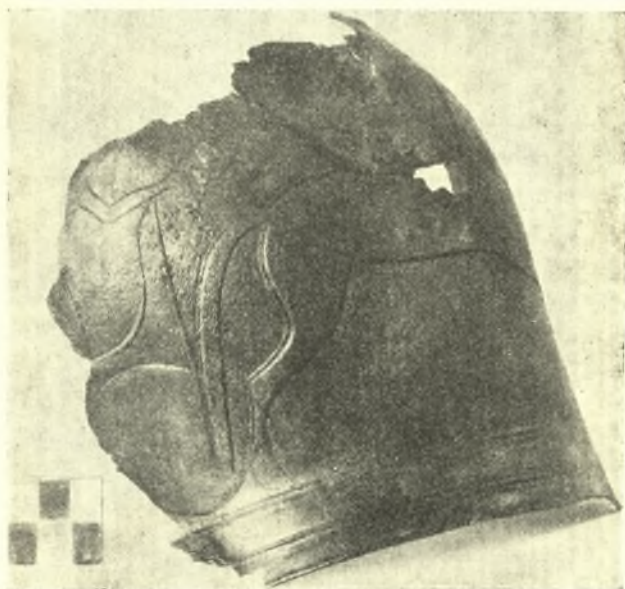
Εἰκ. 1. Ἡ ἐξ Ὀνυθῆ Γουλεδιανῶν χαλκῆ ἀνάγλυφος περικεφαλαία (6 ου π. Χ. αἰ.).

Ἐφορμὴν εἰς τὴν ἀνασκαφὴν ἔδωκεν ἡ πρὸ διαιτίας ἀνεύρεσις τεμαχίων λίαν ἐνδιαφερόντων ἀρχαϊκῶν πίθων, μὲ παραστάσεις γρουπῶν, σφίγγων, ἐλάφων, λεόντων, ταύρων, ψευδοσπειρῶν μὲ ἀπόληξιν κεφαλῶν παρδάλεων, κεφαλῆς Μεδούσης κλπ. ἐλθόντων εἰς φῶς κατὰ τύχην εἰς τὴν περιοχὴν ἀγνώστου ἀρχαίας ἑλληνικῆς πόλεως, τὴν ὁποίαν τινὲς ἐταύτισαν μὲ τὸν Ὀσμίδαν. Αὐτοψία γενομένη εὐθὺς μετὰ τὴν ἀνεύρεσιν τῶν πίθων ὑπ'