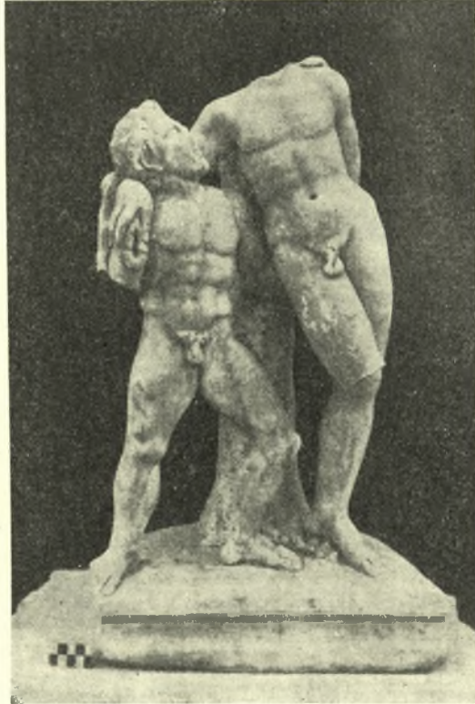
Εἰκ. 2. Σύμπλεγμα Διονύσου καὶ Σατύρου ἐξ Ἐλευθερῶν.

Ἐμελετήθη κατ' ἀρχὴν ἡ καθόλου φυσιογνωμία τῆς ἀρχαίας πόλεως καὶ τῆς δεσποζούσης ἀκροπόλεως· διεπιστώθη ἡ ὑπαρξίς μεγάλου πλήθους οἰκημάτων, τινὰ τῶν ὁποίων εἶναι φθοδομημένα μὲ μεγάλους λίθους· ἐμελετήθη ἐπίσης ἡ πρὸ ὀλίγων ἐτῶν ὑπὸ τῶν κατοίκων ἀποκαλυφθεῖσα ἀρ-