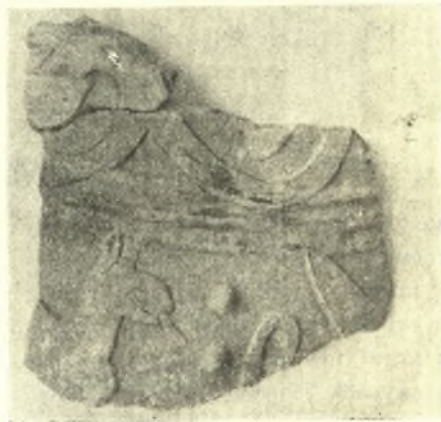
Εἰκ. 4. Τεμάχιον ἀναγλύφου ἀρχαϊκοῦ πίθου ἐξ Ὀνουθῆ Γουλεδιανῶν.

διασωζομένη χαλκῆ περικεφαλαία μετ' τὸ ἐλαφρῶς ἀνάγλυφον ἄρμα, ἡ κατατεθειμένη νῦν εἰς τὸ Μουσεῖον Ρεθύμνης καὶ προσερχομένη κατὰ τὰς ὑπαρχούσας ἐνδείξεις ἐξ Ὀνουθῆ (εἰκ. 1) εἶναι ἐν τῶν καλυτέρων δειγμάτων τῆς ἑλληνικῆς τορευτικῆς καὶ χρονολογεῖται εἰς τὰς ἀρχὰς τοῦ βου π. Χ. αἰῶνος. Ἐκ τῆς περιοχῆς Ἐλευθερῶν περισυνελέγη λίαν ἐνδιαφέρουσα στήλη ἀρχαϊκῶν ἑλληνικῶν χρόνων μετὰ παράστασιν ὀπίτου (ἑλλιπῆς ἄνω) καὶ μαρμαρινὸν σύμπλεγμα μεθυσμένου Διονύσου, ὑποστηριζομένου ὑπὸ Σατύρου, ἑλληνορωμαϊκῶν χρόνων (εἰκ. 2).