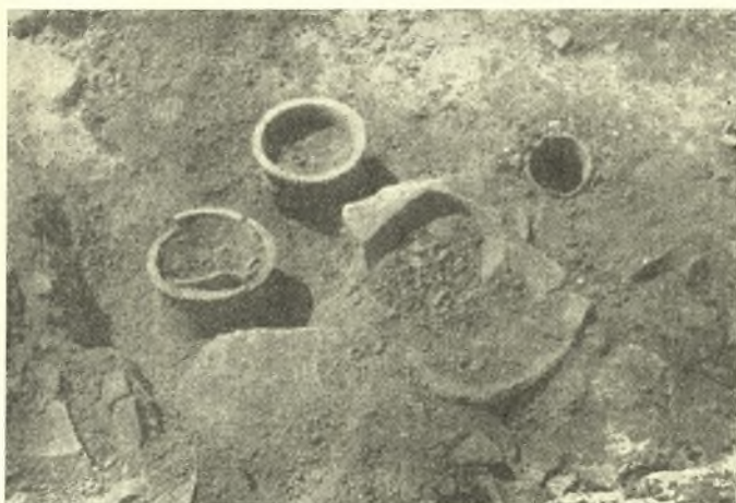
Εἰκ. 6. Κυλινδρικοί βάσεις εἰς τὸ δυτικὸν τμήμα τοῦ δωματίου β τῆς ἀρχαϊκῆς οἰκίας Α Ὀνουθῆ Γουλεδιανῶν.

Ἡ οἰκία Β, ὄχι εἰς μεγάλην ἀπόστασιν ἀπὸ τὴν πρώτην, παρηκολουθήθη καθ' ὅλον τὸ μῆκος τῶν περιμετρικῶν τῆς τοίχων ἢ μία πλευρά