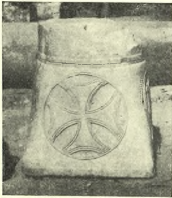
Εἰκ. 3. Κιονόκρανον ἐκ τῆς βασιλικῆς τοῦ Γλυκῆος.

3. Μεταγενέστεραι ἐπεμβάσεις: Κατὰ τὸν 17ον—18ον αἰῶνα ἡ ἀνασκαπτομένη βασιλικὴ τοῦ Γλυκῆος ἐστερεώθη διὰ σειρᾶς ἐσωτερικῶν καὶ ἔξωτερικῶν ἀντηρίδων, ὑπέστη ἐλαφρὰς τινὰς διαρρυθμίσεις (προσθήκη ὑπερφύου-γυναικωνίτου) καὶ διεκοσμήθη διὰ τοιχογραφιῶν ἐκ νέου. Ἐκ τοῦ μεταγενεστέρου τούτου τοιχογραφικοῦ διακόσμου διεσώθη ἐπὶ τῆς δυτικῆς ὄψεως τῆς βορείας ἐσωτερικῆς ἀντηρίδος ζώνη πλάτους 0.61 μ. μὲ ἀφηγηματικὴν εἰς δροσερὸν λαϊκὸν ὕφος ἀπεικόνισιν τιμωριῶν τῆς κολάσεως (εἰκ. 4).