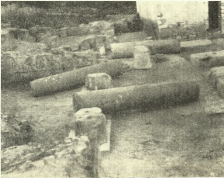
Εἰκ. 2. Μερικὴ ἐκ Δ. ἀποψὶς τῆς ἀνασκαφῆς τῆς βασιλικῆς τοῦ Γλυκέος.

Κατὰ τὴν ἀνασκαφὴν εὐρέθησαν ἐπὶ πλέον τεμάχια παλαιοχριστιανικῶν μαρμαρίνων μελῶν, ἐπὶ τοῦ νεωτέρου δὲ ναυδρίου τῆς Παναγίας πα-