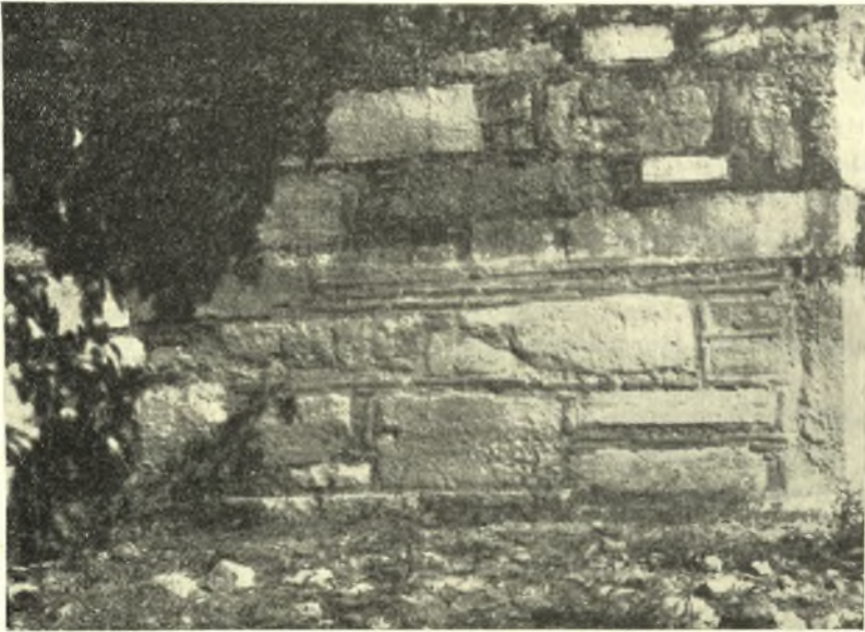
Εἰκ. 1. Βασιλικὴ Γλυκέως. Τοιχοδομία τῆς νοτίας πλευρᾶς τῆς κόγχης τοῦ ἱεροῦ.

2. Μαρμαρίνα μέλη : Εἰς τὸ μέσον κλίτος εὐρέθη ἡ θέσις ἐπιμήκους καὶ ὀγκώδους ἄμβωνος, κατὰ τὸν ἄξονα τῆς ἐκκλησίας, ὅπως περιπου εἰς τὴν βασιλικὴν τῆς Καλιμπάκας. Ὁ ἄμβων ἔβαινε ἐπὶ δύο ἰσχυρῶν ποδαρικῶν, πρὸς στήριξιν τῶν ὁποίων, οἶονεὶ ὡς βάθρα, ἐχρησιμο-