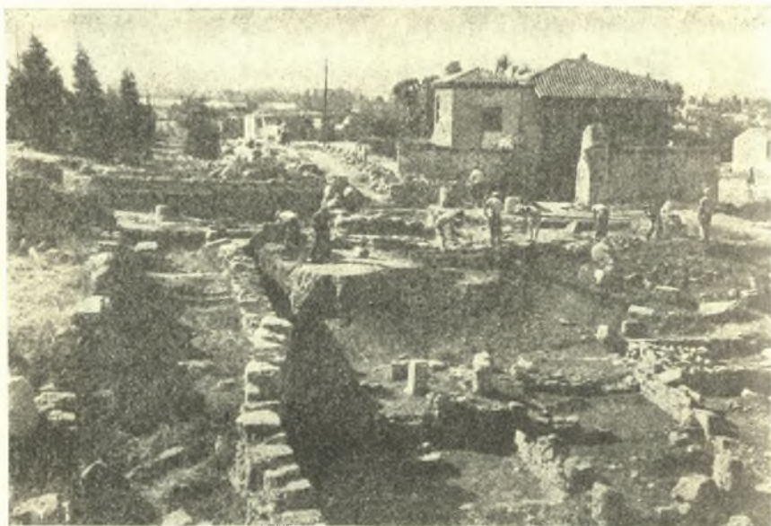
Εἰκ. 1. Τὸ ἀνασκαφὲν νέον τμήμα τοῦ ἱεροῦ κατὰ τὴν ἑναρξίν τῆς ἐφεινητῆς ἀνασκαφῆς.

Μετὰ τὴν ἐξακρίβωσιν τῶν πραγματικῶν ὁρίων τοῦ ἱεροῦ πρὸς δυσμὰς τῶν Μεγάλων Προπυλαίων, διὰ τῆς ἀνευρέσεως τοῦ διαχωριστικοῦ τοίχου τοῦ χωρίζοντος τὸ ἱερὸν ἀπὸ τὴν πόλιν 1 , ἡ ἀνασκαφὴ τοῦ παρόντος ἔτους σκοπὸν εἶχε τὴν ἀποκάλυψιν καὶ τοῦ νέου τούτου τμήματος τοῦ ἱεροῦ, μέχρι τοῦ διαχωριστικοῦ τοίχου, τοῦ διατειχίσματος, ὅπως ὀνομάζεται εἰς μίαν Ἑλευσινιακὴν ἐπιγραφὴν 2 .