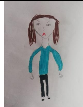
3β Σχέδιο θυμού παιδιού χωρίς πένθος

Στον πίνακα 7 παρουσιάζονται οι συχνότητες και τα ποσοστά εμφάνισης των εκφραστικών στρατηγικών που χρησιμοποίησαν τα παιδιά για την απεικόνιση φόβου, στο σύνολο του δείγματος, καθώς και αναφορικά με το βίωμα του πένθους.