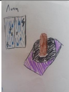
2α Σχέδιο λύπης παιδιού με πένθος