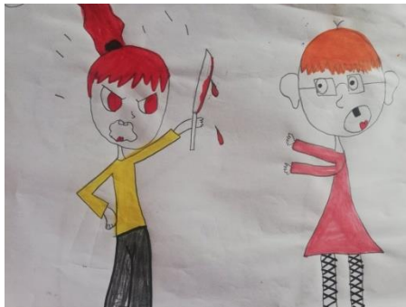
3α Σχέδιο θυμού παιδιού με πένθος