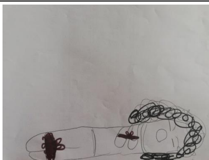
4α Σχέδιο φόβου παιδιού με πένθος