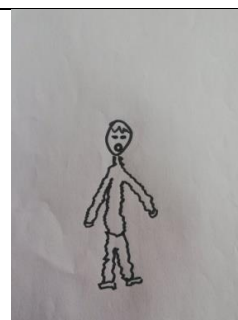
4β Σχέδιο φόβου παιδιού χωρίς πένθος