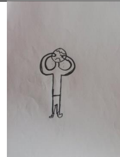
2β Σχέδιο λύπης παιδιού χωρίς πένθος

Στον πίνακα 6 παρουσιάζονται οι συχνότητες και τα ποσοστά εμφάνισης των εκφραστικών στρατηγικών που χρησιμοποίησαν τα παιδιά για την απεικόνιση του θυμού, στο σύνολο του δείγματος, καθώς και αναφορικά με το βίωμα του πένθους.