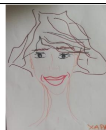
1β Σχέδιο χαράς παιδιού χωρίς πένθος

Στον πίνακα 5 παρουσιάζονται οι συχνότητες και τα ποσοστά εμφάνισης των εκφραστικών στρατηγικών που χρησιμοποίησαν τα παιδιά για την απεικόνιση της λύπης, στο σύνολο του δείγματος, καθώς και αναφορικά με το βίωμα του πένθους.