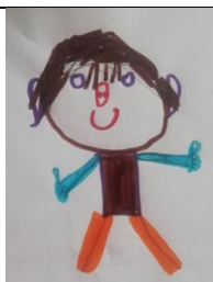
1α Σχέδιο χαράς παιδιού με πένθος