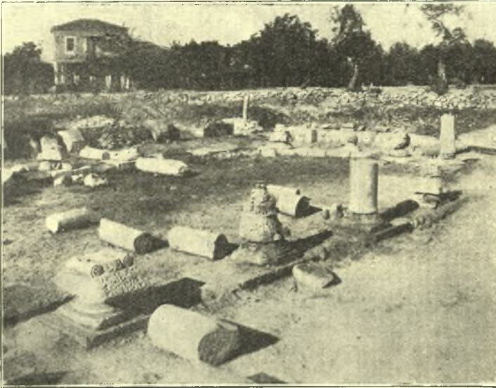
Εἰκ. 1. Ἀποψις τοῦ ἀνευρεθέντος Αἶθριου τῆς χριστ. Βασιλικῆς (ἡ φωτογραφία εἰλημμένη ἀπὸ τοῦ νάρθηκος).

τὸ Αἶθριον τοῦτο κεκοσμημένον, ἤτοι τὰς βάσεις, τοὺς κορμούς, τὰ κιονόκρανα, τὰ ἐπιθήματα καὶ τὰ γείσα. Τὰ ἀρχιτεκτονικὰ ταῦτα μέλη ἐνέχουσι μεγίστην σπουδαιότητα διὰ τὸν γλυπτικὸν τὼν διάκοσμον, τὰ θέματα καὶ τὴν ἐπιμελῆ τὼν ἐργασίαν· τὰ κορινθιάζοντα κιονόκρανα ἄνευ τρυπάνου κατεργασμένα ἔχουσι ποικίλην τὴν μορφήν· εἰς ἓν ἐξ αὐτῶν κάτωθεν τῆς ἐν τῷ μέσῳ μαστοιδοῦς ἀποφύσεως σχηματίζεται ἀμφορεύς, ἐξ οὗ φύεται ἄκανθα, εἰς ἕτερον τὴν θέσιν ταύτην κατέχει ἐλιξ μετὰ ἡμιφύλλων ἀκάνθου, εἰς ἕτερα τρίφυλλα καὶ οὕτω καθεξῆς (βλ. εἰκ. 3 καὶ 4). Τὰ ἐπιθήματα εἶναι ἁπλᾶ μὲ