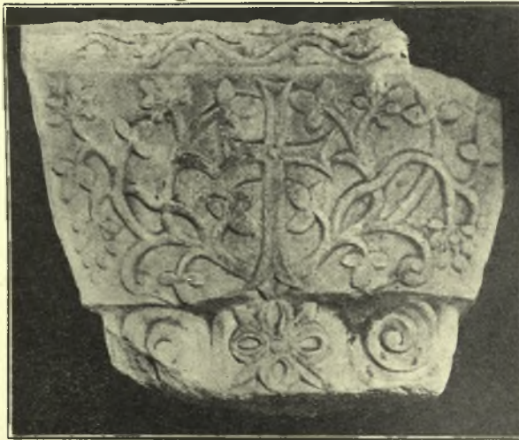
Εἰκ. 7. Ἴωνικὸν κιονόκρανον μετ' ἐπιθήματος· ἀνευρεθὲν κατὰ τὰς δοκιμαστικὰς ἀνασκαφὰς τῶν οἰκοπέδων Ζορμπᾶ.

2) Βορείως τῆς περιοχῆς τῆς ὑποτιθεμένης Ἀγορᾶς τῶν χριστιανικῶν