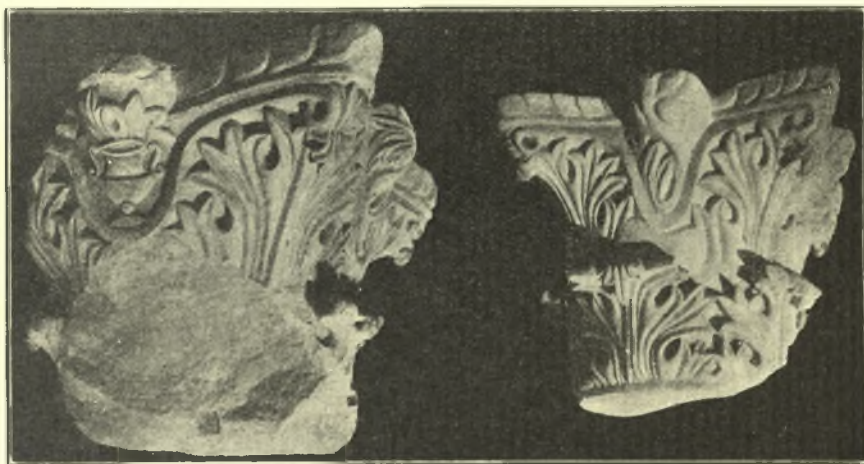
Εἰκ. 4. Κορινθιάζοντα κιονόκρανα τοῦ Αἰθρίου.

ἀνοιγομένης εἰς ἐγκάρσιον τοῖχον διαμερίσματος μὴ διευκρινισθέντος εἰσέτι (βλ. κάτωφινξέν εἰκ. 2). 'Υπετέθη κατ' ἀρχὰς ὅτι πρόκειται περὶ τοῦ Βαпти-