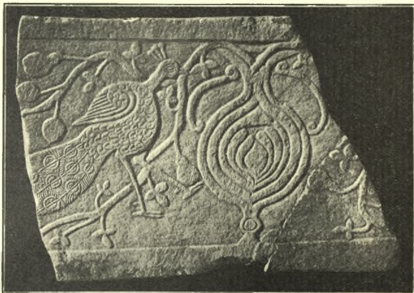
Εἰκ. 6. Θωράκιον ἀνευρεθὲν κατὰ τὴν ἀνασκαφὴν τοῦ δεξοῦ προπύλου τοῦ νάρθηκος ἐπὶ τοῦ μικροῦ τετραγώνου κτίσματος.

Ἡ ἀποκάλυψις τοῦ ὅλου χώρου, ὃν κατεῖχεν ἡ ἀνασκαπτομένη χριστιανικὴ Βασιλικὴ τοῦ Ε' μ.Χ. αἰῶνος ἀνευ μεταγενεστέρων ἐπισκευῶν καὶ