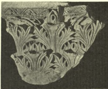
Εἰκ. 5. Κορινθιάζον κιονόκρανον παραστάδος (ἀνευρεθὲν κατὰ τὰς ἀνασκαφὰς τοῦ Αἰθρίου ἀνήκον ὅμως πιθανῶς εἰς τὸν κυρίως ναόν).

Κατὰ μῆκος τῆς νοτίας πλευρᾶς ἀπεκαλύφθη ἐφέτος σύμπλεγμα οἰκοδομημάτων ἐπὶ τῆς πλευρᾶς ταύτης τοῦ ναοῦ στηριζομένων· ἐκ τούτων τὸ μὲν δυτικόν εἶναι τετράγωνον διαμέρισμα καὶ συγκοινωνεῖ διὰ μιᾶς θύρας δεξιὰ τοῦ Αἰθρίου εὐρισκομένης, εἶναι δὲ κατὰ πᾶσαν πιθανότητα ὁ δεξιὸς πύργος τῆς προσόψεως τοῦ ναοῦ, ὡς ἐν τῇ περυσινῇ ἐκθέσει μου ἀνέφερον, τὸ δὲ ἀνατολικῶς αὐτοῦ ἐκτεινόμενον κτίσμα εἶναι ἐπιμήκης αἴθουσα ἀπολήγουσα εἰς ἡμικύκλιον καὶ συγκοινοῦσα διὰ δύο θυρίδων: ἐκ μὲν τοῦ Αἰθρίου διὰ τῆς Β. πυλίδος τῆς δεξιᾶς πλευρᾶς, ἐκ τοῦ Νάρθηκος δὲ διὰ πυλίδος