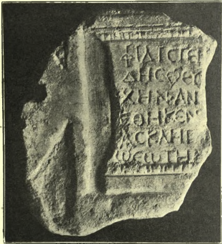
Εἰκ. 2. Ἐπιγραφή.

Τὸ ἀνατολικὸν ἀνάλημμα τοῦ θεάτρου, ὅπερ συνορεύει μὲ τὴν δυτικὴν