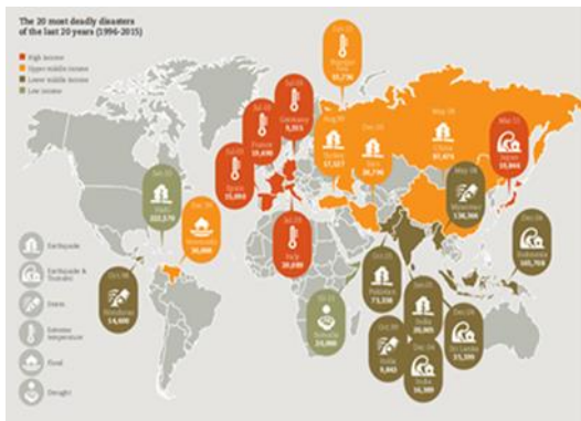
Εικόνα 5. Οι 20 πιο θανατηφόρες φυσικές καταστροφές των τελευταίων 20 χρόνων, 1996 – 2015.