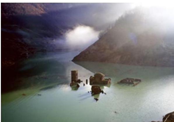
Εικόνες 8 & 9. Μεσαιωνική πόλη της Ιταλίας βυθισμένη σε λίμνη.