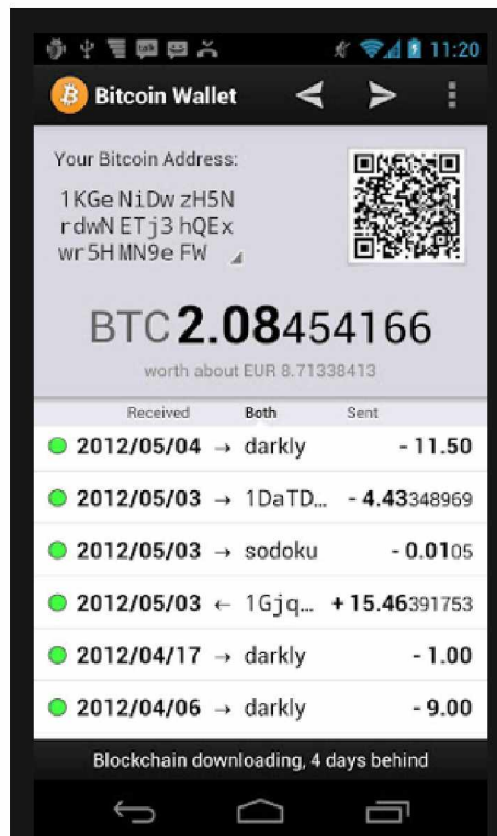
Εικόνα 6-To Bitcoin wallet

Τα Bitcoin wallets μπορούν να κατηγοριοποιηθούν ως εξής: