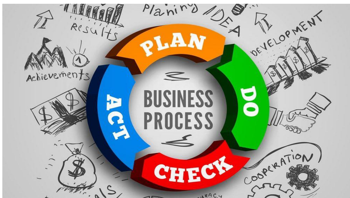
Εικόνα 2 : Ο κύκλος PDCA(Blog, 2019)

Το πρότυπο ISO 9001 αποτελεί το πλέον διαδεδομένο πρότυπο ποιότητας το οποίο φέρει ως αναγνωριστικό χαρακτηριστικό τη θέσπιση των απαιτήσεων εκείνων με βάση τις οποίες θα πρέπει να λειτουργεί μία επιχείρηση ώστε το προσφερόμενο προϊόν να ικανοποιεί πλήρως τις προσδοκίες των πελατών αλλά και των εμπλεκόμενων μερών (Δερβιτσιώτης, 2001). Η δομή του προτύπου ακολουθεί τη θεμελιώδη προσέγγιση για την διαχείριση ποιότητας: Σχεδιάζω-Ενεργώ-Ελέγχω-Βελτιώνω (Plan-DO-Check-Act) ενώ αυτό μπορεί να εφαρμοστεί σε οποιοδήποτε οργανισμό επιθυμεί να βελτιώσει τις σχέσεις του με τους πελάτες και τους προμηθευτές του.