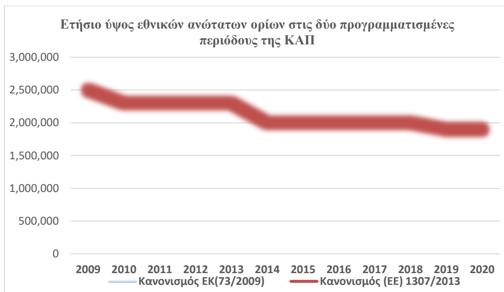
Γράφημα 2: Ετήσιο ύψος των εθνικών ανώτατων ορίων στις 2 προγραμματικές περιόδους της ΚΑΠ (ΟΡΕΚΕΡΕ, 2015)

Με τα γραφήματα αυτά κλείνει και το κεφάλαιο της εισαγωγής στις έννοιες της φορολογίας και αγροτών και ακολουθεί το επόμενο, το οποίο αναφέρεται στη φορολογία των αγροτών και τις μεταρρυθμίσεις της.