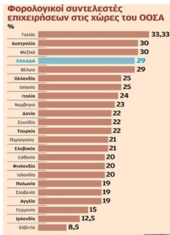
Πίνακας 13 Φορολογικοί συντελεστές επι/σεων ΟΟΣΑ