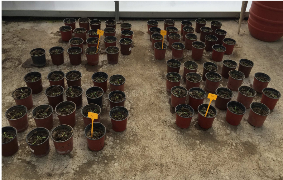
Εικόνα 2.1: Οι τέσσερις ομάδες των φυτών σταμναγκαθιού (0, 200 ppm, 400 ppm και 600 ppm) στον εσωτερικό χώρο του θερμοκηπίου