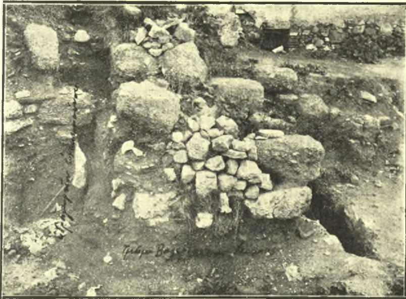
Εἰκ. 3. ᾠδαίον Περικλέους: τμήμα Βαλεριανείου τείχους καὶ ὑδραγωγείου Ἐννεακρούνου.

Οὕτω λοιπὸν ζητητέον τὸ τέρμα τοῦ τοίχου τῆς Δ. πλευρᾶς πέραν καὶ τοῦ Προπύλου 1 εἰς μῆκος 65 περίπου μέτρων, ὅσον εἶναι καὶ τῆς βορείου πλευρᾶς· ἡμεῖς δὲ ἀνασκάψαντες μόνον εἰς μῆκος 27 μέτρ. ἔχομεν ἀκόμη νὰ