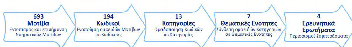
Εικόνα 1. Διαδικασία Θεματικής Ανάλυσης στην Έρευνα

Η σύνθεση των απαντήσεων στα τέσσερα (4) προσδιορισθέντα Ερευνητικά Ερωτήματα αποτελεί προϊόν εξαγωγής συμπερασμάτων από τα αποτελέσματα της ερευνητικής διαδικασίας και δη της θεματικής ανάλυσης σε όλα τα ιεραρχικά επίπεδα: Εννοιολογικά Μοτίβα > Κωδικοί > Κατηγορίες > Θεματικές Ενότητες > Ερευνητικά Ερωτήματα (Εικόνα 1).