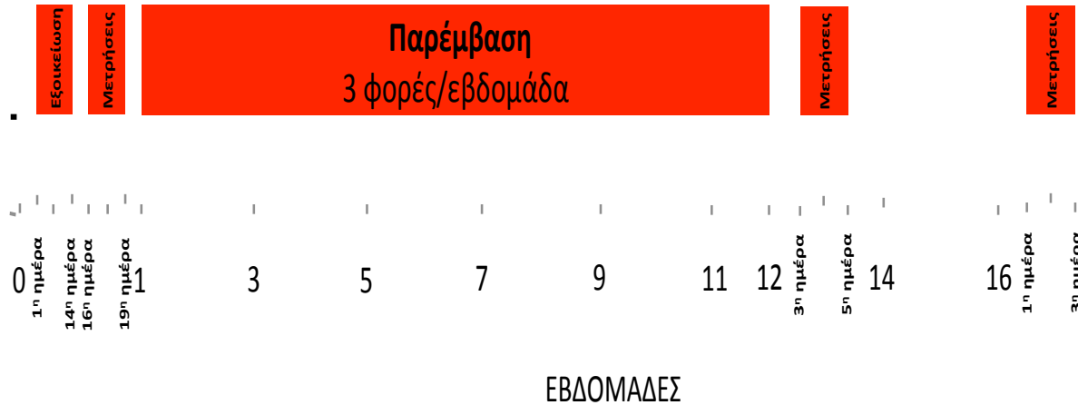
Σχεδιάγραμμα 2. Ο σχεδιασμός της έρευνας.