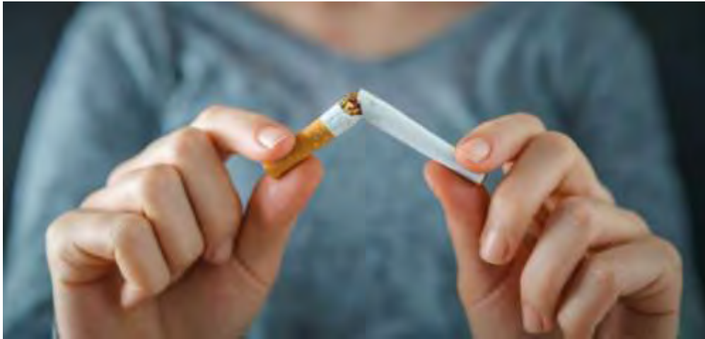
Εικόνα 1 Διακοπή καπνίσματος

Η αυξημένη συχνότητα και εξάπλωση του καπνίσματος τα τελευταία χρόνια έχει οδηγήσει τους αρμόδιους οργανισμούς κάθε χώρας να προβούν σε εκστρατείες ευαισθητοποίησης και κινητοποίησης του πληθυσμού, σχετικά με τις βλαβερές συνέπειες και την ανάγκη διακοπής του καπνίσματος. Ο βαθμός επιτυχίας των εκστρατειών αυτών για τη διακοπή είναι συνάρτηση δύο παραγόντων, της κινητοποίησης του πληθυσμού και του επιπέδου εξάρτησης από τη νικοτίνη [52]. Σύμφωνα με στοιχεία παγκόσμιας κλίμακας έχει διαπιστωθεί πως ένα μεγάλο ποσοστό του 1,1 δισεκατομμυρίου ανθρώπων που κάνουν χρήση προϊόντων καπνού έχει εκδηλώσει την επιθυμία για διακοπή του καπνίσματος [12].