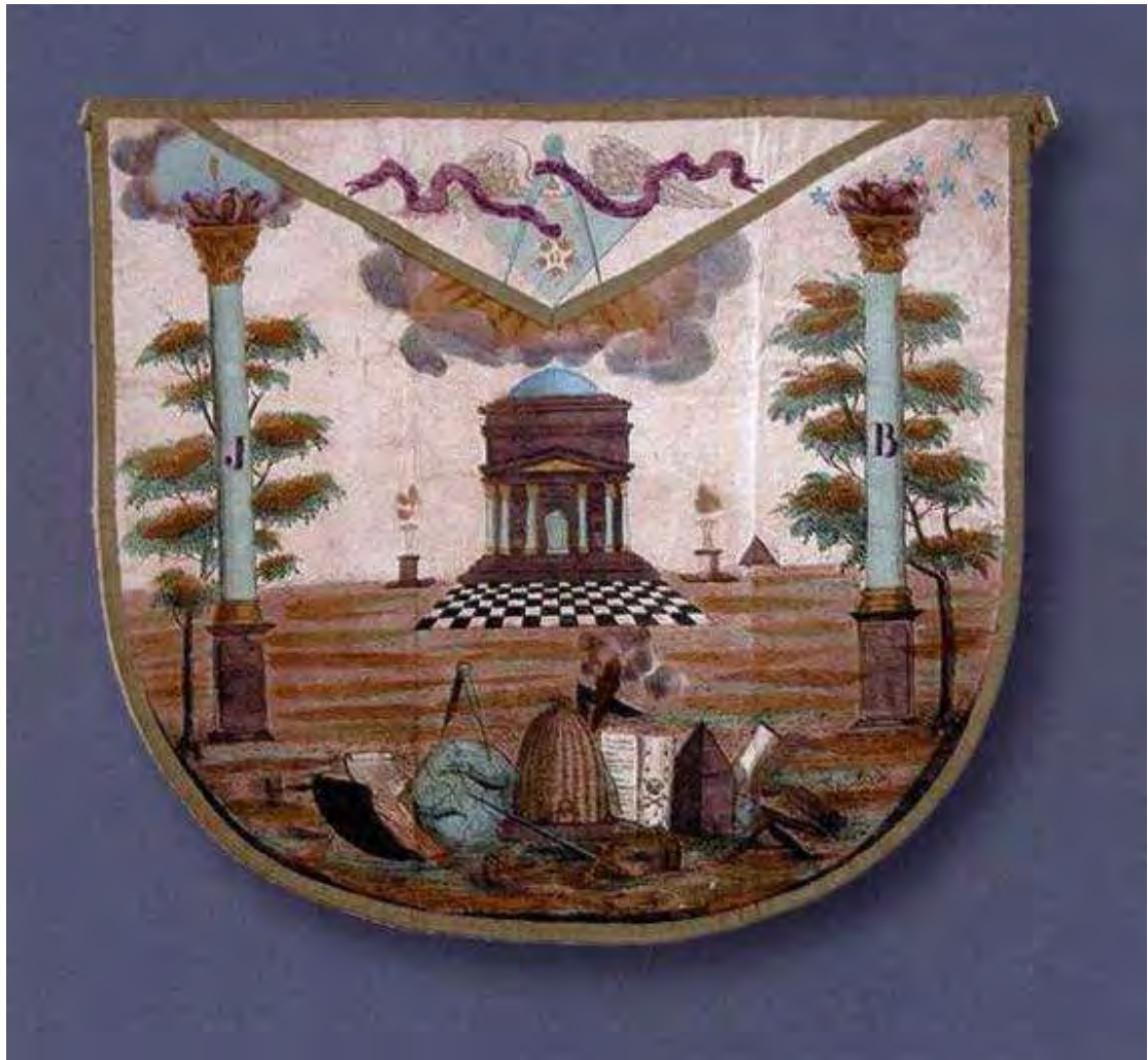
Δερμάτινο περίζωμα (19 ος αιώνας)