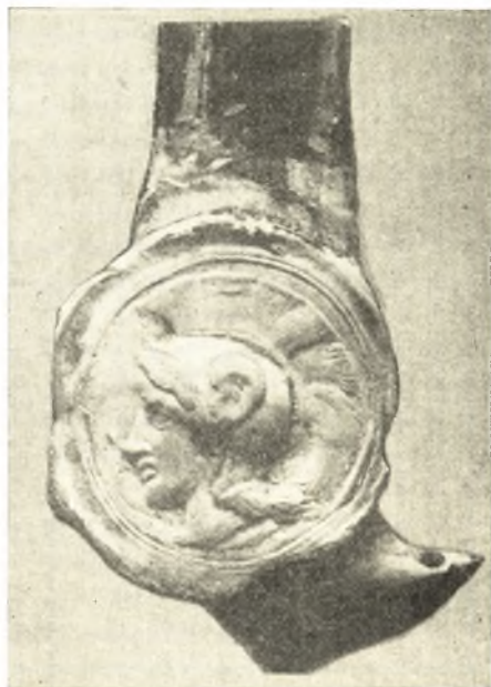
Εἰκ. 2. Λαβὴ ἀγγείου μετ' ἐκτύπου κεφαλῆς Ἀθηνᾶς.

εἶναι δὲ τοῦτο λαβὴ μεγάλου ἀγγείου φέρουσα ἐν εἴδει ἑλλειψοειδοῦς δακτυλιολίθου ὠραίαν προτομὴν Ἀθηνᾶς πρὸς τὰ ἀριστερὰ (εἰκ. 2). Εὗρέθη παρὰ τὴν τάφρον τῆς εἰς Θήβας ἀμαξιτῆς ὁδοῦ. Μικρὰ σκαφικὴ ἔρευνα γενομένη εἰς τὸ μέρος, ἔνθα εὗρέθη ἡ λαβὴ, οὐδὲν σημεῖον κτηρίου ἢ τάφρου παρουσίασεν.