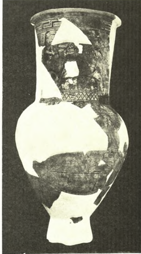
Εἰκ. 3. Ὁ ἀμφορεὺς τῆς Ἀφροδίτης.

προδήλως ἐκ τάφων συληθέντων παλαιότερον 1 . Εἰς δὲ τὴν περιοχὴν τοῦ Γυμνασίου ἠνοίξαμεν πέντε τάφους γεωμετρικούς, ἔξ ὧν ὡς μᾶλλον ἐνδιαφέροντας μνημονεύομεν ἐνταῦθα δύο. Ὁ πρῶτος εὑρίσκεται ἀμέσως δεξιὰ τῆς δημοσίας ὁδοῦ παρὰ τὴν ΒΔ γωνίαν τοῦ ἐκκλησιδίου τῆς Ἁγίας Θεοδοσίας καὶ ἐν μικρῷ μέρει ὑπὸ τὸν βόρειον τοῖχον τῆς ἐκκλησίας λελαξευμένος ἐντὸς τοῦ ἔξ εὐθρύπτου γρανίτου ἐδάφους (εἰκ. 4). Αἱ διαστάσεις του εἶναι: μῆκος 2,22, πλάτος 0.70 καὶ βάθος 0.40 μ. Ὁ τάφος ἦτο ἀδιατάρακτος ἐκτὸς κατὰ τὰ ἀνώτατα χῶματα μετακινήθεντα ὀλίγον κατὰ τὴν θεμελίωσιν τῆς ἐκκλησίας. Λόγῳ τοῦ ἐξαιρετικῶς εὐθρύπτου τοῦ γρανίτου καὶ τῆς ἐν τῷ τάφῳ ἐπικρατούσης μεγάλης ὑγρασίας δὲν ἠδυνήθημεν νὰ ἀναγνωρίσωμεν ἐκ τοῦ σκελετοῦ, εἰμὴ ὀλίγα τεμάχια τοῦ κρανίου κατὰ τὴν ΝΔ γωνίαν τοῦ τάφου. Ἡ μεγάλη ὑγρασία ἔβλαψε σημαντικῶς καὶ τὰ κτερίσματα τοῦ τάφου καταστήσασα ἐξίτηλον τὸν διάκοσμον τῶν ἀγγείων, ὁ ὁποῖος ἐκόλλησεν ἐπὶ τῶν περιβαλλόντων χωμάτων. Ἦσαν δὲ τὰ κτερίσματα πολυάριθμα καὶ σημαντικά: τὰ ἀγγεῖα (σκύφοι, οἶνοχοαί, πυξίδες κτλ.) ὑπερβαίνουν τὰ δεκαπέντε, ἰδιαιτέρως ὁμως μνεῖας ἀξία εἶναι περὶ τὰ τριάκοντα πήλινα εἰδῶλια γεωμετρικὰ τὴν διαμόρφωσιν (ὑψηλοὶ καὶ κατακόρυφοι λαιμοὶ καὶ πόδες, ὑποτυπώδη πτερυγία ἀποτελοῦντα μετὰ τοῦ κορμοῦ μίαν ἐπίπεδον ἐπιφάνειαν κατὰ τρόπον ἐνθυμίζοντα τὴν σχηματοποίησιν τῶν ἄλλως ἀσχέτων βεβαίως μυκηναϊκῶν εἰδῶλιων) καὶ τὴν διακόσμησιν (συνδυασμοὶ εὐθειῶν καὶ καμπύλων γραμμῶν). Ἀκριβε-