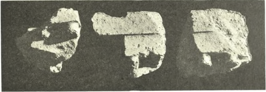
Εἰκ. 3. Τεμάχια ἐπιστολίων ἐκ τοῦ ἀρχαίου ναοῦ τῆς Ἀρτέμιδος.

θανάτατα καὶ αὐτὸς ὑπὸ τοῦ μεγάλου σειμοῦ τοῦ 250 μ. Χ., ἀνεκτίσθη κατὰ τοὺς μετέπειτα χρόνους ὡς χριστιανικὴ ἐκκλησία τοῦτο ἀποδεικνύουσιν οὐ μόνον σταυροὶ λαξευθέντες ἐπὶ τοῦ πετρώματος, ἐφ' οὗ ἐκτίσθη ὁ ναός,