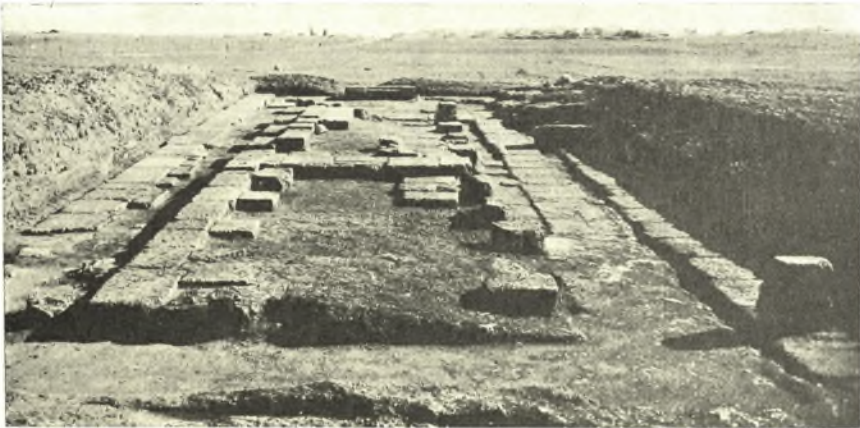
Εἰκ. 1. Ἀποψὶς τῶν θεμελίων τοῦ εἰκαζομένου ναοῦ τῆς Ἀρτέμιδος.

Ἡ κατά τὸ ἔτος 1937 ἀνασκαφικὴ ἐν Σικυῶνι ἐργασία ἐστράφη ἀφ' ἐνὸς μὲν εἰς τὴν ἀποκάλυψιν τοῦ σκάμματος τοῦ Γυμνασίου, ἀφ' ἑτέρου δ' εἰς τὴν ὀλοσχερῆ ἐκκαθάρισιν τοῦ εἰκαζομένου ναοῦ τῆς Ἀρτέμιδος 1 . Καὶ ἡ μὲν ἀνασκαφὴ τῆς αὐλῆς τοῦ Γυμνασίου ἀπέδωκε μόνον τεμάχια τινὰ πηλίνων ἀροκκεράμων τοῦ κτηρίου καὶ τινὰ ἀσήμαντα θραύσματα ἀρχιτεκτονικῶν