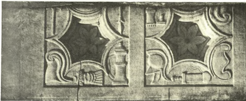
Είκ. 4. Ρωμαϊκά φατνώματα χρησιμοποιηθέντα εις τὴν διακόσμησιν τοῦ χριστιανικού ἄμβωνος.