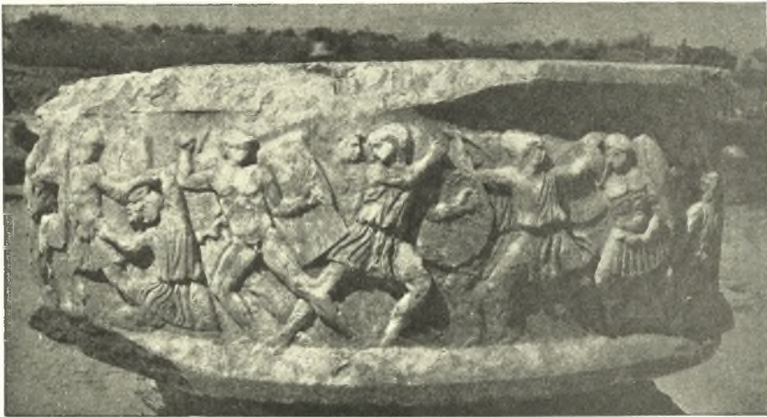
Εἰκ. 6. Ἀρχαῖον βᾶθρον χρησιμοποιοῦν ἐἰς τὸν ἄμβωνα τῆς χριστιανικῆς βασιλικῆς.