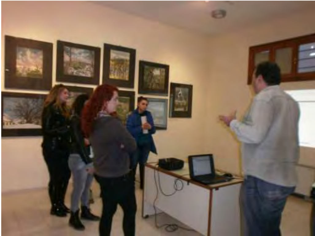
Εικόνα 36: Συνεργασία με τον υπεύθυνο του Μουσείου για την ακρόαση ηχογραφημένης μαρτυρίας για τη γωνία Ιωλκού με Δημητριάδος