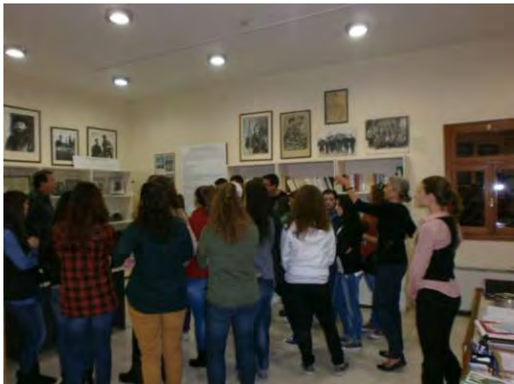
Εικόνα 13: Συζήτηση για τα αντικείμενα του Μουσείου