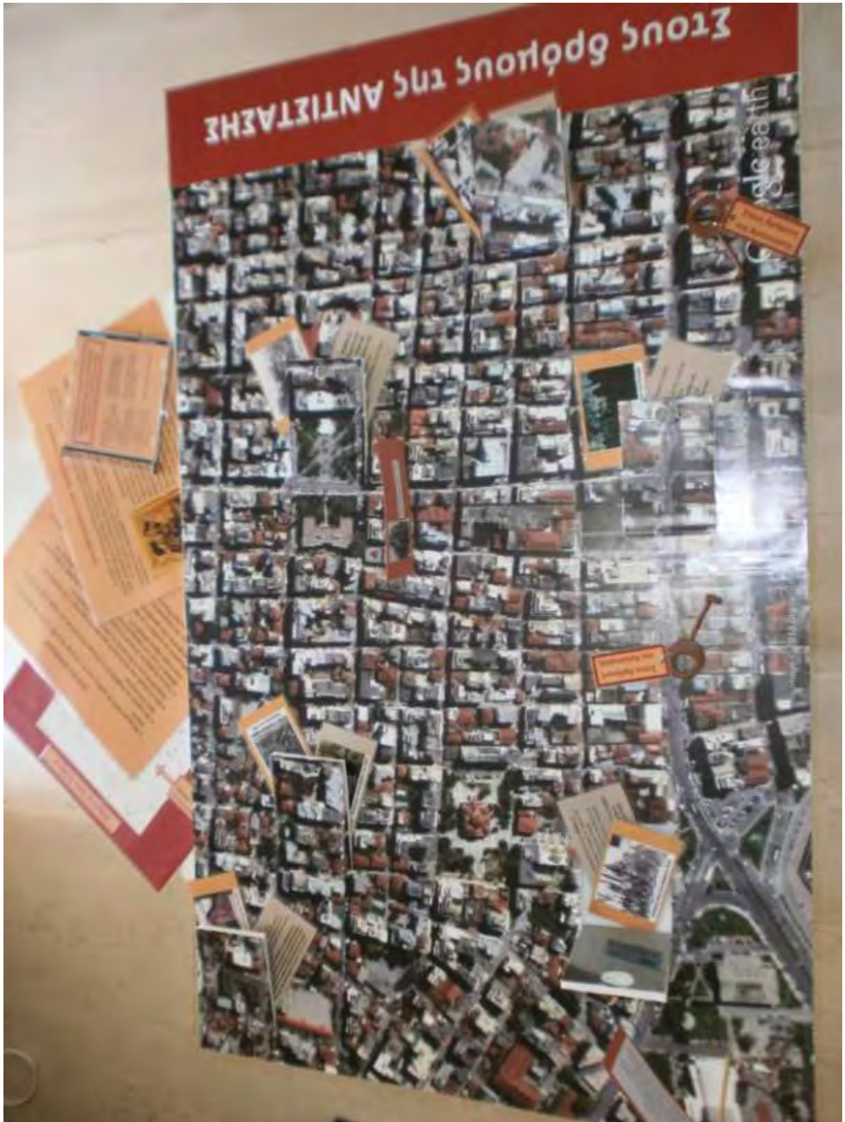
Εικόνα 1: Το έντυπο υλικό του Παιχνιδιού