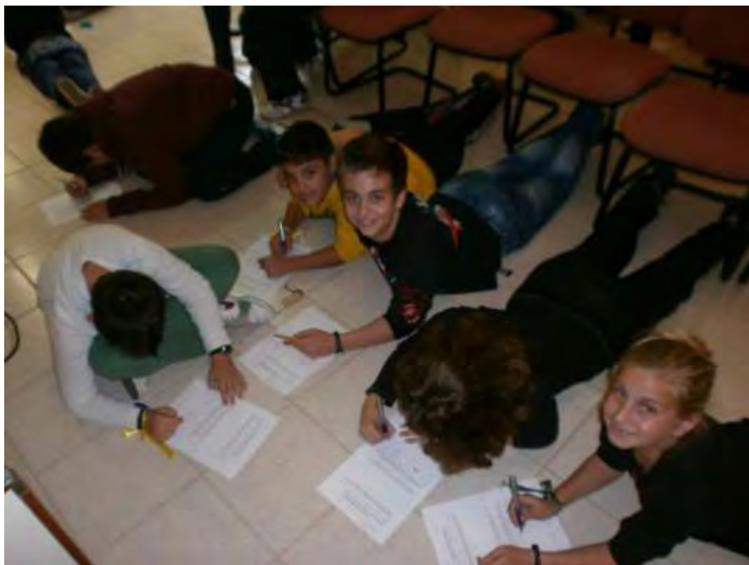
Εικόνα 41: Συμπλήρωση του 2ου μέρους του Ερωτηματολογίου στο πάτωμα