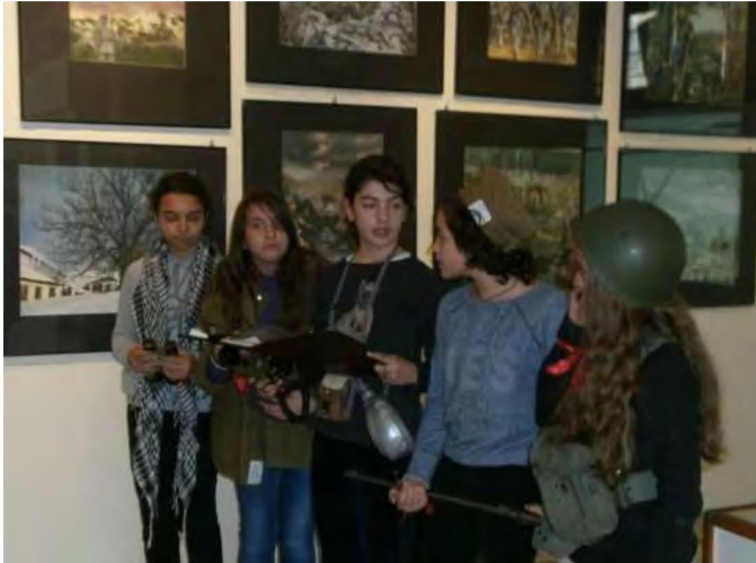
Εικόνα 38: Παρουσίαση των πορισμάτων των αποστολών για την Οδό 54ου Συντάγματος του ΕΛΑΣ