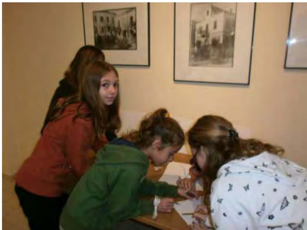
Εικόνα 35: Σχεδιασμός της προκήρυξης για το Παράνομο Τυπογραφείο