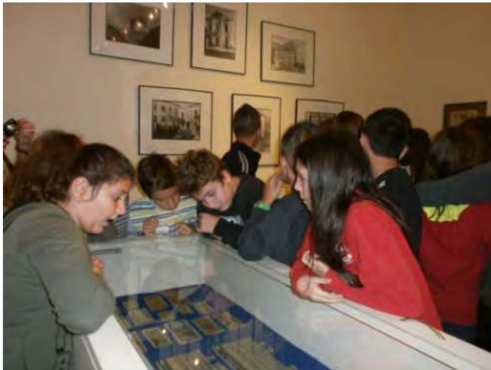
Εικόνα 17: Τα παιδιά παρατηρούν προθήκη με χρήματα και κουπόνια