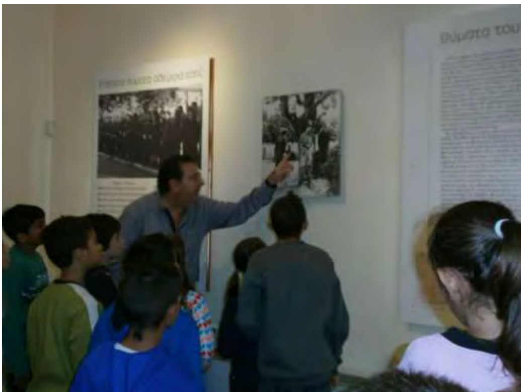
Εικόνα 15: Τα παιδιά παρατηρούν τη φωτογραφία της εκτέλεσης της οικογένειας Τοπάλη