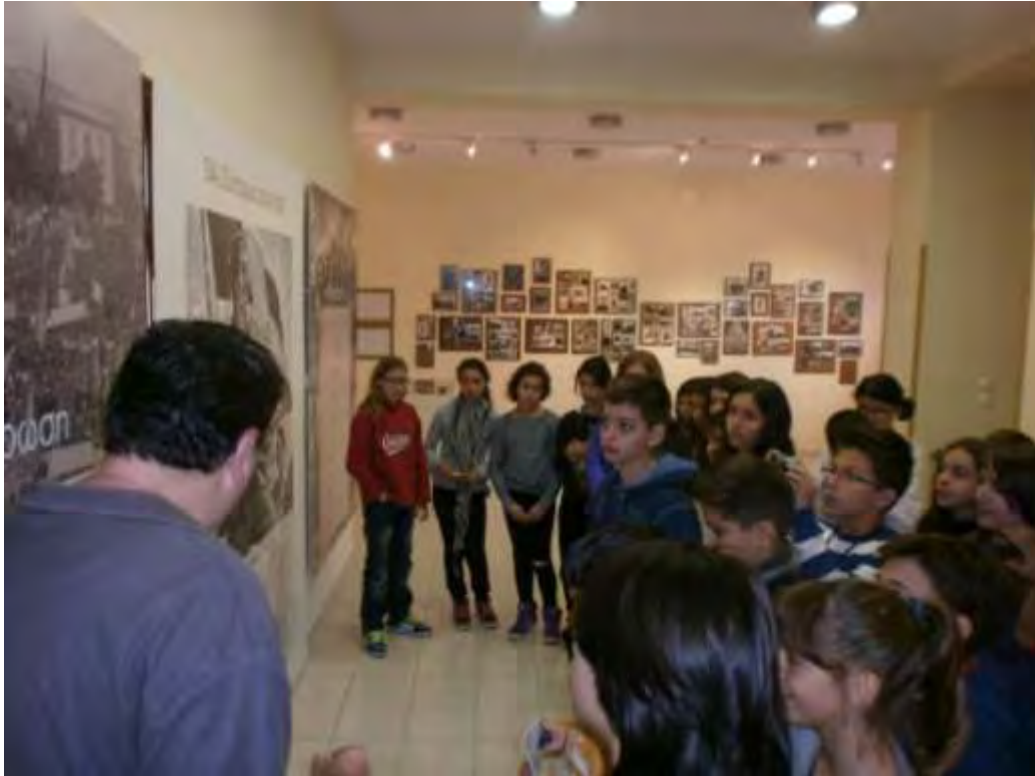
Εικόνα 14: Ξεμάγηση στον 1 ο όροφο του Μουσείου