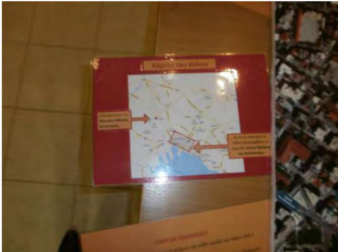
Εικόνα 5: Καρτέλα με χάρτη του Βόλου