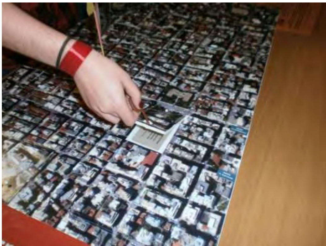
Εικόνα 25: Ξεκλείδωμα της κρύπτης του ιστορικού τόπου