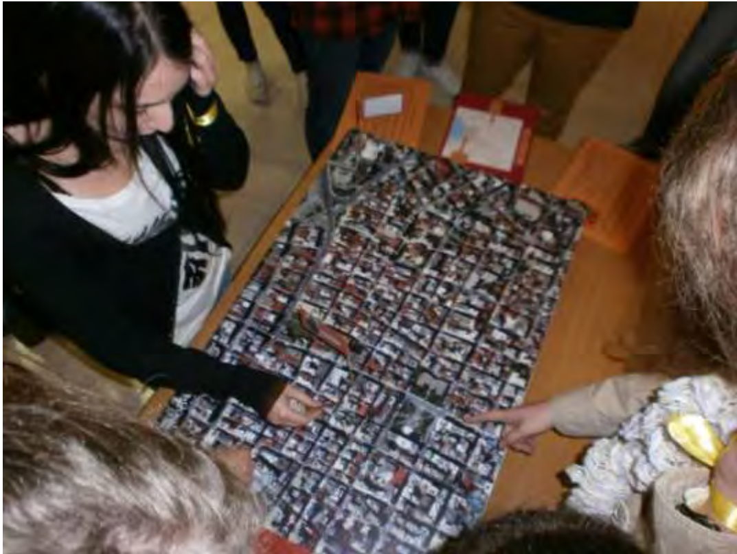
Εικόνα 24: Επιλογή ιστορικού τόπου στο ταμπλό του Παιχνιδιού