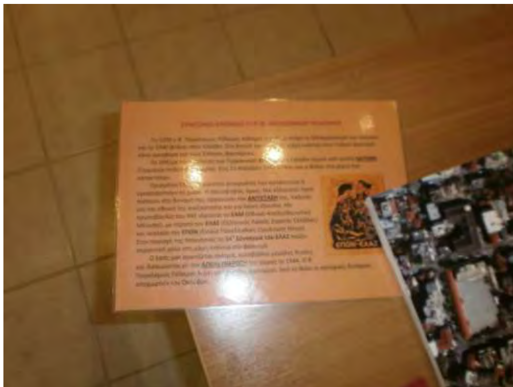
Εικόνα 6: Καρτέλα με χρονικό του Β' Παγκοσμίου Πολέμου