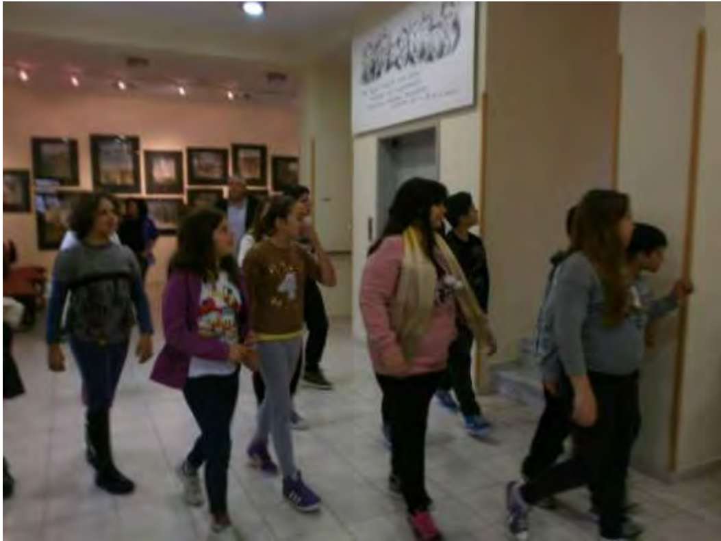
Εικόνα 12: Ξεναγήση στο ισόγειο του Μουσείου