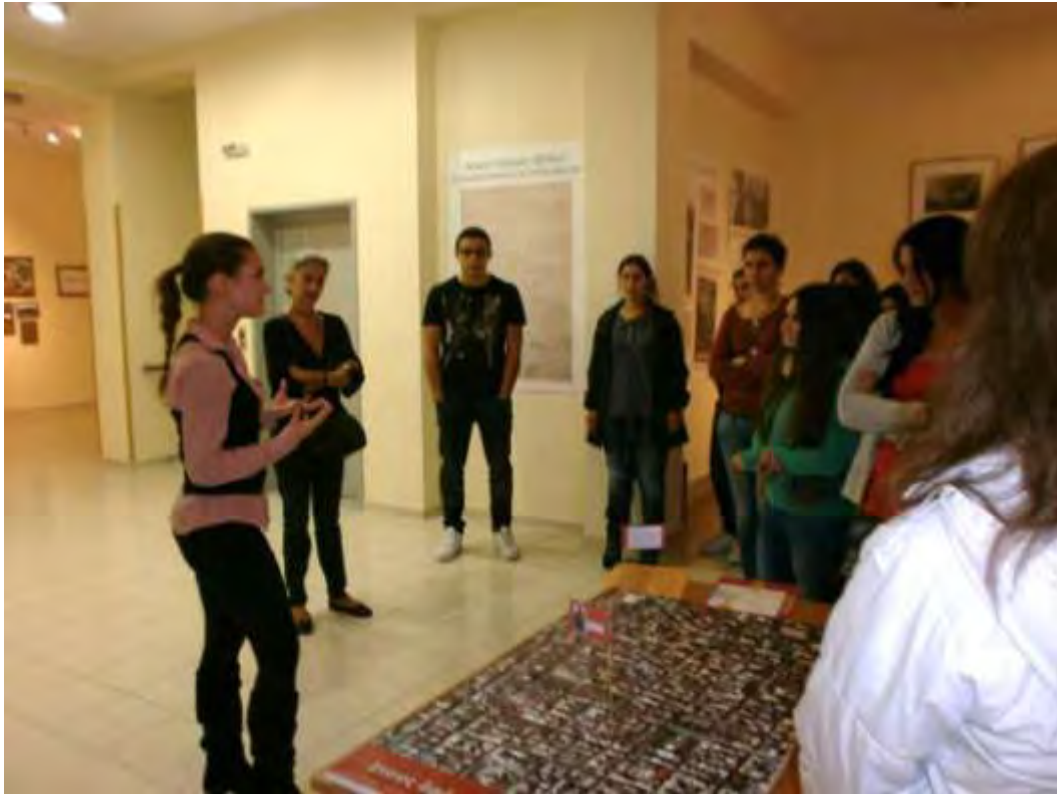
Εικόνα 18: Οδηγίες για το Παιχνίδι