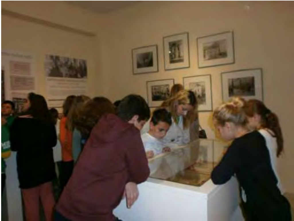
Εικόνα 16: Τα παιδιά παρατηρούν προθήκη με έγγραφα