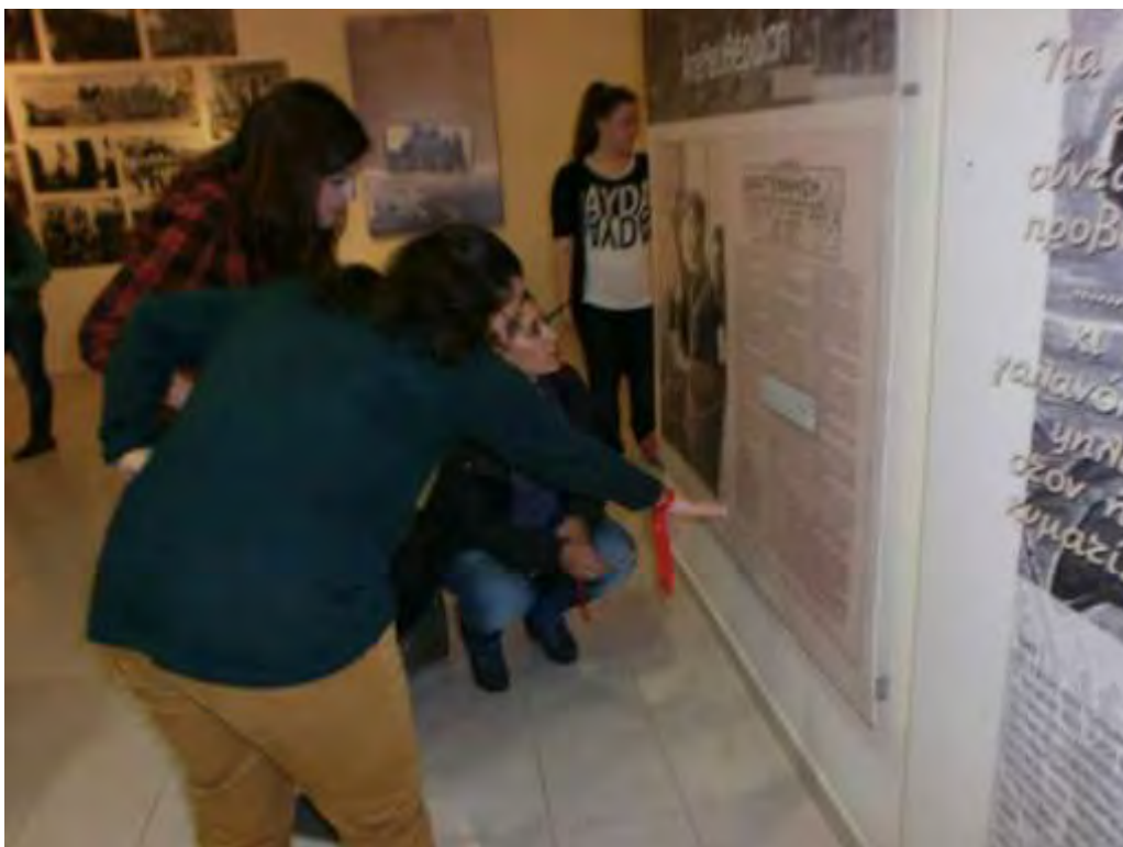
Εικόνα 29: Επεξεργασία άρθρου εφημερίδας για την πραγματοποίηση των αποστολών για την Πλατεία Ελευθερίας