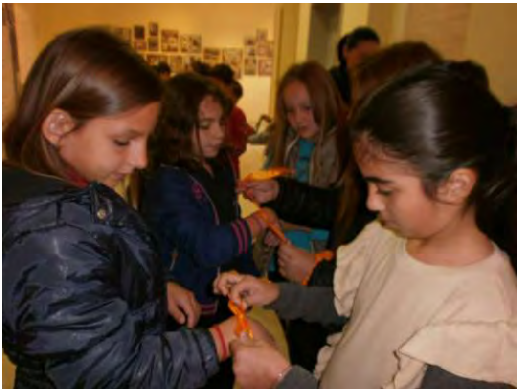
Εικόνα 21: Δέσιμο των κορδελών σε ομάδα κοριτσιών