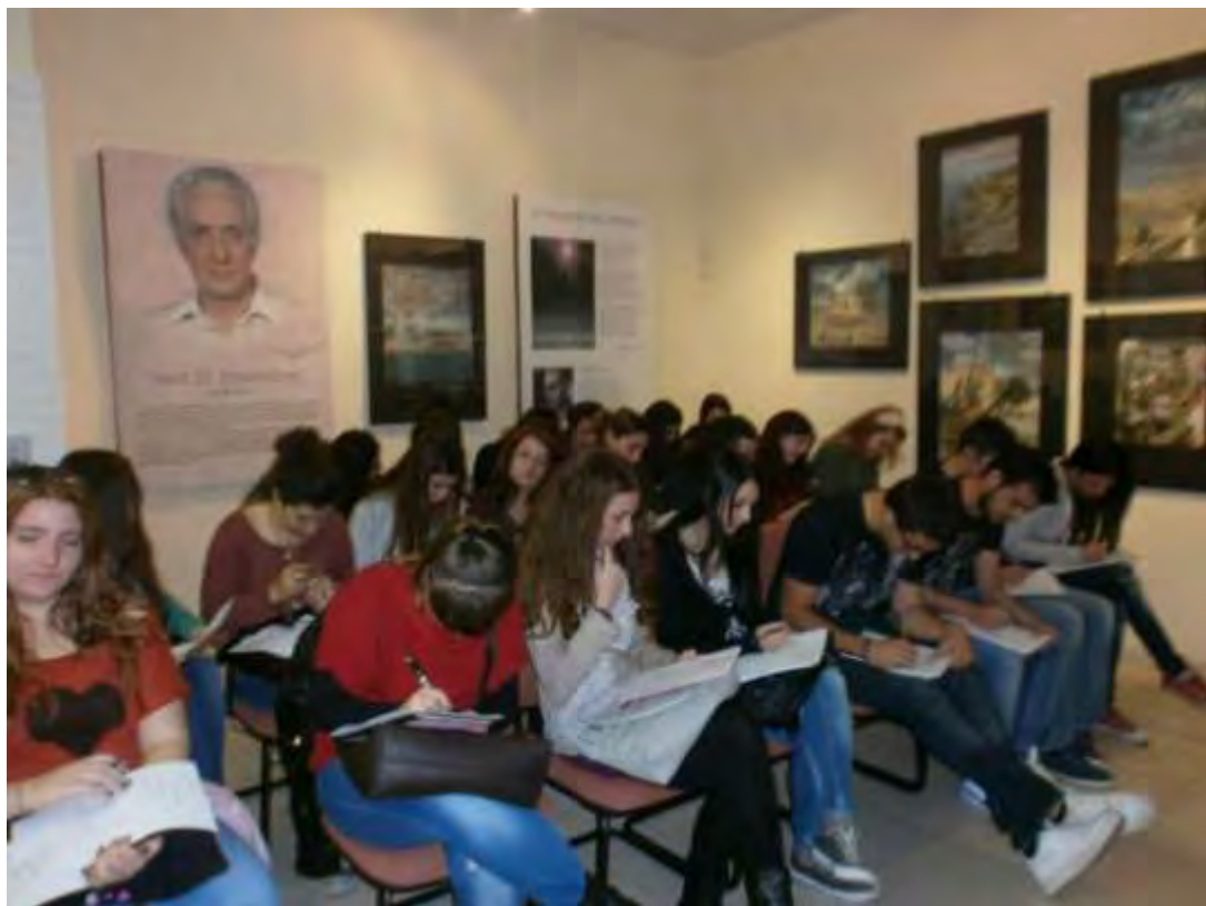
Εικόνα 9: Συμπλήρωση 1ου μέρους του Ερωτηματολογίου