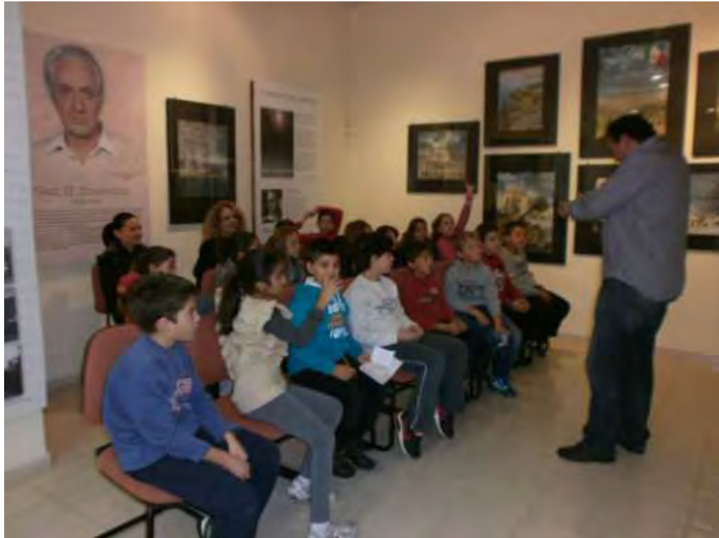
Εικόνα 10: Συζήτηση για το ιστορικό πλαίσιο της Εθνικής Αντίστασης