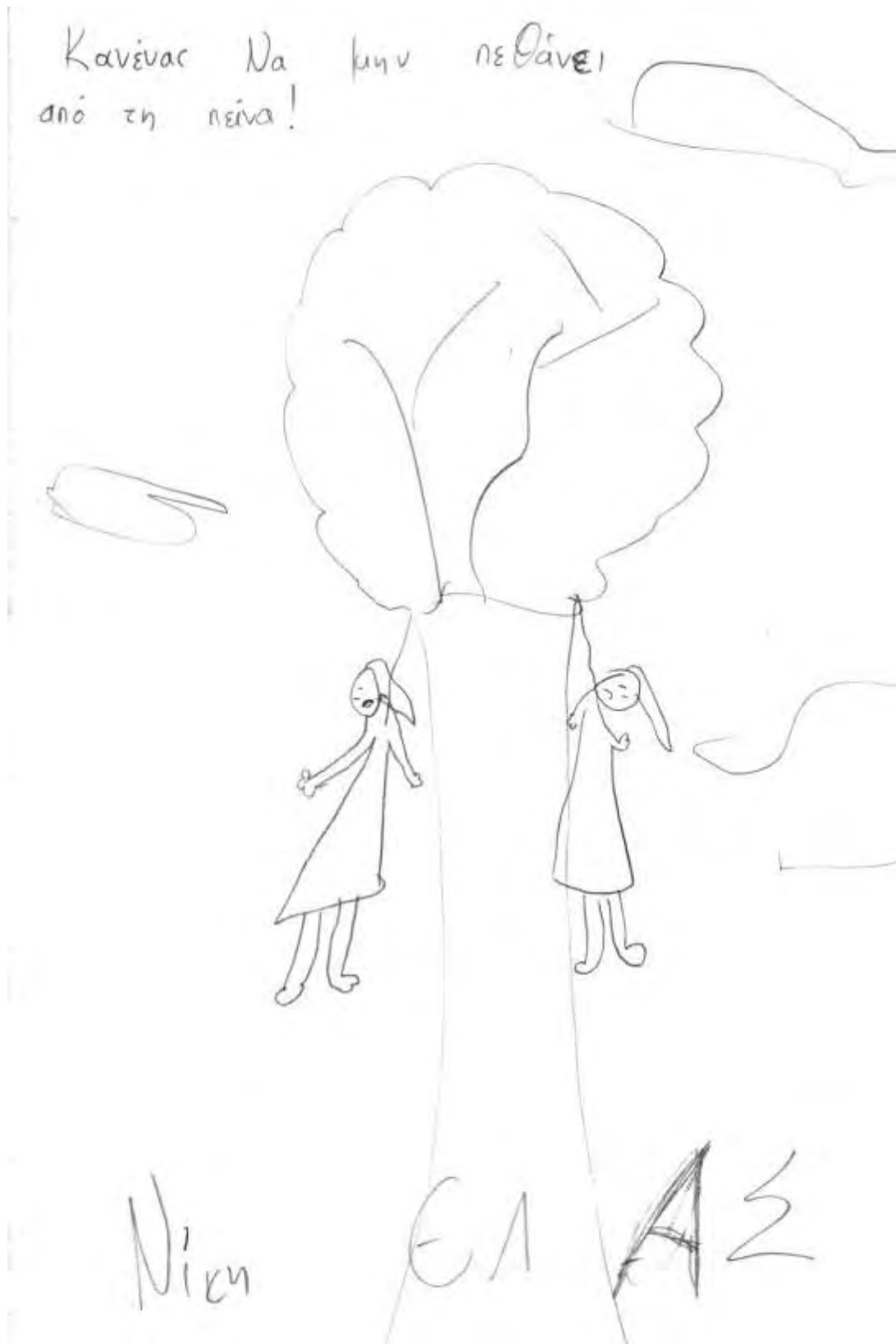
Εικόνα 43: Προκήρυξη σχεδιασμένη από ομάδα που ασχολήθηκε με το Παράνομο Τυπογραφείο