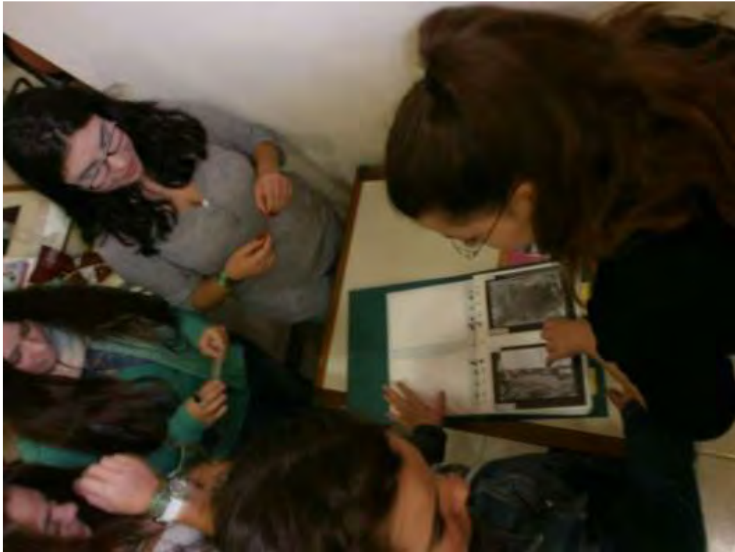
Εικόνα 32: Επεξεργασία φωτογραφιών για την πραγματοποίηση των αποστολών για το Αντιαεροπορικό Καταφύγιο