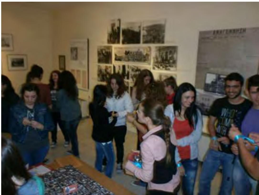
Εικόνα 19: Χωρισμός ομάδων και χορήγηση κορδελών