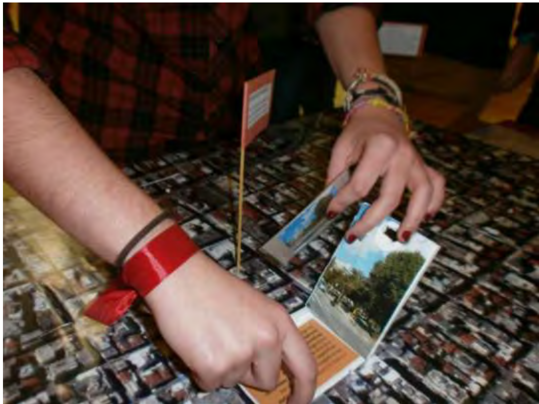
Εικόνα 4: Κρύπτη και κάρτες του παιχνιδιού