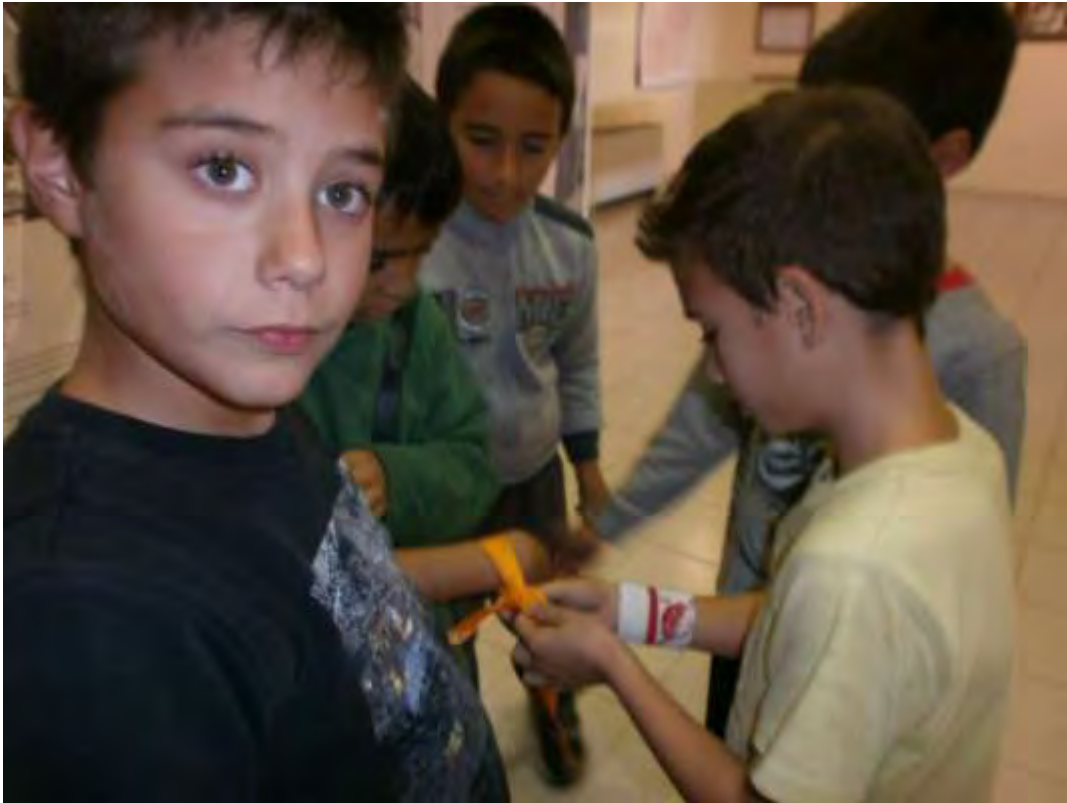
Εικόνα 20: Δέσιμο των κορδελών σε ομάδα αγοριών