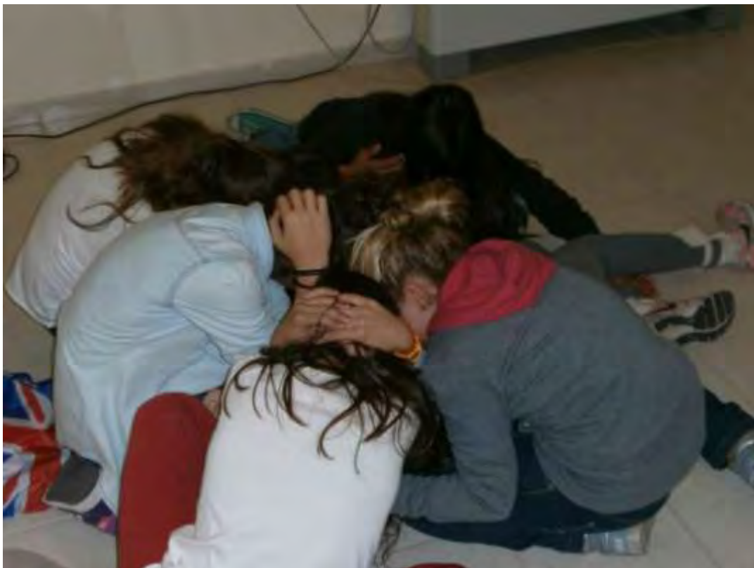
Εικόνα 37: Παρουσίαση δραματοποίησης για το Αντιαεροπορικό Καταφύγιο