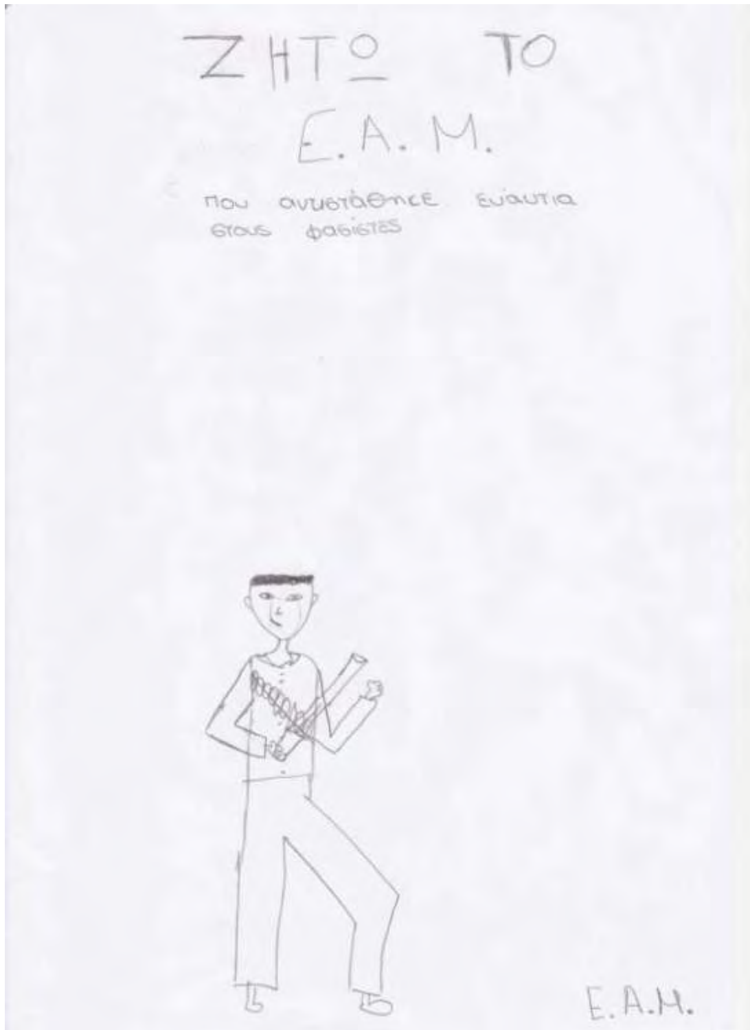
Εικόνα 44: Προκήρυξη σχεδιασμένη από ομάδα που ασχολήθηκε με το Παράνομο Τυπογραφείο