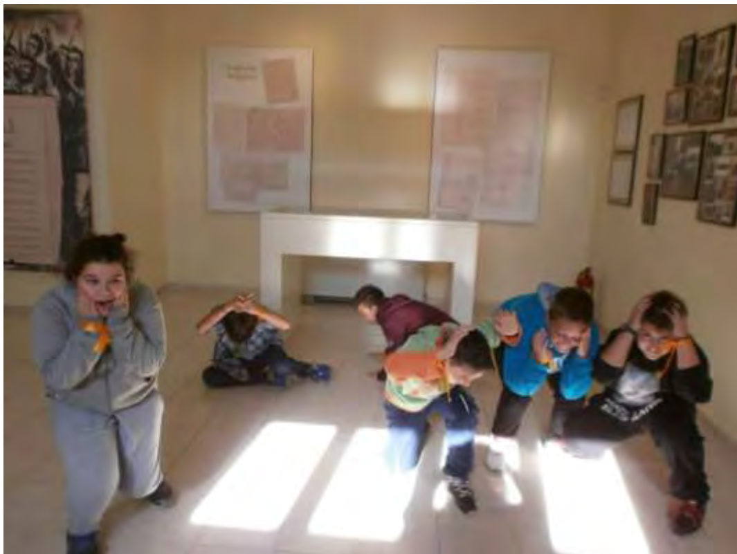
Εικόνα 33: Πρόβα της δραματοποίησης για το Αντιαεροπορικό Καταφύγιο