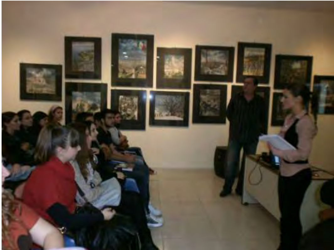
Εικόνα 8: Χορήγηση 1ου μέρους του Ερωτηματολογίου