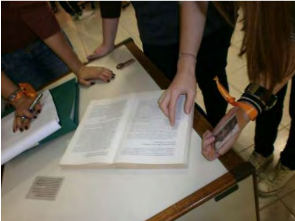
Εικόνα 30: Επεξεργασία στοιχείων από το βιβλίο της Κολιού για τις αποστολές της Κίτρινης Αποθήκης