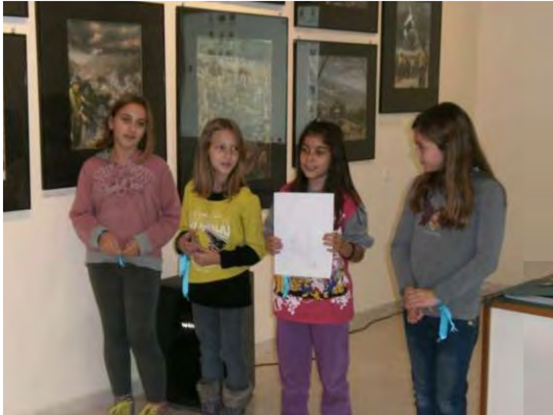
Εικόνα 39: Παρουσίαση των πορισμάτων από τις αποστολές βάση σημειώσεων