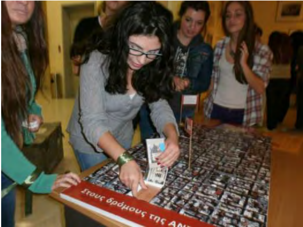
Εικόνα 26: Ομάδα βρίσκει τις δύο κάρτες αποστολών μέσα στην κρύπτη