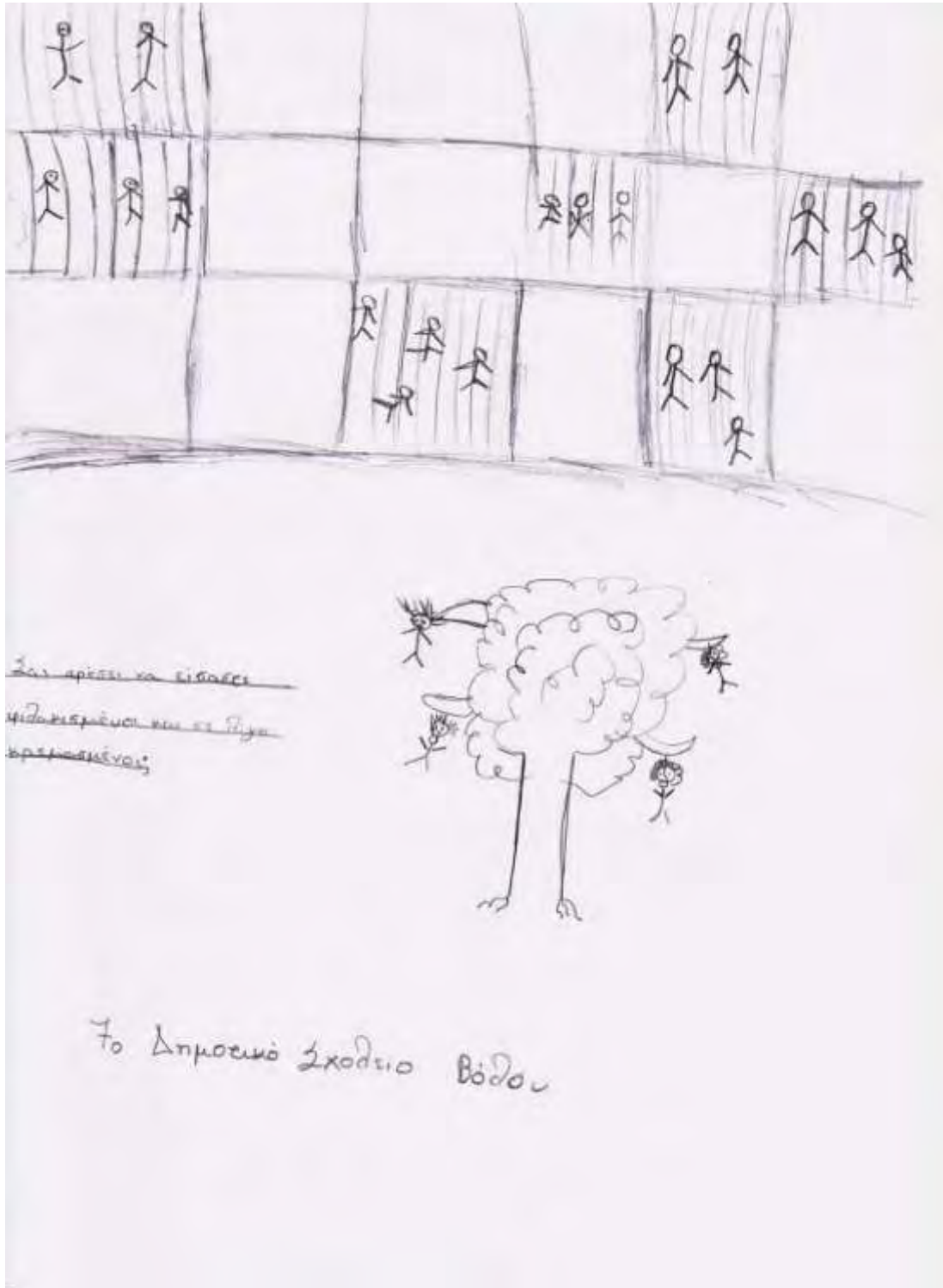
Εικόνα 42: Προκήρυξη σχεδιασμένη από ομάδα που ασχολήθηκε με το Παράνομο Τυπογραφείο