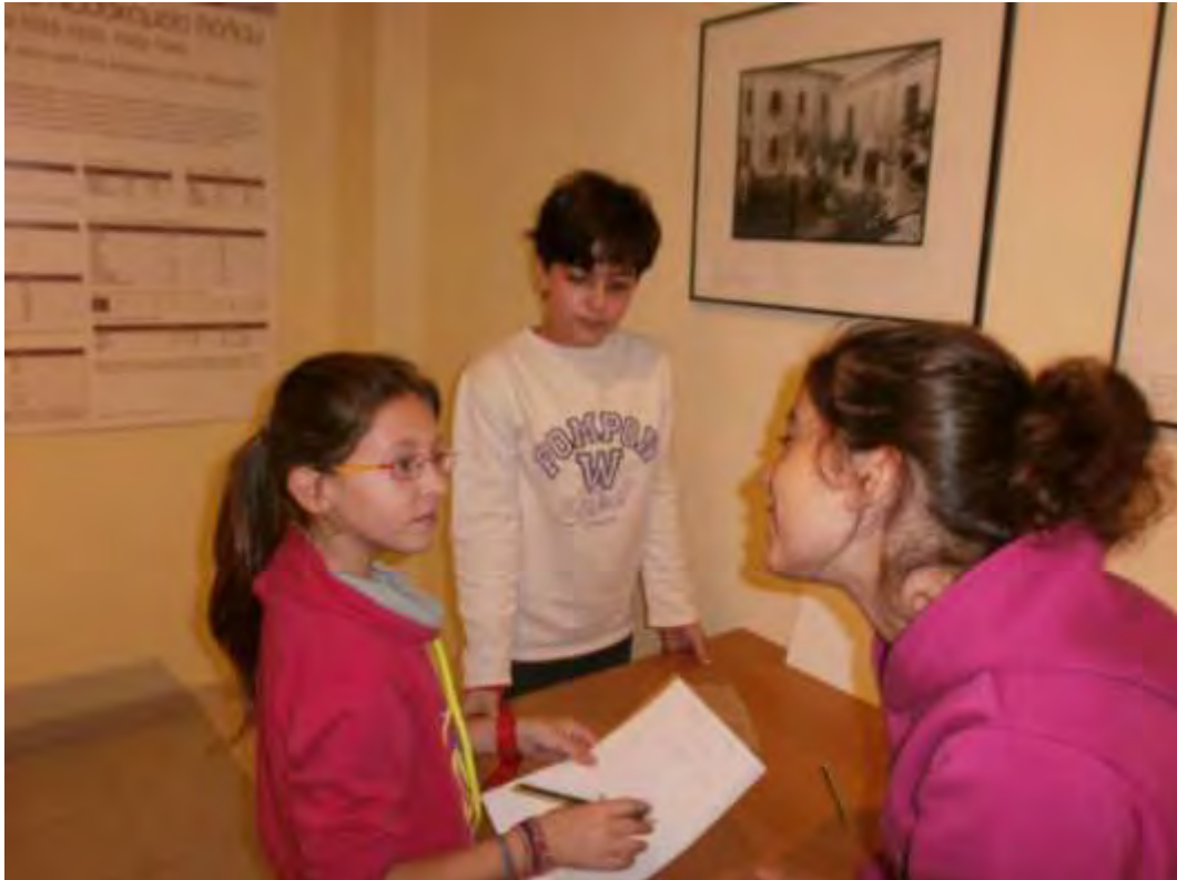
Εικόνα 34: Σύνταξη του κειμένου της προκήρυξης για το Παράνομο Τυπογραφείο