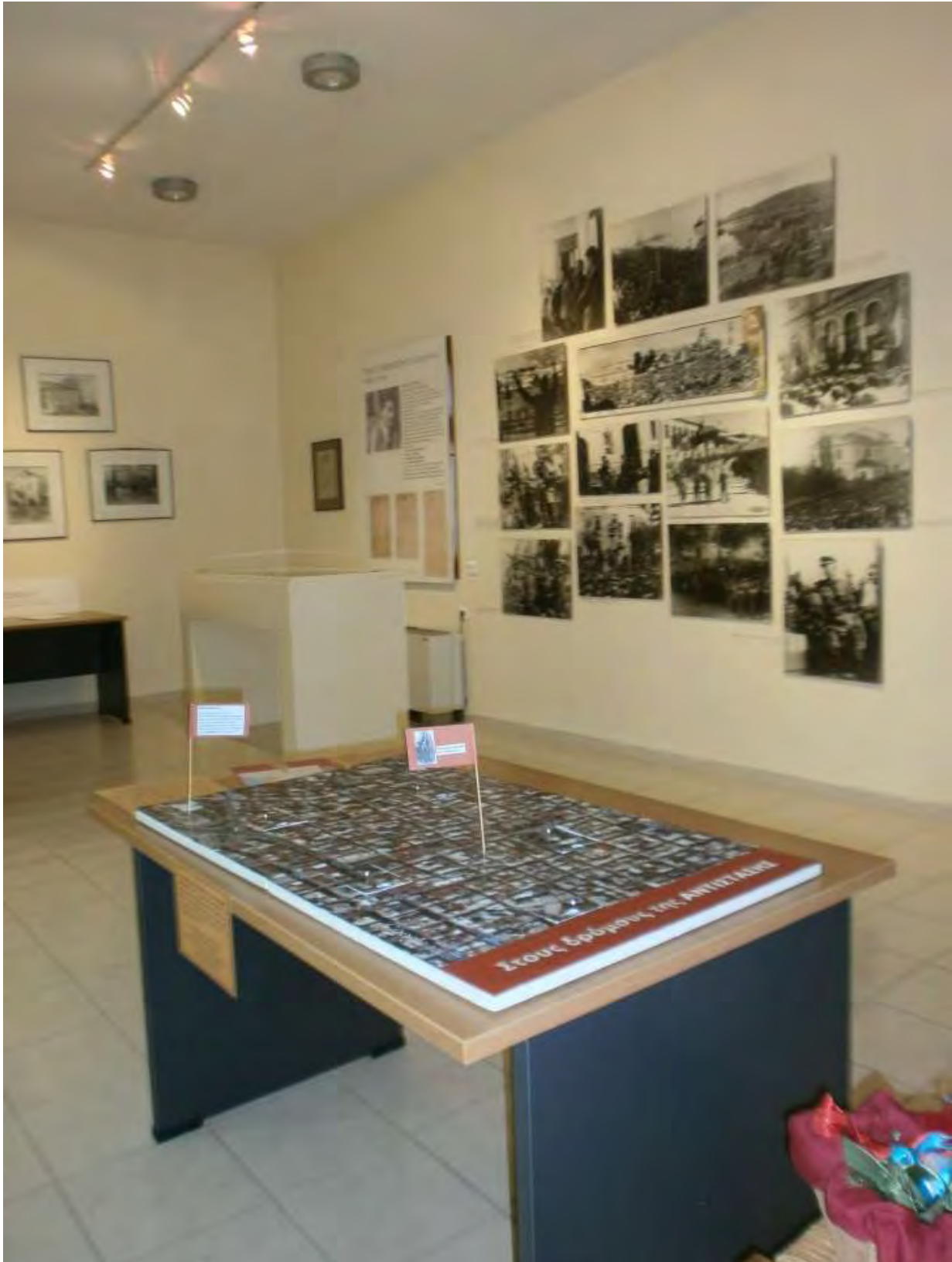
Εικόνα 2: Τοποθέτηση του Παιχνιδιού στο Μουσείο