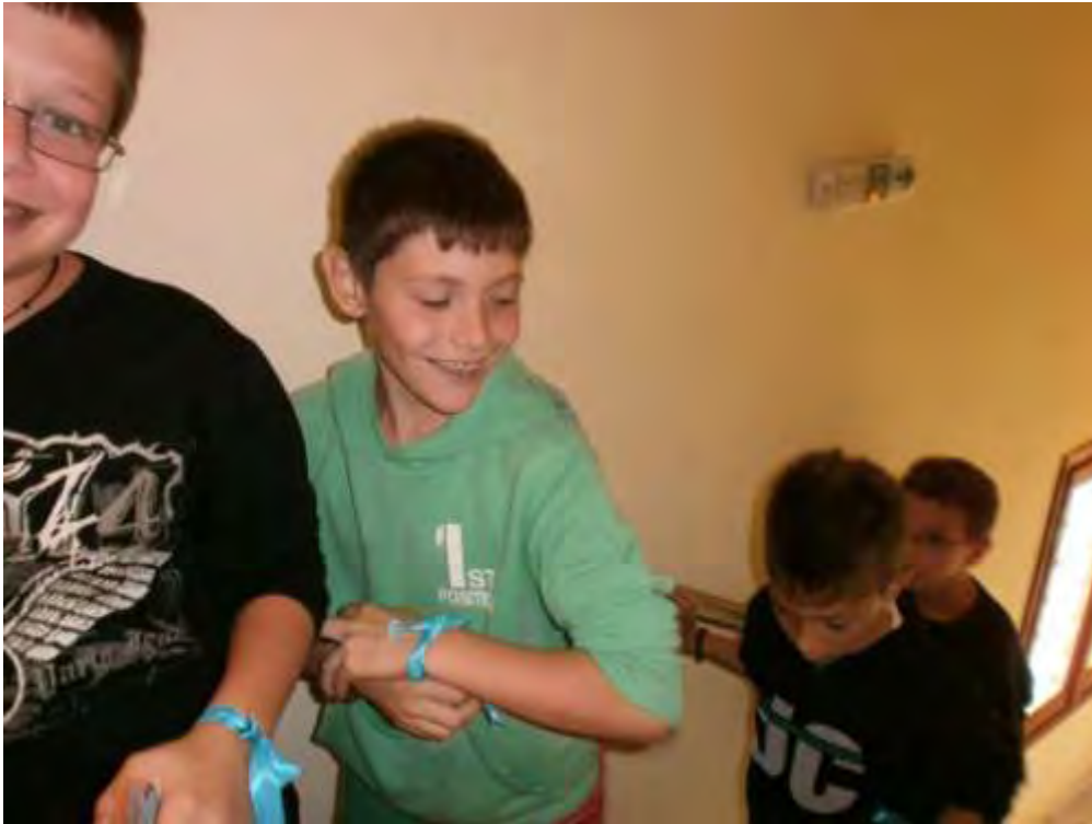
Εικόνα 28: Αναζήτηση στοιχείων στο Μουσείο για την πραγματοποίηση των αποστολών