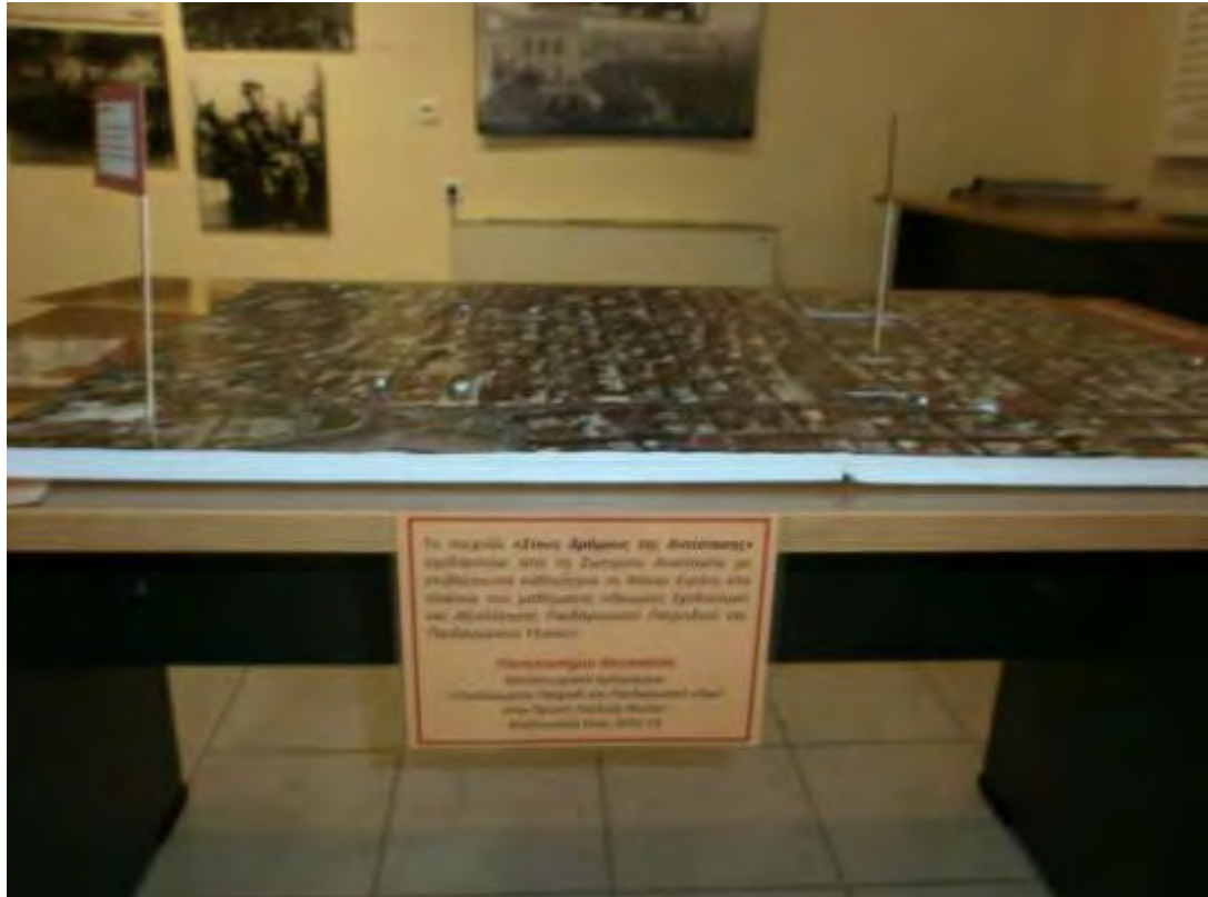
Εικόνα 3: Τοποθέτηση του Παιχνιδιού στο Μουσείο