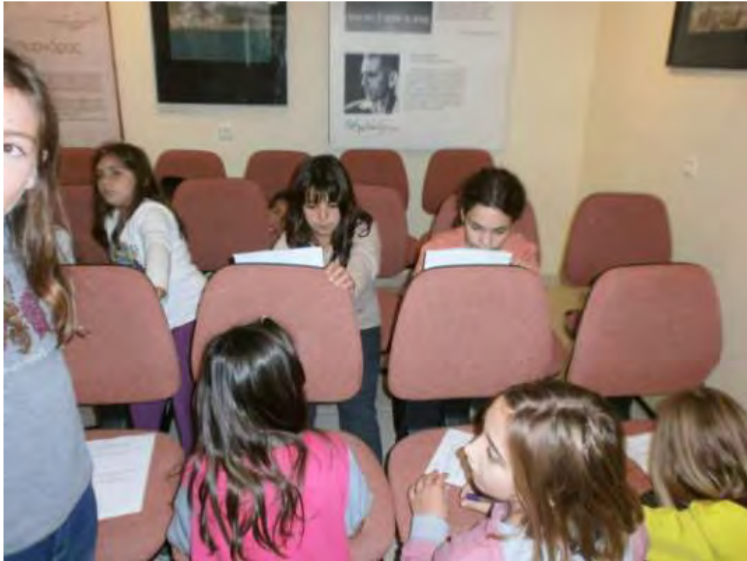
Εικόνα 40: Συμπλήρωση του 2ου μέρους του Ερωτηματολογίου πάνω στις καρέκλες