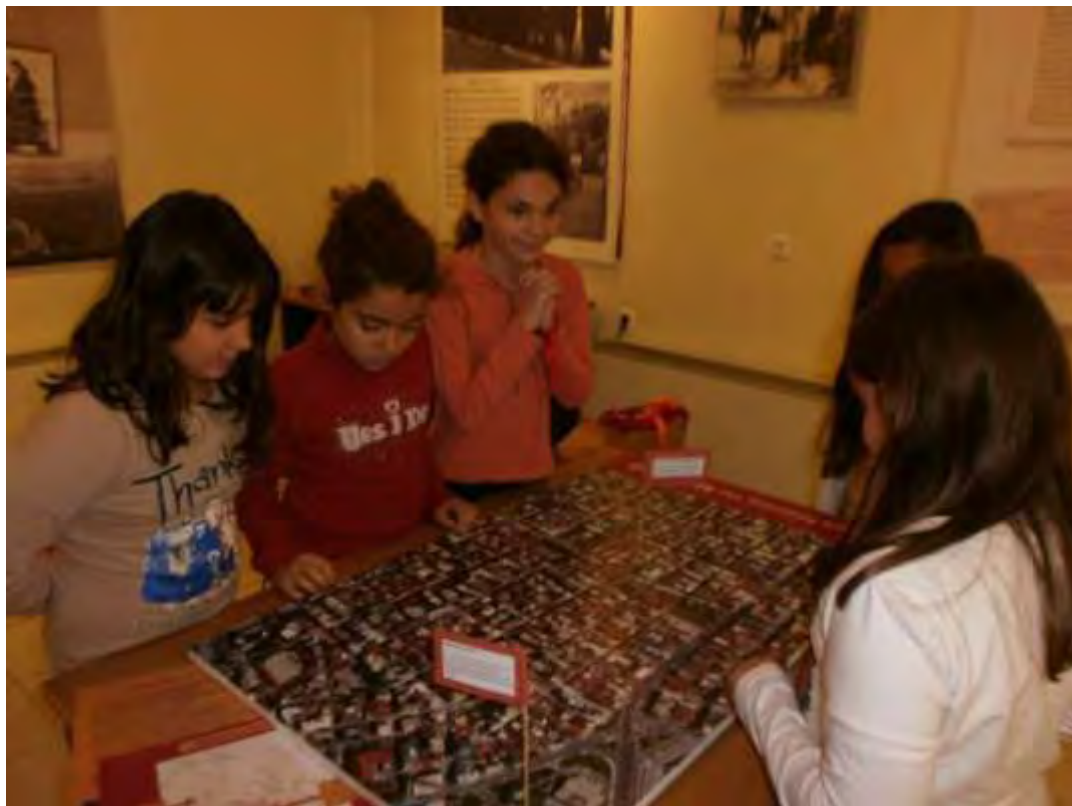
Εικόνα 23: Γνωριμία με το ταμπλό του Παιχνιδιού από ομάδα κοριτσιών