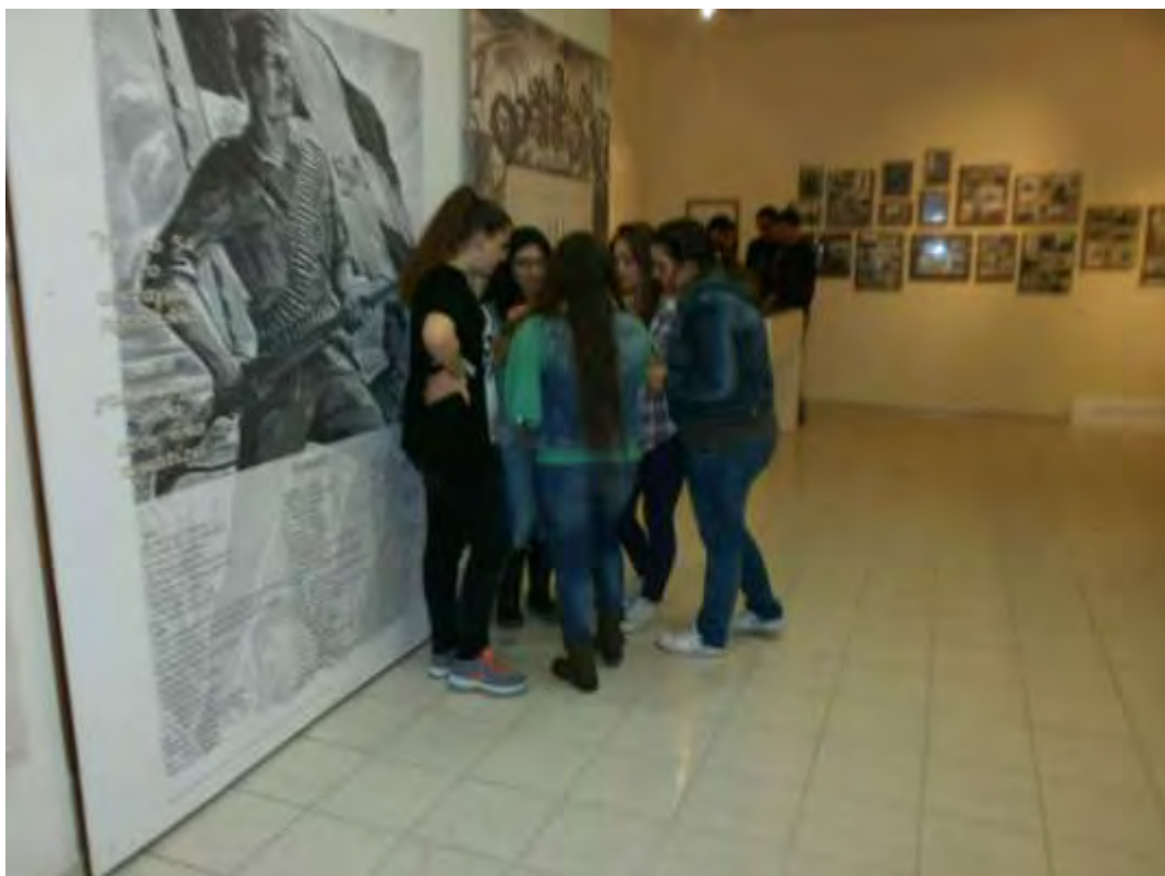
Εικόνα 27: Απομόνωση ομάδων για ανάγνωση των αποστολών