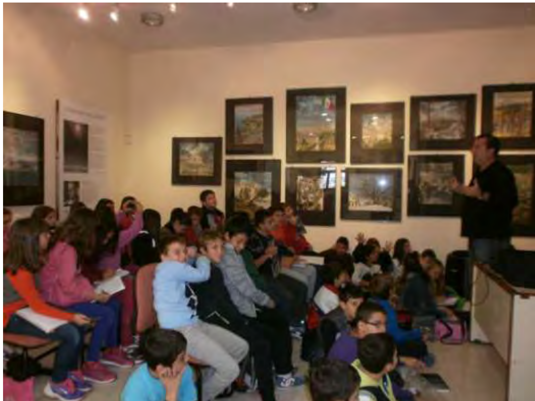
Εικόνα 11: Συζήτηση με ομάδα μαθητών άνω των 20 ατόμων