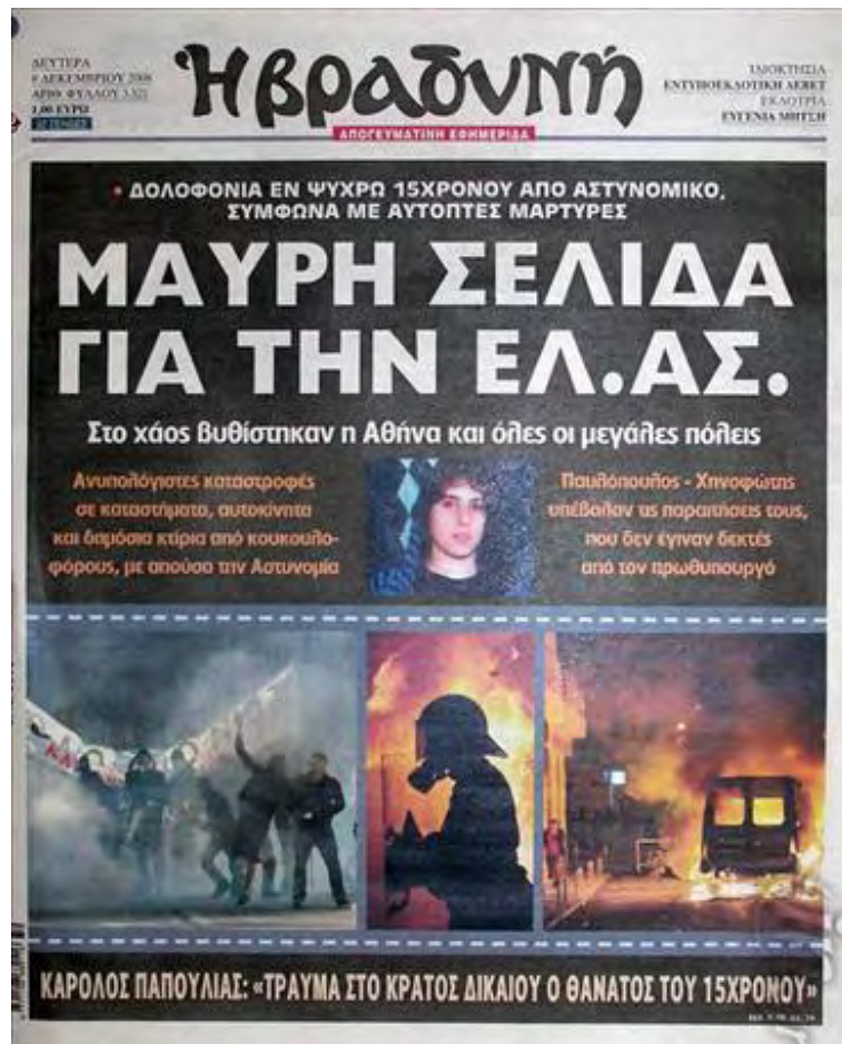
7. Πρωτοσέλιδο της εφημερίδας "Η Βραδυνή" (Δευτέρα, 8 Δεκεμβρίου 2008)