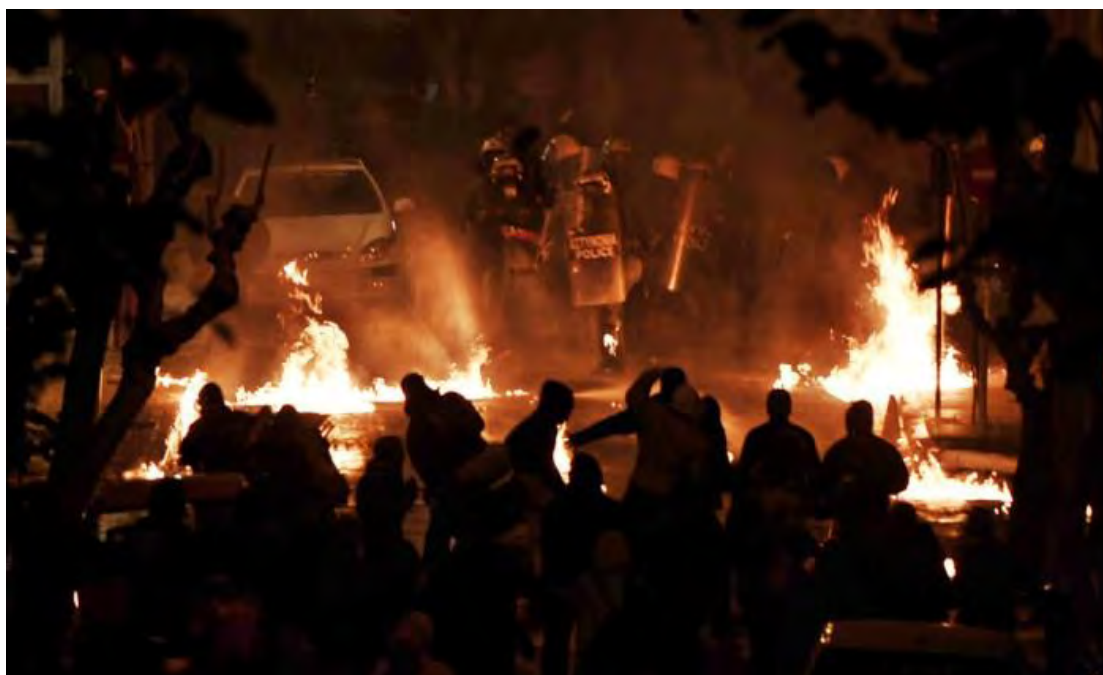
Εικόνα 6: Διαδηλωτές εναντίον ΜΑΤ στο κέντρο της Αθήνας, στις 13 Δεκεμβρίου 2008.