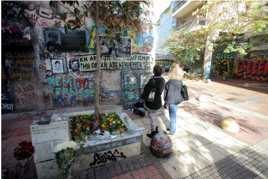
Εικόνα 1. Το μνημείο για τον Αλέξανδρο Γρηγορόπουλο, στη διασταύρωση των οδών Μεσολογίου - Γρηγορόπουλου

Παράλληλα με την επιτόπια εθνογραφία, παρακολούθησα την ειδησεογραφία σχετικά με τις επετείους από τον Δεκέμβρη του 2008 έως αυτόν του 2017, οπτικοακουστικά ντοκουμέντα, δημόσιες τοποθετήσεις και συνθηματικές δηλώσεις στην τηλεόραση και στο διαδίκτυο. Το ψηφιακό κομμάτι της εθνογραφίας διενεργήθηκε ακολουθώντας τα μέσα κοινωνικής δικτύωσης: Facebook, Twitter και YouTube. Παράλληλα αναζήτησα πληθώρα ιστοσελίδων και αφιερωμάτων για τον Αλέξανδρο Γρηγορόπουλο και τον Δεκέμβρη του 2008, που εστίαζαν στην αποτύπωση της μνήμης των «Δεκεμβριανών». Η ψηφιακή και διαδικτυακή μου έρευνα διεξήχθη με τη χρήση λέξεων-κλειδιών τόσο στα μέσα κοινωνικής δικτύωσης όσο και στις μηχανές αναζήτησης. Από όλη την έρευνα, όπως είναι κατανοητό, επιλέχθηκαν συγκεκριμένα αφιερώματα για την οικονομία της εργασίας. Η σημασία και ταυτόχρονα το νόημα των ψηφιακών και διαδικτυακών αναφορών είναι η προβολή ενός