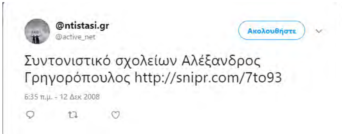
Εικόνα 3: Ενημέρωση από χρήστη/-ρια του Twitter για τις αποφάσεις των σχολείων της Αθήνας σχετικά με τις δράσεις τους και τις κινητοποιήσεις τους στα «Δεκεμβριανά» του 2008.