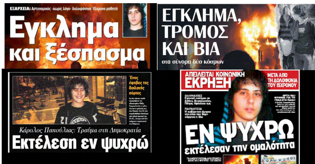
Εικόνα 5: Πρωτοσέλιδα διάφορων εφημερίδων για την εξέγερση του Δεκεμβρίου του 2008 με αφορμή τη δολοφονία του Γρηγορόπουλου ( koxuligd.blogspot.gr/2012/12/6-2012.html )

«βραδιά που κάηκε η Αθήνα», δεν ήταν μονάχα μία βραδιά, ενώ παράλληλα με αυτή τη φράση υπάρχει μία ολόκληρη συλλογή, ένα άλμπουμ από φωτογραφίες, που υπό μορφή προβολής διαφανειών διατρέχει το κεφάλι μας και τις αναμνήσεις μας – σαν να ήμασταν όλοι εκεί, σαν ο καθένας μας να είχε ένα πόστο, είτε αυτό του Μ.Α.Τ.ατζή είτε αυτό του διαδηλωτή με τη μολότοφ ή την πέτρα.