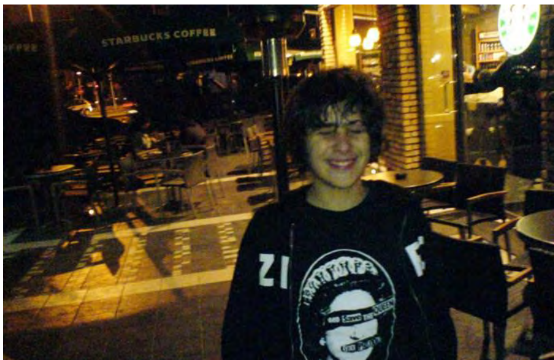
Εικόνα 4: Αχρονολόγητη φωτογραφία του Αλέξανδρου Γρηγορόπουλου

αυτού που η Sturken (1999: 180), παραθέτοντας τον Barthes, αναφέρει ως «οπτικές τεχνολογίες μνήμης». Το άθροισμα (assemblage) των εικόνων που αναφέρονται στη δολοφονία του Γρηγορόπουλου αποτελεί μία γενικότερη φανταστική μνημόνευση τόσο του ίδιου του Αλέξανδρου όσο και των Δεκεμβριανών του 2008. Γι' αυτό μου το συμπέρασμα βασίζομαι στην εθνογραφική μου έρευνα, ψηφιακή και μη, αλλά και στα λόγια της Susan Sontag: