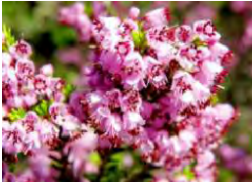
Εικόνα 6: Ερείκη http://evritanikigi.gr

Στην Ελλάδα υπάρχουν τέσσερα φυτά της οικογένειας των Ερεικωδών, από τη νεκταροέκκριση των οποίων παράγονται αντίστοιχοι τύποι μελιού. Η φθινοπωρινή ερείκη γνωστή και ως «σουσούρα» ( Erica vertillata ), η ανοιξιιάτικη ερείκη ( Erica arborea ), η Κουμαριά ( Arbutus unedo ) και το Ροδόδενδρο ( Rhododendron ).