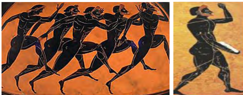
Εικόνα 9 (αριστερά): Δρομείς. Από αμοφρέα του 6ου αι. π.Χ

Οι αθλητικοί αγώνες, όμως, δεν πραγματοποιούνταν για να τιμηθεί μόνο ένας ξένος. Ο Αχιλλέας, ως μέρος των ταφικών τιμών του Πατρόκλου στην Ιλιάδα, διοργανώνει αθλητικούς αγώνες στη μνήμη του, ορίζοντας μάλιστα και πλουσιοπάροχα δώρα για τους νικητές ( Ψ 259 κ.εξ.).