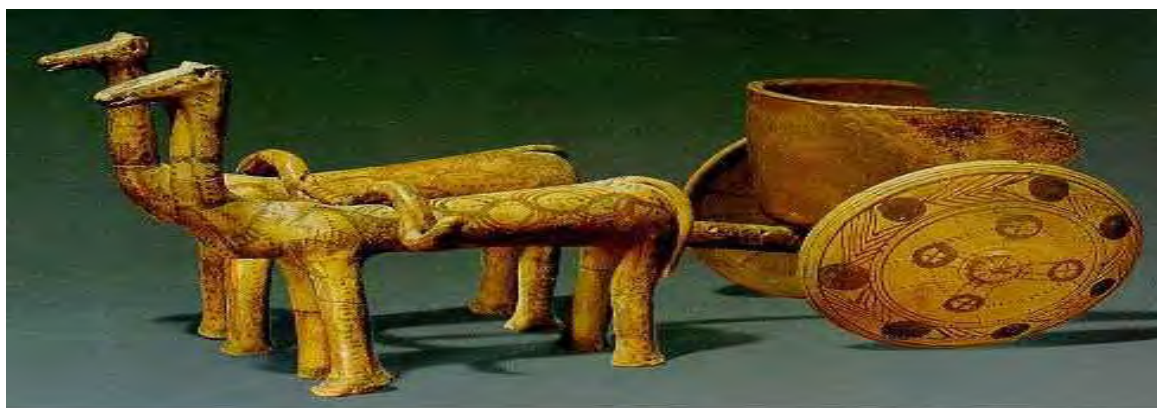
Εικόνα 3: Πήλινο ομοίωμα μυκηναϊκού άρματος

Ένα άρμα, κανονικά, συρόταν από δύο άλογα (εικόνα 3). Τα ευρήματα από σκελετούς αλόγων δείχνουν ότι στην Ελλάδα ήταν γνωστή μια κοντόσωμη ράτσα αλόγου. Στη Σκύρο υπάρχει και σήμερα ένας παρόμοιος τύπος ημιάγριου αλόγου, που θεωρείται απόγονος του μυκηναϊκού (Chadwick, 1997). Σε αυτό το σημείο, πρέπει να επισημανθεί ότι στην περιοχή της ανατολικής Μεσογείου, στο β' μισό της 2 ης χιλιετίας π.Χ., το άλογο μετατράπηκε σε σύμβολο των δύο ουσιωδών δραστηριοτήτων της τάξης των ευγενών, της θήρας και του πολέμου, θέση την οποία προηγουμένως κατείχε το βόδι (Ruiperez & Melena, 1996).