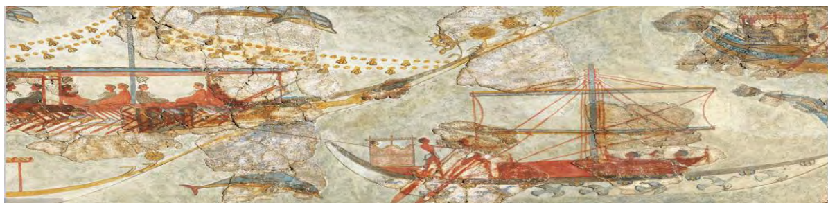
Εικόνα 1: Λεπτομέρεια τοιχογραφίας στολίσκου ιστιοφόρων πλοίων. Ακρωτήρι Θήρας.

Η μεταφορά των εμπορευμάτων πραγματοποιούνταν κυρίως δια θαλάσσης, κάτι πολύ φυσικό για μια χώρα με πολλά παράλια και πολυάριθμα κοντινά νησιά. Άλλωστε, οι δυσχέρειες της διά ξηράς μεταφοράς έθεταν σοβαρούς περιορισμούς στο εμπόριο, καθώς μόνον αντικείμενα μικρού βάρους και μεγάλης αξίας μπορούσαν να προωθηθούν στην ενδοχώρα. Αντίθετα τα πλοία επέτρεπαν φθηνή μεταφορά ογκωδών αντικειμένων (Ruiperez & Melena, 1996). Πολλές σωζόμενες παραστάσεις πλοίων (εικόνα 1) μαρτυρούν ότι, ήδη από τα μέσα της 2ης π.Χ. χιλιετίας, οι Μυκηναίοι γνώριζαν καλά την τέχνη της ναυπηγικής (Τζάλας, 2003). Από την πρώιμη κιόλας μυκηναϊκή περίοδο ναυτικοί και έμποροι όργωναν Δύση και Ανατολή με τα πλοία τους, φτάνοντας στα δυτικά ως τα νησιά Λίπαρι και την νότια Ιταλία και στα ανατολικά ως την Τροία και τη Συρία, την Αίγυπτο και την Παλαιστίνη (Τζαμτζής, 2003).