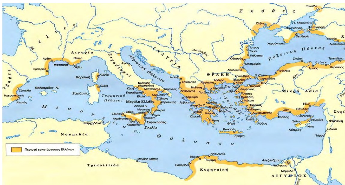
Εικόνα 4:

Μεσόγειου και του Ευξείνου Πόντου, από την Ισπανία ως την Κριμαία και από την Κυανή Ακτή ως την Κυρηναϊκή και την Αίγυπτο (εικόνα 4) (Κακριδής, 2006).