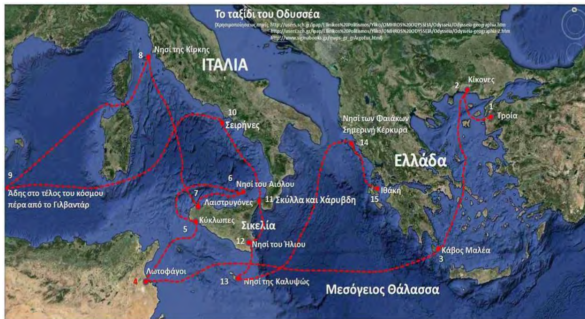
Εικόνα 7: Το ταξίδι επιστροφής του Οδυσσέα.