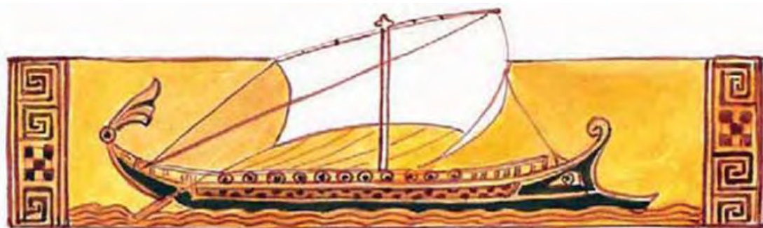
Εικόνα 8: Πλοίο των Αχαιών. Παράσταση από αρχαϊκό αγγείο. Μουσείο Würzburg , Γερμανία (αντίγραφο).

Οι Αχαιοί, καθ' όλη τη διάρκεια της παραμονής τους στην Τροία, χρησιμοποιούσαν τα πλοία ευρέως για τις μετακινήσεις τους (Α 308 – 312) 7 , αλλά και για τον ανεφοδιασμό τους από τις γύρω περιοχές (Ι 70- 72) 8 . Μάλιστα, στην έβδομη ραψωδία (Η 467 – 475) της Ιλιάδας, αναφέρεται ότι ο γιος του Ιάσονα και βασιλιάς της Λήμνου, Εύνηος, προμήθευε τους Αχαιούς με κρασί, ενώ φαίνεται ότι είχαν αναπτυχθεί εμπορικές σχέσεις ανάμεσα στους Αχαιούς και τη Λήμνο