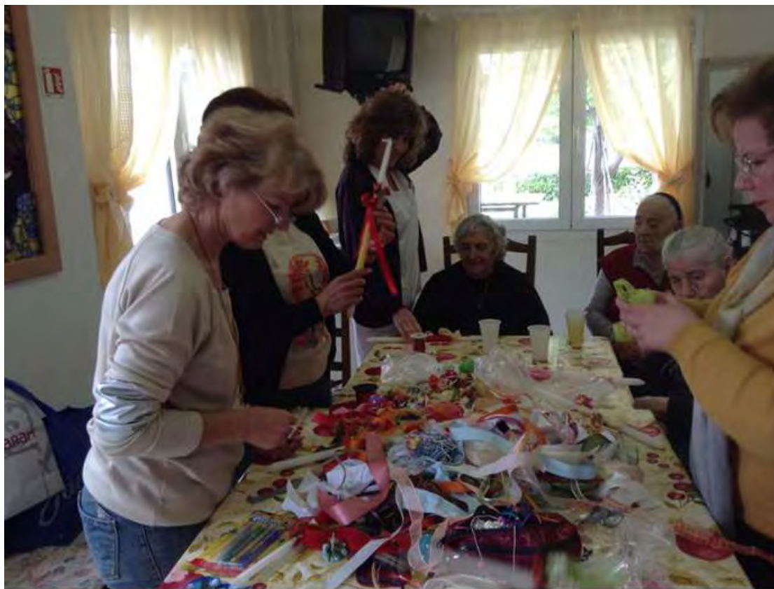
Εικόνα 9. Στολισμός λαμπάδων

Παρατηρείται, λοιπόν, από τη μία πλευρά η πρόθεση του γηροκομείου να διατηρεί τις πόρτες του πάντοτε ανοιχτές στον κόσμο και να δέχεται επισκέψεις που ωφελούν και στηρίζουν ψυχολογικά τους ηλικιωμένους, όπως επισκέψεις φαντάρων, θεατρικών ομάδων που πραγματοποιούν παραστάσεις, συλλόγων και δείπνων που παρατίθενται στον χώρο προς τιμήν κάποιου δωρητή στα οποία συμμετέχουν, ψυχαγωγούνται και κοινωνικοποιούνται οι ηλικιωμένοι.