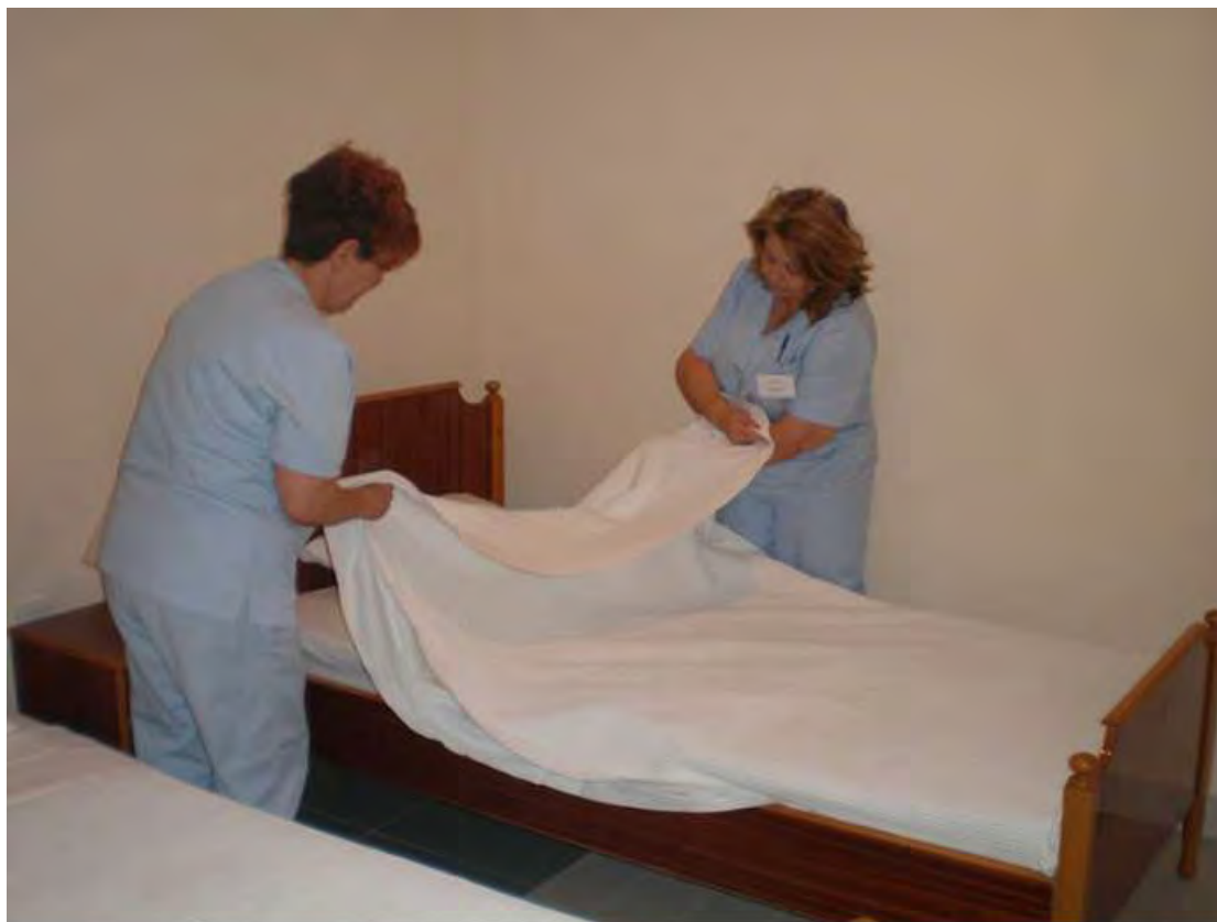
Εικόνα 4. Υπάλληλοι γενικών καθηκόντων

Ο ρόλος του προσωπικού γενικών καθηκόντων είναι καθοριστικός για την εύρυθμη λειτουργία του γηροκομείου και τη διατήρηση της υψηλής ποιότητας των παρεχόμενων υπηρεσιών. Το προσωπικό γενικών καθηκόντων συμβάλλει στην ομαλή λειτουργία του Γηροκομείου, στην καθαριότητα και τη διατήρηση της τάξη αυτού. Είναι υπεύθυνο για την προετοιμασία των δωματίων, την καταμέτρηση ιματισμού του νέου φιλοξενούμενου, την παροχή της σίτισης και την προετοιμασία της τραπεζαρίας (βλ. εικόνα 4). Το προσωπικό βοηθά στην αυτοεξυπηρέτηση των τροφίμων, ιδιαίτερα εκείνων που δυσκολεύονται από μόνοι τους να λάβουν την τροφή τους, λόγω προβλημάτων υγείας και πρέπει να επιδεικνύουν υπομονή, αγάπη ακόμα και με τους πιο δύσκολους οικότροφους. Επιπλέον συμβάλλει στη διαμόρφωση του χώρου για τις διάφορες εκδηλώσεις που μπορεί να λάβουν χώρα, στην ατομική καθαριότητα τροφίμων και την παραλαβή των δωρεών.