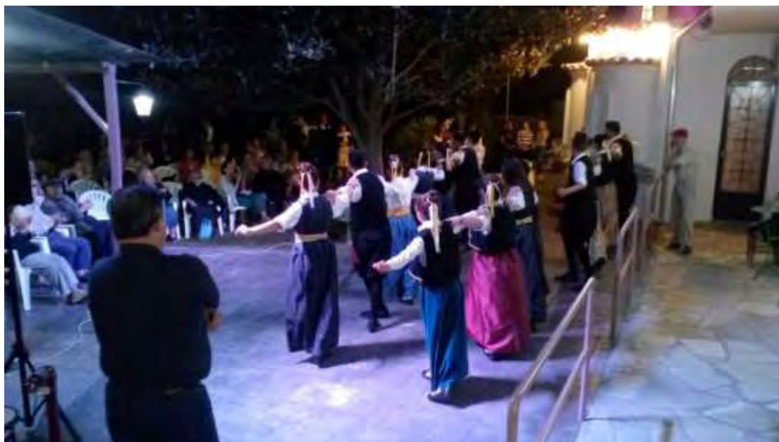
Εικόνα 6. Εκδηλώσεις χορευτικών συλλόγων

Στην παρατήρηση ότι το «Γηροκομείο είναι ένα ίδρυμα που δεν λειτουργεί αποκομμένα από την τοπική κοινωνία του Βόλου», ο διευθυντής προσθέτει τονίζοντας με έμφαση ότι το Γηροκομείο όχι απλώς αποτελεί τμήμα της κοινωνίας, αλλά «ιδιοκτησία των πολιτών». Αποτελεί ένα ζωντανό κύτταρο της τοπικής κοινωνίας, η οποία δείχνει συνεχώς το έμπρακτο ενδιαφέρον της και έχει άμεση σχέση με την οικονομική βιωσιμότητα του γηροκομείου, «καθώς αποτελούν [ενν. οι πολίτες] μία από τις τρεις πηγές εισροών». Κατά τον ίδιο η σύνδεση με τους φιλοξενούμενους είναι μεγάλη ακόμα και μέσα από επισκέψεις αγνώστων, όπως συμβαίνει με διάφορους συλλόγους. Οι εκδηλώσεις και οι επισκέψεις είναι συχνό φαινόμενο για το Γηροκομείο Βόλου (βλ. εικόνα 5).