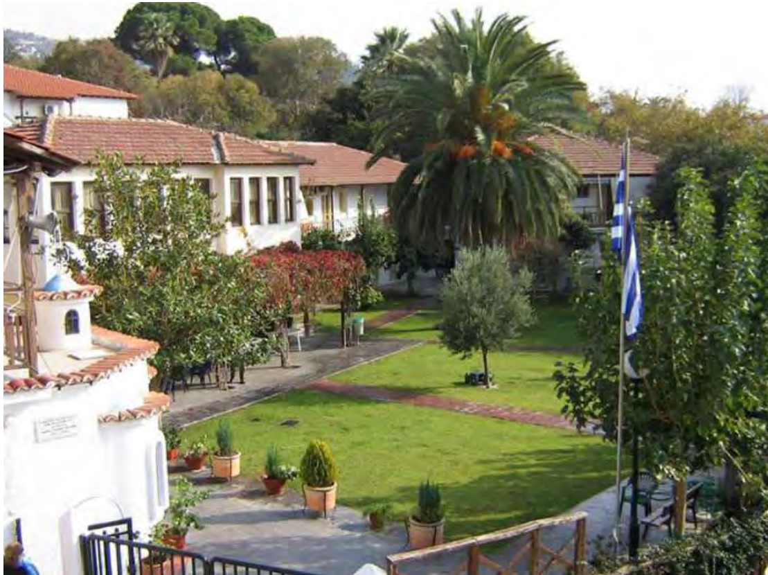
Εικόνα 1. Αποψη του εξωτερικού χώρου του Γηροκομείου Βόλου

Το γηροκομείο αποτελεί έναν χώρο φιλοξενίας και περίθαλψης ηλικιωμένων ανδρών και γυναικών. Στεγάζεται στην περιοχή της Αγίας Παρασκευής Βόλου, στις παρυφές του Πηλίου σε ένα όμορφο φυσικό περιβάλλον (βλ. εικόνα 1). Στις προσφερόμενες υπηρεσίες προς τους ηλικιωμένους συγκαταλέγονται η μόνιμη περίθαλψη και η στέγαση ανθρώπων με κινητικά προβλήματα, αλλά και αυτοεξυπηρετούμενων. Επιπλέον, παρέχει προσωρινή περίθαλψη και στέγαση για χρόνο που θα ζητήσει ο ηλικιωμένος ή το οικείο περιβάλλον του.