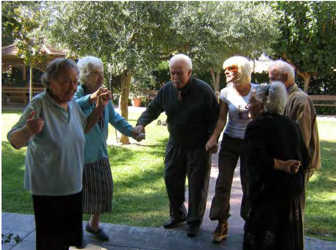
Εικόνα 8. Ψυχαγωγία των ηλικιωμένων

δραστηριότητες, καθώς και επισκέψεις από συλλόγους, σωματεία, παιδιά (βλ. εικόνα 8):