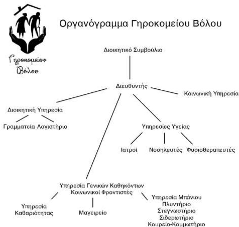
Εικόνα 2. Οργανόγραμμα Γηροκομείου Βόλου

Το γηροκομείο Βόλου στελεγχώνεται από μια ποικιλία ειδικοτήτων με ιδιαίτερη βαρύτητα στο νοσηλευτικό προσωπικό, με 3 προϊστάμενες και 15 βοηθούς. Το προσωπικό συμπληρώνουν 3 φυσικοθεραπευτές, 20 υπάλληλοι γενικών καθηκόντων, 2 κοινωνικοί λειτουργοί και τέσσερις συμβεβλημένοι εξωτερικοί ιατροί (νευρολόγος, παθολόγος, καρδιολόγος και ψυχολόγος). Το διοικητικό προσωπικό αποτελείται από τον διευθυντή, τον λογιστή, τον γραμματέα την διευθύντρια οικονομικών υποθέσεων και τον τεχνικό ασφαλείας. Στις υποενότητες που ακολουθούν αναλύεται ο ρόλος της κάθε ειδικότητας ξεχωριστά. Σχηματικά το οργανόγραμμα του γηροκομείου αποτυπώνεται στην ακόλουθη εικόνα (βλ. εικόνα 2):