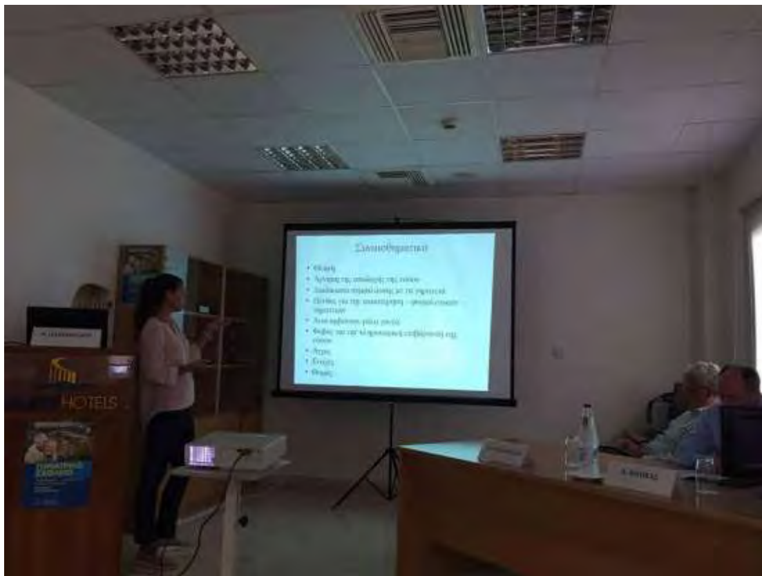
Εικόνα 5. Παρουσίαση του Γηροκομείου Βόλου στο σχολείο Γηριατρικής - Γεροντολογίας, Πόρτο Χέλι, 2017

Η συγκεκριμένη λειτουργός αποτελεί επιπλέον μέλος διεπιστημονικής ομάδας με κοινούς στόχους για την καλή λειτουργία του θεσμού των γηροκομείων. Πρόσφατα, μάλιστα η Κοινωνική Υπηρεσία του «Γηροκομείου Βόλου» παρουσίασε στο σχολείο Γηριατρικής – Γεροντολογίας που έγινε στο Πόρτο Χέλι το θέμα «Πώς οι φροντιστές θα πρέπει να αντιμετωπίζουν τα άτομα που πάσχουν από Alzheimer». Η συμμετοχή, άλλωστε, των κοινωνικών λειτουργών του γηροκομείου Βόλου σε συνέδρια Γεροντολογίας και Γηριατρικής είναι ενεργή ήδη από το 1996.