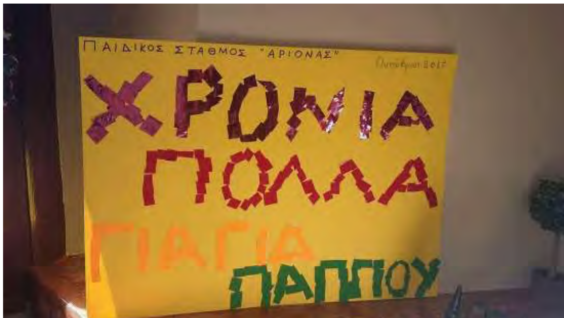
Εικόνα 7. Επίσκεψη του παιδικού σταθμού "Αρίονας"