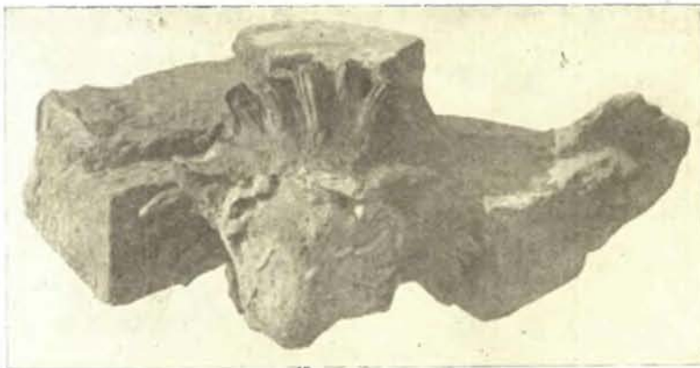
Εἰκ. 5. Πηλίνη ὕδροφορὴ ἐκ τοῦ πρὸς Β τοῦ ναοῦ οἰκοδομήματος.

ὅτι ἡ λατρεία ὑπῆρξεν ἐκεῖ παλαιοτάτη καὶ ἡ συστηματικὴ ἔρευνα τοῦ χώρου θέλει προσφέρει, πιστεύω, ἀξιολογώτερα εὐρήματα καὶ θέλει συμβάλει μεγάλως εἰς τὴν ἔρευναν τῆς παλαιότερας λατρείας τῆς Ἀρτέμιδος. Περισσότερα