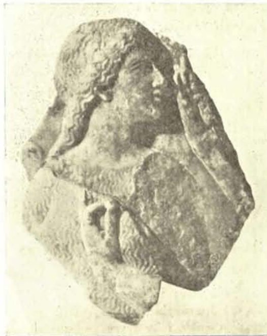
Εἰκ. 7. Ἀνάγλυφον ἡρωίδος.

Κατὰ τὴν ἀνασκαφὴν τοῦ ἀναλήματος εὐρέθησαν ἀρκετὰ γλυπτά, μικρὰ κυρίως μαρμάρινα ἀναθηματικά ἀγαλμάτια κ.λ.π., μεταξὺ δὲ τούτων