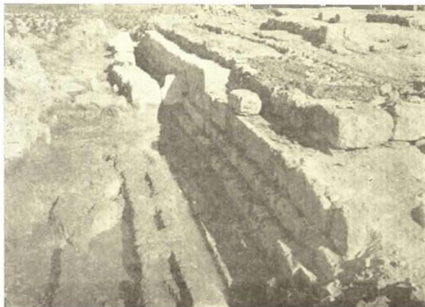
Εἰκ. 3. Τὸ ἀνάλημμα μετὰ τῶν πρὸ αὐτοῦ πορύνων βάσεων.