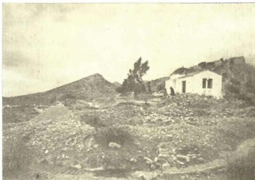
Εἰκ. 2. Γενικὴ ἀποψη κατά τὴν ἐναρξιν τῆς ἀνασκαφῆς.