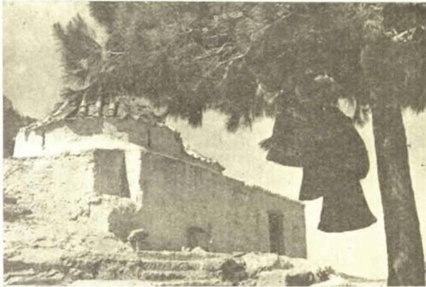
Εἰκ. 4. Ἡ ἐκκλησία τοῦ Ἁγίου Γεωργίου, μετὰ τῆς λαξευτῆς κλίμακος.