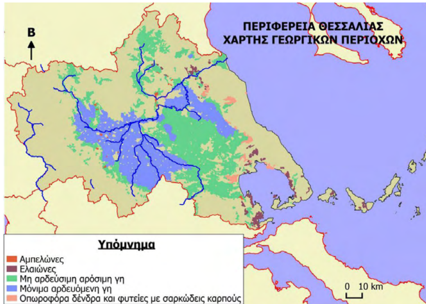
Χάρτης 7: Γεωργικές περιοχές