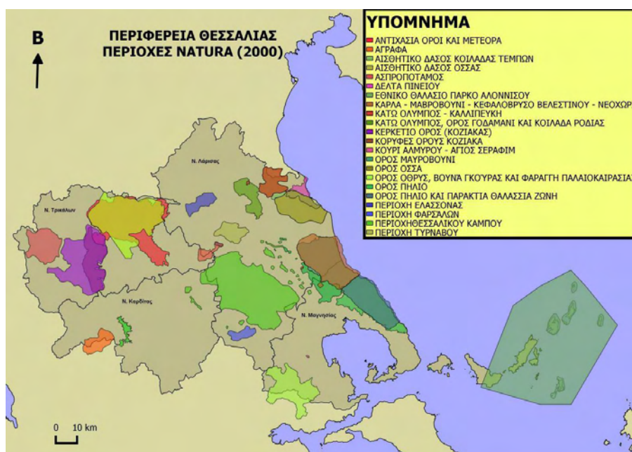
Χάρτης 2: Περιοχές Natura 2000

Η περιφέρεια Θεσσαλίας έχει μεγάλη ποικιλία από χλωρίδα κυρίως στη περιοχή του Κάτω Ολύμπου, έχουν καταγραφεί περίπου 1.000 από τα οποία 45 από αυτά προστατεύονται. Η πανίδα του νομού αποτελείται κυρίως από πτερωτά είδη. Οι προστατευόμενες περιοχές της Θεσσαλίας είναι 14 και καλύπτουν το 16% της συνολικής έκτασης του Γεωγραφικού Διαμερίσματος. Στην περιφέρεια Θεσσαλίας παρατηρείται πληθώρα περιοχών που χρήζουν προστασίας, καθώς έχουν ιδιαίτερη οικολογική και αισθητική αξία. Πολλές από αυτές, αν όχι όλες, είναι ενταγμένες σε ένα θεσμοθετημένο πλαίσιο προστασίας που εξασφαλίζει την διατήρησή τους στο χρόνο. Από αυτές τις προστατευόμενες περιοχές, δύο έχουν εθνική σημασία και εμβέλεια. Πρόκειται για το Εθνικό Θαλάσσιο Πάρκο Αλοννήσου και το Εθνικό Δρυμό Ολύμπου. Υπάρχουν επίσης περιοχές Natura 2000, οι περισσότερες από τις οποίες είναι εκτεταμένες σε έκταση. Μερικές από αυτές είναι η κοιλάδα των Τεμπών, τα δάση της Όσσας, τα πευκοδάση της Σκιάθου, η περιοχή των Μετεώρων καθώς και το νησί Πιπέρι στις Σποράδες. Πιο αναλυτικά, ο νομός Μαγνησίας είναι πρώτος μεταξύ των άλλων νομών με ιδιαίτερα τοπία φυσικού κάλους και περιοχές Natura, ενώ ο νομός Λαρίσης διαθέτει αισθητικά δάση (Μουντρακης, 2010)(Χάρτης 2: Περιοχές Natura 2000).