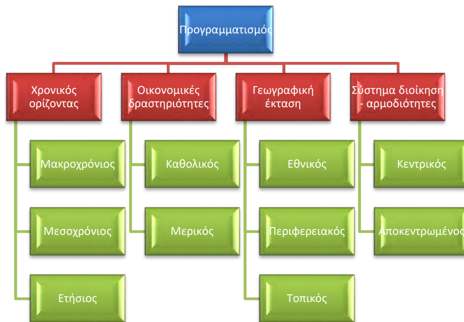
Διάγραμμα: 2: Τοπολογία Προγραμμάτων Ανάπτυξης

Στο σημείο αυτό θα πρέπει να αποσαφηνιστούν δύο όροι που συγχέονται από τους περισσότερους ανθρώπους. Ο ένας είναι ο Περιφερειακός Προγραμματισμός και ο άλλος ο Περιφερειακός Σχεδιασμός. Ο δεύτερος αναφέρεται στη δημιουργία και διαμόρφωση της αναπτυξιακής στρατηγικής και πολιτικής που ακολουθεί κάθε περιφέρεια. Από την άλλη πλευρά, ο Προγραμματισμός αναφέρεται στην εφαρμογή του πρώτου θέτοντας χρονικούς περιορισμούς, σκοπούς, στόχους και άξονες (Παπαδασκαλόπουλος & Χριστοφάκης, 2016).