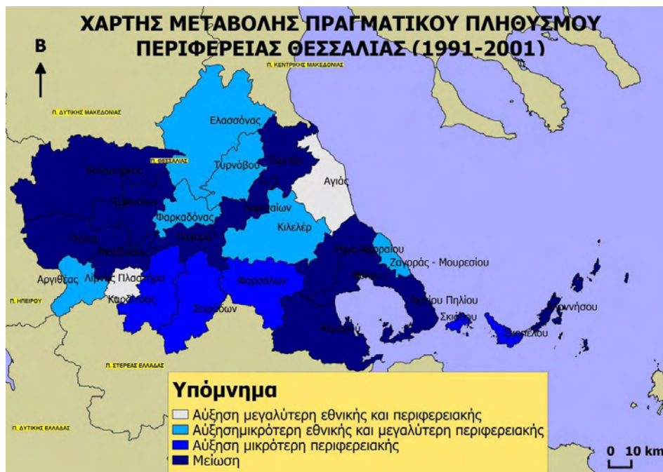
Χάρτης 4: Μεταβολή πληθυσμού 1991-2001

Σύμφωνα με τα αποτελέσματα της τελευταίας απογραφής, η Περιφέρεια Θεσσαλίας, 3η σε σειρά μεγαλύτερη στην Ελλάδα βάσει του πληθυσμού της, αριθμεί πάνω από 732.000 κατοίκους(6,9% του συνόλου της χώρας). Σε επίπεδο Νομού, η Μαγνησία έχει την μεγαλύτερη αύξηση (>4,5%), ενώ ο Ν. Τρικάλων παρουσιάζει έντονο πρόβλημα με σχεδόν μηδενική αύξηση (>0,4% ), ποσοστό σημαντικά μικρότερο από τους Νομούς Λαρίσης και Καρδίτσας. Ο πληθυσμός της Θεσσαλίας θεωρείται γηρασμένος, με οριακές τιμές αντικατάστασης. Η τάση μεταβολής του πληθυσμού στην Περιφέρεια Θεσσαλίας μετά την απογραφή του 2001 και του 2011 είναι πλέον φθίνουσα (ΕΛ. ΣΤΑΤ, 2011)(Χάρτης 4: Μεταβολή πληθυσμού 1991-2001, Χάρτης 5: Μεταβολή πληθυσμού 2001-2011). Όμως, η τάση αυτή για μείωση του πληθυσμού είναι ένα ζήτημα που όπως φαίνεται δεν αφορά μόνο την περιφέρεια Θεσσαλίας, αλλά ολόκληρη της χώρα. Μάλιστα, σύμφωνα με την έρευνα του Πανεπιστημίου Θεσσαλίας και την προβολή πληθυσμού που έλαβε χώρα στα πλαίσια αυτής, το 2050 ο πληθυσμός της Ελλάδας θα έχει μειωθεί σημαντικά. Αξίζει να σημειωθεί πως μείωση του πληθυσμού έχει να σημειωθεί από τον Β' Παγκόσμιο Πόλεμο (ΔιαΝΕΟσις, 2016).