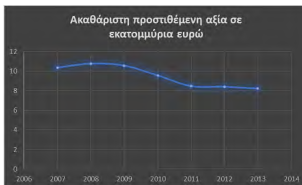
Διάγραμμα: 1: Ακαθάριστη προστιθέμενη αξία σε εκατομμύρια ευρώ