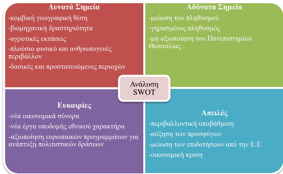
Πίνακας 1: Ανάλυση SWOT

Αυτού του είδους η ανάλυση συμβάλει, στην μείωση και τον περιορισμό της αβεβαιότητας στην εφαρμογή μιας αναπτυξιακής πολιτικής σε μια συγκεκριμένη γεωγραφική περιοχή, στη σύνδεση των αναπτυξιακών χαρακτηριστικών του εσωτερικού αλλά και του εξωτερικού περιβάλλοντος και τέλος, στην καταγραφή των πλεονεκτημάτων και μειονεκτημάτων της που επιδρούν καθοριστικά στην επιτυχία ή όχι ενός στρατηγικού προγράμματος (Κυβέλου , 2009).