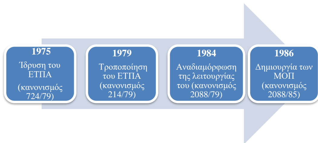
Διάγραμμα 3: Οι κυριότεροι σταθμοί της Κοινοτικής Περιφερειακής Πολιτικής

Στα δέκα χρόνια που ακολούθησαν, δηλαδή από το 1975 έως και το 1986, διαμορφώθηκε η Περιφερειακή Πολιτική με κυριότερους και πιο κομβικούς σταθμούς να είναι: (Διάγραμμα 3: Οι κυριότεροι σταθμοί της Κοινοτικής Περιφερειακής Πολιτικής)