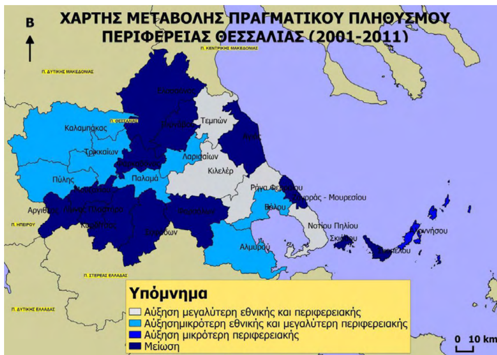
Χάρτης 5: Μεταβολή πληθυσμού 2001-2011