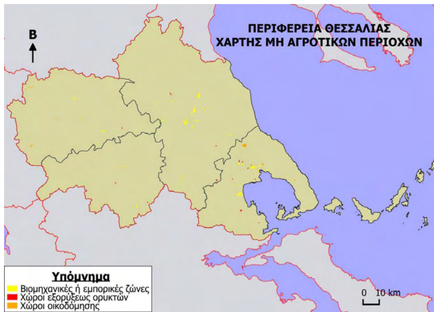
Χάρτης 8: Μη αγροτικές περιοχές