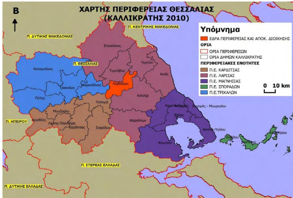
Χάρτης 1: Περιφέρεια Θεσσαλίας