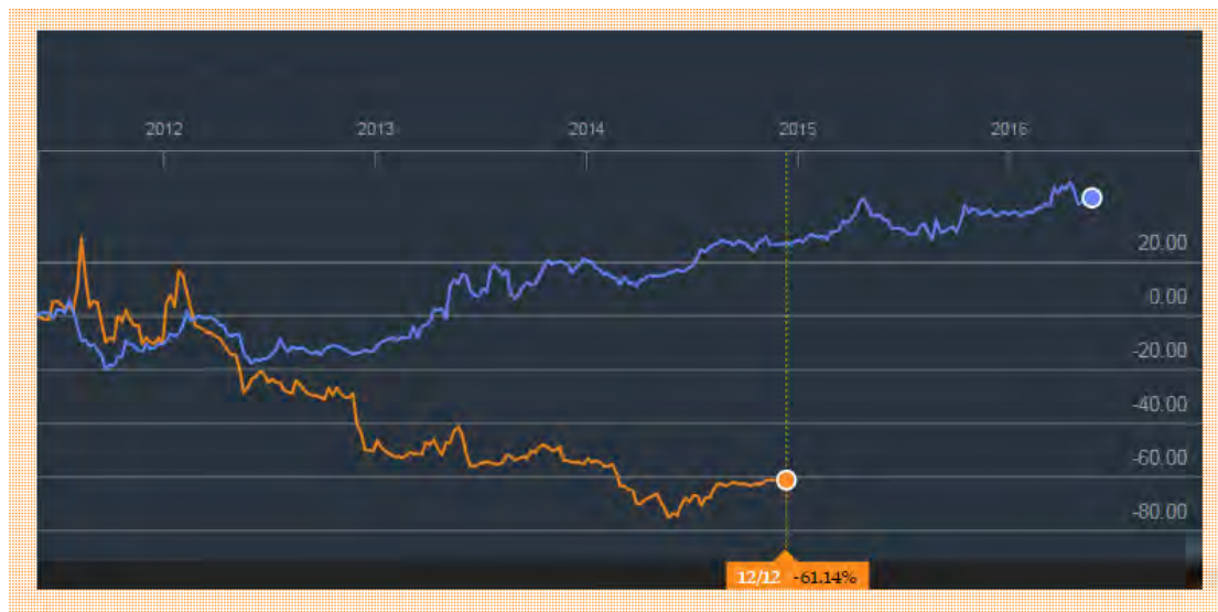
Εικόνα 3: Πορεία μετοχής Malaysia Airlines σε σχέση με τον Γενικό Δείκτη τιμών της Μαλαισίας

Στο σημείο αυτό είναι χρήσιμο να παρουσιάσουμε και την πορεία της τιμής της μετοχής (με πορτοκαλί χρώμα), σε σχέση με το γενικό δείκτη τιμών της Μαλαισίας (με μπλε χρώμα), στην παρακάτω εικόνα.