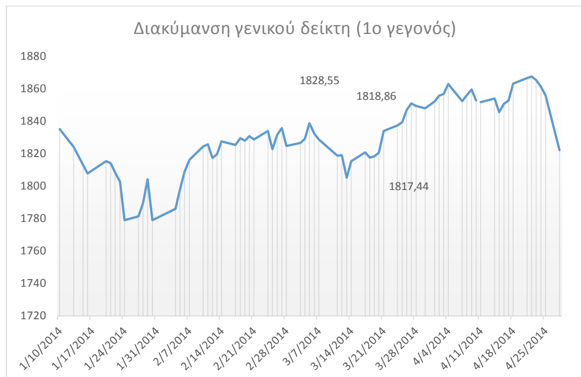
Εικόνα 5 : Διακύμανση γενικού δείκτη τιμών κατά το πρώτο γεγονός

Όπως αναφέραμε, η στατιστική ανάλυση έδειξε ότι υπάρχει συσχέτιση μεταξύ της μεταβολής της τιμής της μετοχής και της μεταβολής του γενικού δείκτη τιμών. Στον παρακάτω πίνακα παρουσιάζεται η πορεία του γενικού δείκτη στο χρηματιστήριο της Μαλαισίας, 36 ημέρες πριν και 36 ημέρες μετά το πρώτο αεροπορικό δυστύχημα στις 8 Μαρτίου 2014.