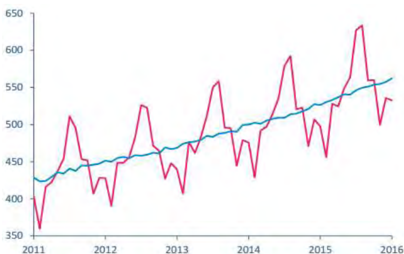
Εικόνα 1: Όγκος αεροπορικών επιβατών (τρεις/μήνα)

Τα τελευταία διαθέσιμα στοιχεία, σχετικά με την επιβατική κίνηση στις αερομεταφορές, δείχνουν τη συνεχή αύξηση του σχετικού ποσοστού, με τον Ιανουάριο του 2016 να έχει κατά 7,1% μεγαλύτερη κίνηση, σε σύγκριση με τον αντίστοιχο μήνα του 2015. Στην παρακάτω εικόνα παρουσιάζεται αναλυτικά η μεταφορική κίνηση επιβατών, με αεροπλάνο, από το 2011 μέχρι και τον Ιανουάριο του 2016.