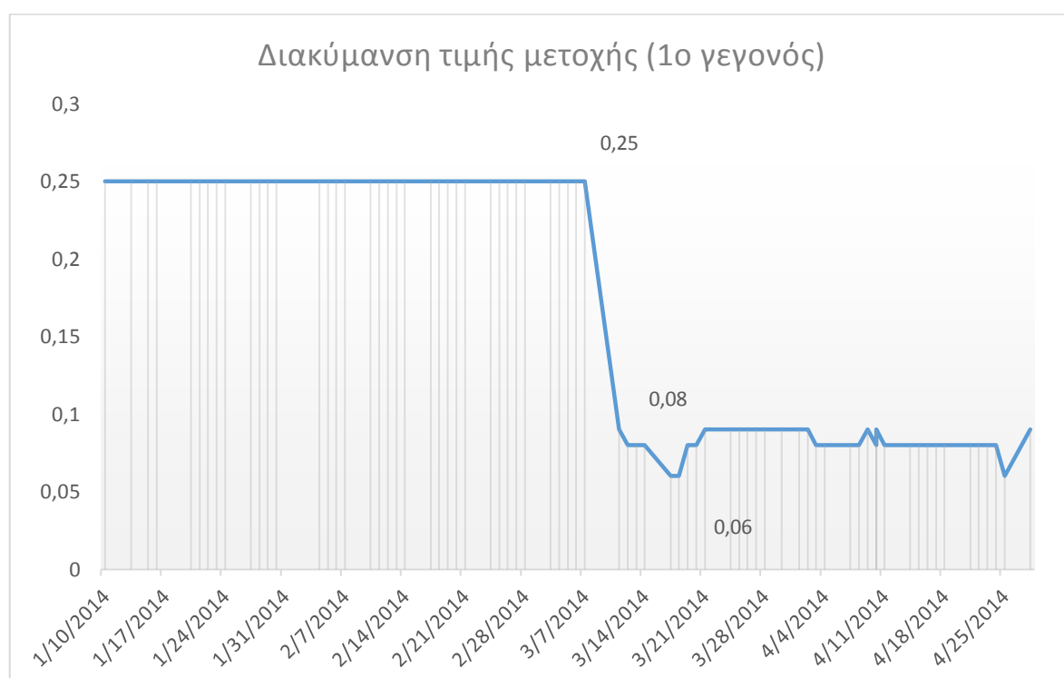
Εικόνα 4 : Διακύμανση τιμής μετοχής κατά το πρώτο γεγονός

Στο παρακάτω διάγραμμα παρουσιάζεται η πορεία της τιμής της μετοχής της Malaysia Airlines, 36 ημέρες πριν και 36 ημέρες μετά το πρώτο αεροπορικό δυστύχημα, στις 8 Μαρτίου 2014.