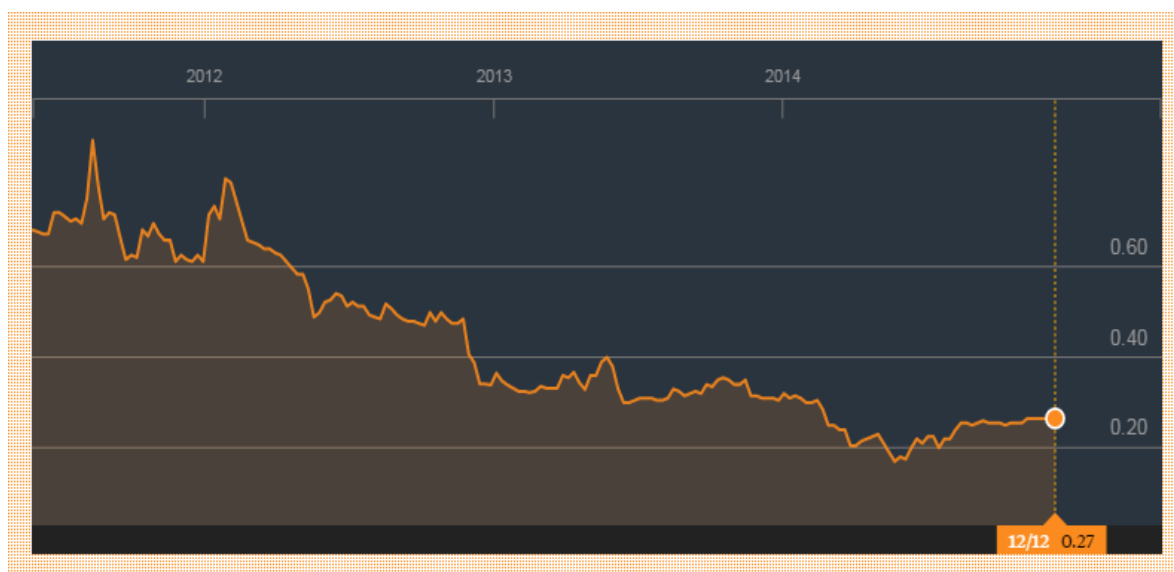
Εικόνα 2: Πορεία μετοχής Malaysia Airlines

Η τιμή της μετοχής της Malaysia Airlines διαπραγματευόταν στο χρηματιστήριο της Κουάλα Λουμπόρ μέχρι και το τέλος του 2014. Η πορεία της μετοχής, από το δεύτερο εξάμηνο του 2011 μέχρι και το τέλος του 2014, παρουσιάζεται στην παρακάτω εικόνα.