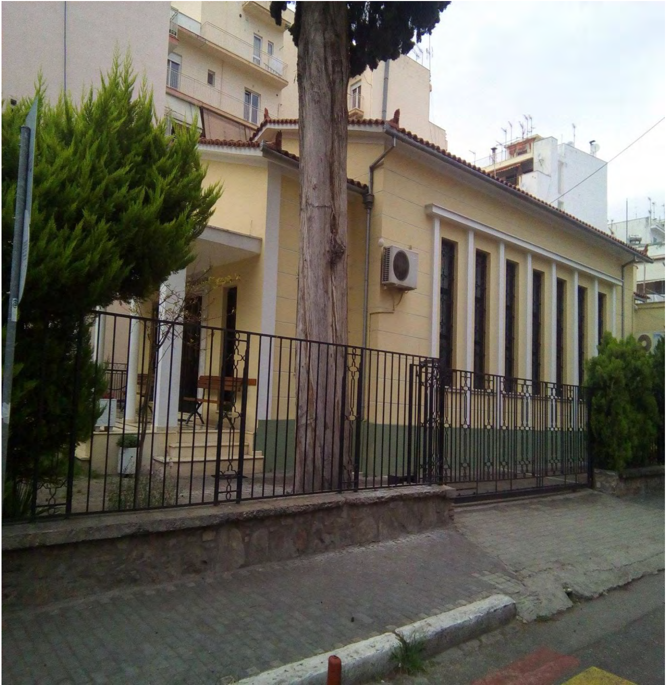
Ευαγγελική Εκκλησία του Βόλου 2017