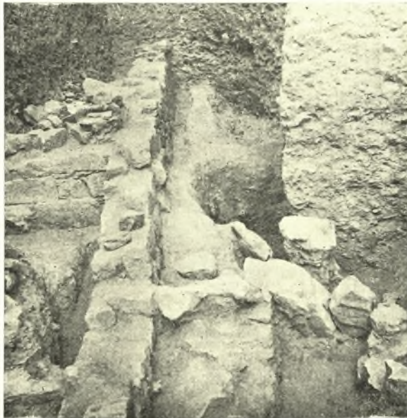
Εἰκ. 3. Ἐρείπια τῶν ἐρειπίων. Ὁ μέγας ἀνατολικὸς τοῖχος Σ καὶ οἱ ἐγκάρσιοι τοῖχοι Β καὶ Γ.