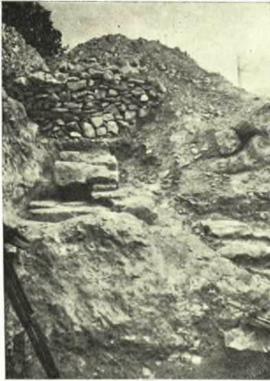
Εἰκ. 12. Τοῖχος ἀνατολικοῦ τμήματος.

Ἡ τοιαύτη καταστροφή, εἰς ἣν οὐκ ὀλίγον συνήργησε καὶ ἡ ἀπὸ τῆς