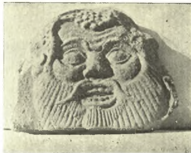
Εἰκ. 18. Ἄκροκέραμος

κέραμοι, εἰς οὓς κατέληγον, ἦσαν κεκοσμημένοι ἐναλλάξ διὰ προτομῶν Σιληνῶν καὶ δι' ἀνθεμίων. Τὸ μέγα πλῆθος τούτων εὐρέθη νοτιῶς καὶ ἀνατολικῶς τοῦ οἰκοδομήματος. Ἡ προτομὴ τοῦ Σιληνοῦ, τὴν ὁποίαν ἀπεικονίζω (εἰκ. 18) ἀνευρέθη μετ' ἄλλων ὁμοίων πρὸς ἀνατολὰς καὶ πλησίον τοῦ τοίχου Σ. Νομίζω ὅτι ἤδη ἀπὸ τοῦδε δυνάμεθα νὰ ἀποδώσωμεν ἴσως τὴν κεράμωσιν ταύτην εἰς τὸ μεγαλύτερον τοῦτο οἰκοδόμημα καὶ νὰ τάξωμεν αὐτὸ εἰς τὸ 2 ον ἡμισυ τοῦ 6 ου π.Χ. αἰῶνος, τοὺς χρόνους δηλαδὴ τοὺς ὁποίους μᾶς δίδει ἡ προτομὴ τοῦ Σιληνοῦ. Ἡ χρονολογία αὕτη συμβιβαζομένη ἀπολύτως πρὸς τὴν τοιχοδομίαν ἐνισχύεται καὶ ὑπὸ μιᾶς ἄλλης παρατηρήσεως : εἰς τὴν γωνίαν μεταξὺ τῶν τοίχων Β καὶ Σ, ἔνθα τὸ φυσικὸν ἔδαφος εἶχεν ἀνασκαφῆ διὰ τὴν θεμελίωσιν τῶν δύο τούτων τοίχων (εἰκ. 6), συνέλεξα ὄλον τὸ ὑπάρχον χῶμα μετὰ τῶν ἐν αὐτῷ ὑπαρχόντων ὀλίγων ὄστρακων, τὰ ὁποῖα προφανῶς ἦσαν παλαιότερα τοῦ οἰκοδομήματος· ἦσαν δὲ ταῦτα τεμάχια ἐκ μεγάλων πίθων τοῦ 7 ου αἰ. καὶ ἐν μόνον μελαμβαφῆς μικρὸν ὄστρακον — τὸ νεώτατον πάντων, οὐχὶ ἀπολύτως χρονολογίσιμον ἀλλὰ δυνάμενον νὰ ἀνήκῃ εἰς μελανόμορφον ἄγγειον.