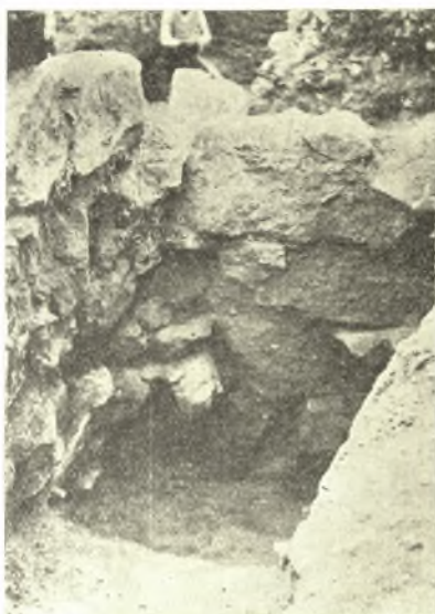
Εἰκ. 6. Ἡ ἐσωτερικὴ ὄψις τῆς γωνίας τῶν τοίχων Β καὶ Σ.