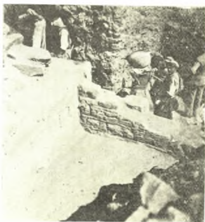
Εἰκ. 7. Ὁ τοίχος Β καὶ ἡ μετὰ τοῦτον προέκτασις τοῦ τοίχου Σ.

μέχρι μεγάλων λίθων γρανίτου, τῶν ὁποίων αἱ ἀκμαί, οὐχὶ κανονικοῦ σχήματος δὲν ἐφάπτονται ἀμέσως πρὸς τὰς τῶν γειτονικῶν λίθων ἀλλ' ἀφήνουν κενὰ πληρούμενα συνήθως δι' ἐπαλλήλων κανονικῶν πλακιδίων ἢ καὶ ἀκανονίστων μικρῶν λίθων.