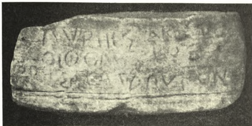
Εἰκ. 19. Ἀρχαϊκὴ ἔπιγραφὴ.

Πυρῆς Ἀκήστο- οἰφόλης ρος (ἤ)θηρησα, καταπύγων.