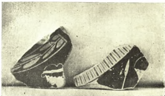
Εἰκ. 14. Ἐρυθρόμορφα ὄστρακα.

Ἐκ τοῦ λαιμοῦ μεγάλου πίθου προέρχεται τὸ θραῦσμα τὸ κοσμούμενον διὰ τοῦ γνωστοῦ θέματος τοῦ «δένδρου τῆς ζωῆς» μὲ ἀναρριχώμενον αἶγαρον (;) ἑκατέρωθεν (εἰκ. 16). Τὴν συγχὴν ἐμφάνισιν τοῦ θέματος ἐν τῇ πρωίμῳ τέχνῃ τῶν Κυκλάδων ἐσημείωσα ἤδη ἐν τῇ Ἀρχ. Ἐφημ. 1945-47