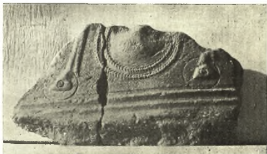
Εἰκ. 15. Θραῦσμα ἀναγλύφου πίθου μὲ τὴν παράστασιν δουρείου ἵππου.