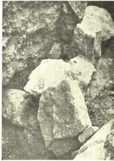
Εἰκ. 11. Μεγάλοι λίθοι ἀνατολικῶς τοῦ τοίχου Σ.