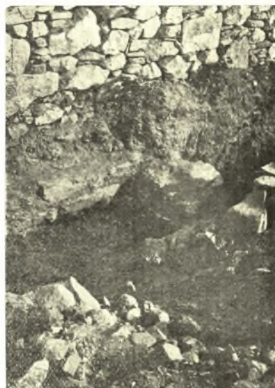
Εἰκ. 8. Ὁ τοίχος Γ καὶ ἡ μετὰ τοῦτον προέκτασις τοῦ τοίχου Σ.

μέχρι μεγάλων λίθων γρανίτου, τῶν ὁποίων αἱ ἀκμαί, οὐχὶ κανονικοῦ σχήματος δὲν ἐφάπτονται ἀμέσως πρὸς τὰς τῶν γειτονικῶν λίθων ἀλλ' ἀφήνουν κενὰ πληρούμενα συνήθως δι' ἐπαλλήλων κανονικῶν πλακιδίων ἢ καὶ ἀκανονίστων μικρῶν λίθων.