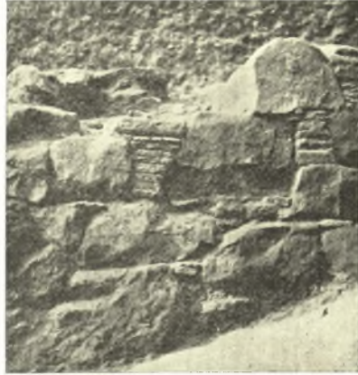
Εἰκ. 10. Τμήμα τοῦ τοίχου Σ.

Ὁ τοῖχος οὗτος (εἰκ. 12) ἀνασκαφείς εἰς μῆκος 2 μόνον μέτρων ἀπὸ τοῦ δυτικοῦ του τέρματος θεμελιωμένος ἐπίσης ἐπὶ τοῦ φυσικοῦ βράχου σφίζεται εἰς μικρὸν ὕψος (0,35 μ.) καὶ εἶναι ἐκτισμένος ἐκ γρανίτου καὶ σχιστολίθου. Ἰδιαιτέρως ἐνδιαφέρον ὅμως εἶναι ὅτι ἡ δυτικὴ του ἀπόληξις εἶναι εὐρυτέρα ἢ ὁ υπόλοιπος τοῖχος. Ἡ δυτικὴ αὕτη ὄψις ἔχει πλάτος 1,25 μ., τὸ ὁποῖον συνεχῶς ἐλαττούμενον βορείως μὲν μετὰ 1,60 μ., νοτίως δὲ μετὰ 0,65 μ. φθάνει εἰς τὸ πλάτος τῶν 0,65 μ. ὅπερ ἔχει ὁ υπόλοιπος τοῖχος. Εἶναι πιθανὸν ὅτι πρόκειται περὶ τοίχου καταλήγοντος εἰς παραστάδα, δι' ἣν ὑπάρχει ἡ εὐρυτέρα αὕτη θεμελίωσις. Νοτίως καὶ εἰς τὴν αὐτὴν γραμμὴν πρὸς τὴν ὑποτιθεμένην παραστάδα ὑπάρχει μικρὰ ἀνεξάρτητος θεμελίωσις μήκους 1,15 μ. καὶ πλ. 0,70 μ., σφζομένη δ' εἰς ὕψος μόνον 0,20 μ. κατὰ τὸ τέρμα τῆς Α πλευρᾶς ταύτης ὑπάρχει μικρὰ κατακόρυφος πλάξ σχίστου (εἰκ. 13). Πρόκειται ἄρα γε περὶ τῆς θεμελιώσεως τοῦ ἐτέρου τῶν στηριγμάτων, τὰ ὁποῖα ὑπῆρχον μετὰ τῶν εἰς παραστάδας ἀπολήξεων τῶν δύο μακρῶν τοίχων; Τὸ μετὰ τῆς παραστάδος τοῦ τοίχου καὶ τῆς ἰδιαιτέρας ταύτης θεμελιώσεως ἄνοιγμα εἶναι 0,90 μ., ἀλλὰ βεβαίως ἐνταῦθα πρόκειται μόνον περὶ τῶν θεμελίων καὶ ἐπομέ-