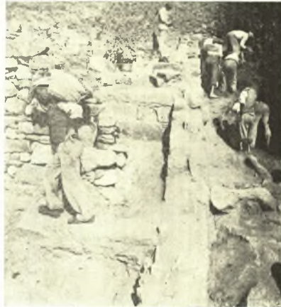
Εἰκ. 4. Ὁ τοῖχος Σ καὶ οἱ δύο ἐγκάρσιοι τοῖχοι Β καὶ Γ.

Ἡ νοτία ὄψις τοῦ τοίχου Β καὶ ἡ συνέχεια τοῦ ἀνατολικοῦ τοίχου Σ (εἰκ. 7) περιορίζουν τὸ δεύτερον, νοτιώτερον διαμέρισμα τοῦ οἰκοδομήματος, τοῦ ὁποίου τὸ δάπεδον ἦτο χαμηλότερον τοῦλάχιστον κατὰ 1,20 μ. τοῦ βορειοτέρου, ἦτοι ὅσον εἶναι τὸ ὕψος τοῦ τοίχου Β. Εἰς ἀπόστασιν 4,50 μέτρων ἀπὸ τοῦ τοίχου Β ὑπάρχει ὁ τοῖχος Γ (εἰκ. 8) ἐκ τοῦ ὁποίου σφίζονται μία ἢ δύο σειραὶ ἐκ κυανοπρασίνων λίθων σχίστου, σφριζομένου πάχους 0,60 μ. καὶ μήκους 1,66 μ. Ἡ μετὰ τοῦτον ἐπὶ 2 ἀκόμη μέτρα ἀνασκαφεῖσα προέκτασις τοῦ τοίχου Σ, (Σ') ἀκολουθοῦσα πάντοτε τὴν κατωφέρειαν, παρουσιάζει ἐσωτερικῶς ἀνώμαλον ὄψιν πρᾶγμα ὕπερ ἀποδεικνύει ὅτι τὸ νοτιώτατον τοῦτο, ὑπὸ τῶν τοίχων Γ καὶ Σ'' περιεχόμενον διαμέρισμα δι' ἐπιχώσεως ἐφθάνεν εἰς τὸ ὕψος τοῦ δαπέδου τοῦ πρὸ αὐτοῦ χώρου ἀποτελουμένου ἐκ τοῦ φυσικοῦ ἐδάφους. Τοῦτο εἶναι φανερόν καὶ ἐκ τῆς διαφόρου κατασκευῆς τῶν τοίχων Β καὶ Γ. Ὁ τελευταῖος οὗτος πιθανώτατα ἦτο διαχωριστικὸς τοῖχος δευτερευούσης μᾶλλον σημασίας.