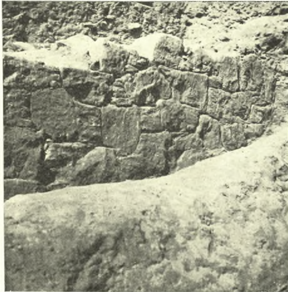
Εἰκ. 9. Τὸ βόρειον τμήμα τοῦ τοίχου Σ.

Εἰς τὴν αὐτὴν περιοχὴν, ἀνατολικῶς δηλ. τοῦ νοτίου πέρατος τοῦ τοίχου Σ, εὐρέθησαν κείμενοι ἀρκετοὶ μεγάλοι λίθοι γρανίτου ἀδρομερῶς εἰργασμένοι, τινὲς τῶν ὁποίων παρέχουν τὴν ἐντύπωσιν μόνον ὅτι ἀποτελοῦν ὑπόλειμμα καμπύλου τοίχου ( εἰκ. 3 καὶ 11 ). Θεωρῶ ὅμως πιθανώτερον ὅτι πρό-