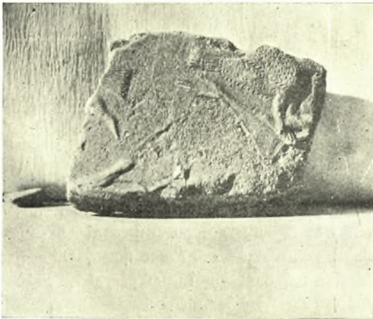
Εἰκ. 17. Ὅμοιον θραῦσμα.

βαίως τὸν τερατισμὸν τῆς ἀνασκαφῆς. Ἀπεικονίζω μόνον ἑνταῦθα καὶ τρίτον θραῦσμα ἐκ διακόσμου ζώνης ὁμοίου πίθου παριστώσης ἄνδρα γυμνὸν ἐξηπλωμένον καὶ κρατοῦντα πτηνὸν ἐπὶ τῆς τεταμένης δεξιᾶς· δεύτερον πτηνὸν φεύγει πρὸς τὰ ἀριστερὰ (εἰκ. 17). Ἡ μορφή αὕτη δὲν ἦτο βεβαίως μεμονωμένη. Ἡ ἐρμηνεία δὲν εἶναι προφανής. Δισταάζω νὰ δεχθῶ ὅτι πρόκειται περὶ Προμηθέως ἢ Διὸς μετὰ τὸν αἰετὸν, διότι ἐκτὸς τοῦ πτηνοῦ οὐδὲν ἄλλο συνηγορεῖ ὑπὲρ τῆς τοιαύτης ἐρμηνείας — ἀντιθέτως ἔχει τις μᾶλλον τὴν ἐντύπωσιν ὅτι πρόκειται περὶ παραστάσεως ἀναγομένης εἰς τὸν ἀνθρώπινον βίον, ἀγνώστου ὁπωσδήποτε μέχρι σήμερον ἐκ τῆς τέχνης τῶν χρόνων ἐκείνων.