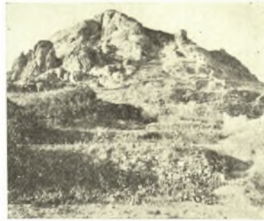
Εἰκ. 1. Ὁ λόφος τοῦ «Ἐώμπουργου».

Τοῦ μεγαλύτερου ἐκ τούτων, τοῦ δυτικωτέρου, παρηκολουθήθη εἰς ἔκτασιν 15,25 μ. ὁ ἀνατολικὸς τοῖχος, ὁ ὁποῖος ἐκτείνεται ἀπὸ Β πρὸς Ν ἀκολουθῶν ἀκριβῶς τὴν κλίσιν τοῦ λόφου (εἰκ. 2-3). Ὁ ἔνεκα τῆς καλλιεργείας σχηματισμὸς τῆς ὅλης ἀνωφερείας εἰς ἰσοπέδους ἀγροὺς δι' ἀναλημματικῶν