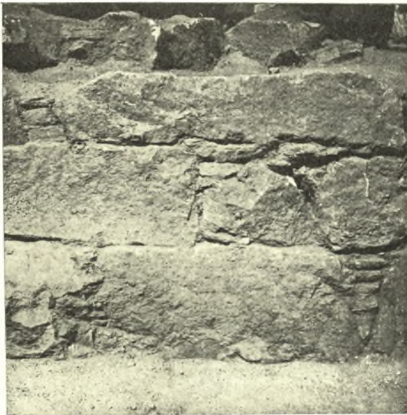
Εἰκ. 5. Ὁ τοῖχος Β.

Οὕτω τὸ οἰκοδόμημα τοῦτο, τοῦ ὁποίου γνωρίζομεν τὴν ἀνατολικὴν πλευρὰν καὶ ἐν μέρει τὴν ἐσωτερικὴν διαίρεσιν λόγῳ τῆς ἐπὶ τοῦ ἀνωφεροῦς ἐδάφους ὑπάρξεως αὐτοῦ διαίρεται εἰς δύο τοῦλάχιστον χώρους ἐκ τῶν ὁποίων ὁ βορειότερος κεῖται ἐπὶ δαπέδου ὑψηλοτέρου τοῦλάχιστον κατὰ 1,20 μ. Ἐπὶ τοῦ τοίχου Β καθέτως ὑπάρχει εἰς μικρὸς τοῖχος καὶ οὗτος οὐχὶ ἐντελῶς ἀνασκαφείς (τοῖχος Δ), ἔχων ὄψιν ὁμαλὴν μόνον κατὰ τὴν ἀνατολικὴν