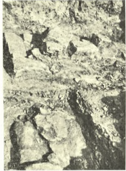
Εἰκ. 13. Τοῖχος τοῦ ἀνατολικοῦ τμήματος μετὰ τῆς νοτίως αὐτοῦ θεμελιώσεως.

ἀρχαιότητος καλλιέργεια τῆς περιοχῆς, ἐπέφερε καὶ τὴν μεῖξιν τῶν κινητῶν εὐρημάτων.