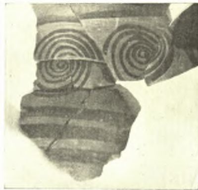
Εἰκ. 14. Μυκηναϊκὰ ὄστρακα ἐκ Νάξου.

Ἡ παρὰ τὴν θάλασσαν ὑπαρξὶς αὐτοῦ καὶ οὐχὶ ἢ ἐπὶ τῆς Ἀκροπόλεως βεβαίως δὲν ἐκπλήσσει. Ὁ συνοικισμὸς τῆς Φυλακωπῆς εἶναι παρὰ τὴν θάλασσαν ἐπίσης, καθὼς καὶ οἱ πλεῖστοι τῶν κυκλαδικῶν συνοικισμῶν, κυρίως δὲ θὰ ἠθέλον νὰ ἐξάρῳ τὴν ἀνάλογον ὑπαρξὶν τοῦ προϊστορικοῦ συνοικισμοῦ παρὰ