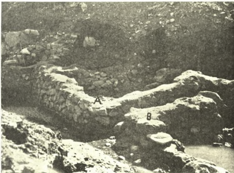
Εἰκ. 5. Αἱ οἰκίαι Α καὶ Β χωριζόμεναι διὰ στενοῦ διαδρόμου.