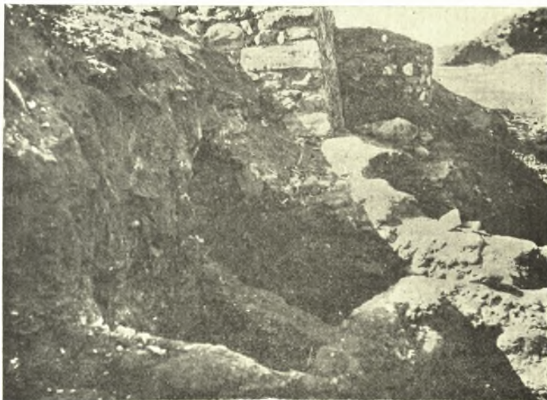
Εἰκ. 7. Ὁ ἐπὶ τῶν οἰκιῶν Α καὶ Β νεώτερος τοῖχος.

Ὅπισθεν τοῦ ὀρθογωνίου τούτου διαμερίσματος ὑπάρχει δεύτερον ἔχον ἀπεστρογγυλωμένας τὰς γωνίας καὶ ἐλαφρῶς καμπύλους τοὺς τοίχους. Ἄλλὰ