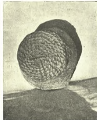
Εἰκ. 13. Πυθμὴν προϊστορικοῦ ἀγγείου ἔχων ἀποτετυπωμένον τὸ χαρακτηριστικὸν πλέγμα.

Ἡ λόγῳ τῆς γειτνιασεως πρὸς τὴν θάλασσαν ἑλλιπεστάτη διατήρησις τῶν ἀποκαλυφθεισῶν προϊστορικῶν οἰκιῶν δὲν μειώνει τὸ ἐνδιαφέρον αὐτῶν. Πολλὰ πράγματα βεβαίως, τὰ ὁποῖα θὰ ἠθέλομεν νὰ μάθωμεν, δὲν κατωρ-