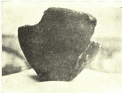
Εἰκ. 12. Ἀγγεῖον μέλανος στιλβώματος.