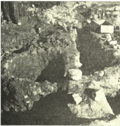
Εἰκ. 6. Τὸ φρέαρ τῆς οἰκίας Β.

Πολὺ ἐλλιπέστερον διατηρεῖται ἡ πλησίον τῆς θαλάσσης οἰκία Β, τῆς ὁποίας σφύζεται μόνον ἡ ΝΑ γωνία (εἰκ. 2 καὶ 5)· ὁ νότιος αὐτῆς τοῖχος σφύζεται εἰς μῆκος 3,90 μ., ὁ δὲ ἀνατολικὸς 2,50 ἀπὸ τῆς γωνίας τῆς οἰκίας. Τὸ ὕψος των δὲν ὑπερβαίνει τὰ 40 ἑκατοστά. Εἰς τὸ μέσον τοῦ νοτίου τοῖχου ὑπάρχει ἐν φρέαρ διαμέτρου 1,05 μ. πάχους τοιχώματος 0,20 μ. Τὸ φρέαρ ἐνταῦθα δὲν διέκοψεν ἐντελῶς τὸν τοῖχον ἀλλὰ μόνον ἐφάπτεται αὐτοῦ (εἰκ. 6). Ἀπὸ τῆς βορείας παρειάς τοῦ φρέατος ἐκκινεῖ μικρὸς τοῖχος πρὸς Β ἐλάχιστα μόνον σφύζομενος, σχεδὸν δὲ εἰς τὸ ὕψος τῆς θαλάσσης ὥστε ἦτο ἀδύνατος ἡ λεπτομερῆς του ἔρευνα· τὸ αὐτὸ δύναται νὰ λεχθῆ καὶ διὰ μικρὸν λιθόστρωτον κατέχον τὸν μεταξὺ τῆς γωνίας τῆς οἰκίας καὶ τοῦ φρέατος