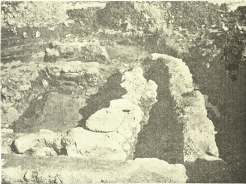
Εἰκ. 9. Τὸ νότιον δωμάτιον τῆς οἰκίας Γ μετὸν διπλοῦν τοῖχον.

Περὶ τῶν εὐρημάτων ἐν τῷ συνοικισμῷ τούτῳ ἀποτελουμένων ἀποκλει-