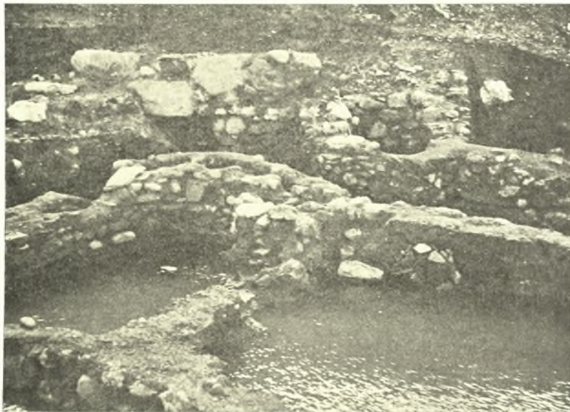
Εἰκ. 3. Ὁ προϊστορικὸς συνοικισμὸς Νάξου ἀπὸ Ἀνατολῶν. Ἐμπρὸς ἡ οἰκία Γ, ὀπισθεν ἡ οἰκία Α μετὰ τοῦ φρέατος.