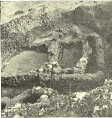
Εἰκ. 8. Ἡ οἰκία Γ.

Ὡς βέβαιον δύναται νὰ θεωρηθῆ ὅτι ὁ καμπυλόγραμμος χῶρος εἶναι μεταγενεστέρα προσθήκη εἰς τὸν ὀρθογώνιον· δυστυχῶς δὲν δύναμαι νὰ εἶπω πόσον μεταγενεστέρα, ἀκριβῶς ἐπειδὴ τὰ μεταξὺ τῶν δύο τοίχων ὄστρακα τὰ ἐν ἀμφοτέροις τοῖς διαμερίσμασι καὶ κυρίως τὰ ὑπὸ τὸν διπλοῦν τοῖχον ὄστρακα ἀνήκουν εἰς τὴν αὐτὴν γενικῶς περιόδον. Διότι οἱ δύο μικροὶ τοῖχοι εἶναι