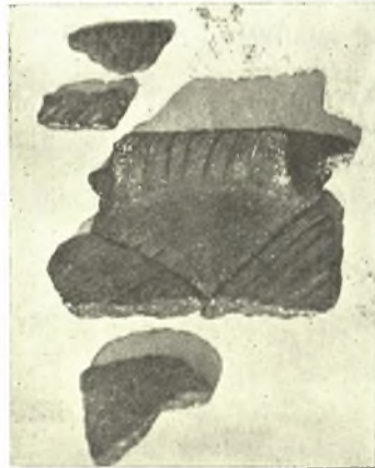
Εἰκ. 11. Ὅστρακα ἐκ μεγάλου προϊστορικοῦ ἐγχαράκτου ἀγγείου.