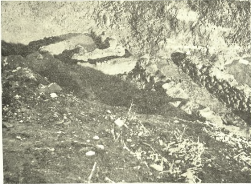
Εἰκ. 2. Ἀριστερά : οἰκίαι Α καὶ Β· δεξιά : τμήμα τῆς οἰκίας Γ.