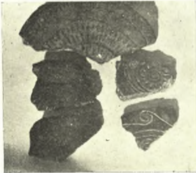
Εἰκ. 10. Ὅστρακα προϊστορικῶν ἐγχαράκτων ἀγγείων.

Πρὸς τὸ δυτικὸν πέρασ τῆς Γκρόττας ἀνευρέθη μεταξὺ τῶν χωμάτων καὶ μικρὰ μαρμαρίνη κεφαλὴ παριστῶσα γενειοφόρον μετὰ περικεφαλαίας ἐκ δέρματος, τοῦ 3 ου ἢ 4 ου μ.Χ. αἰῶνος.