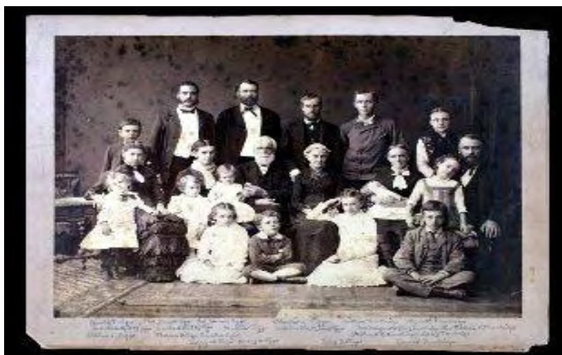
Οικογένεια Ριγκς, Κωνσταντινούπολη, 1882

από δέκα χρόνια ( “Memorial Service for the Late rev. Elias Riggs, D.D., LL.D.” σ. 10). Η αφοσίωση και η θέρμη του για το ιεραποστολικό του έργο τον μετέτρεψαν σε ένα από τους πιο δυναμικούς ιεραποστόλους της εταιρείας αφού ακόμα και το διάστημα λίγο πριν αφήσει τη τελευταία του πνοή εργαζόταν με πάθος για το σκοπό που είχε ορίσει στη ζωή του.