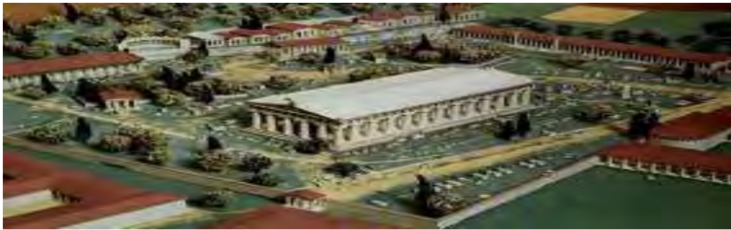
Εικόνα 1: Ιερά Άλτης